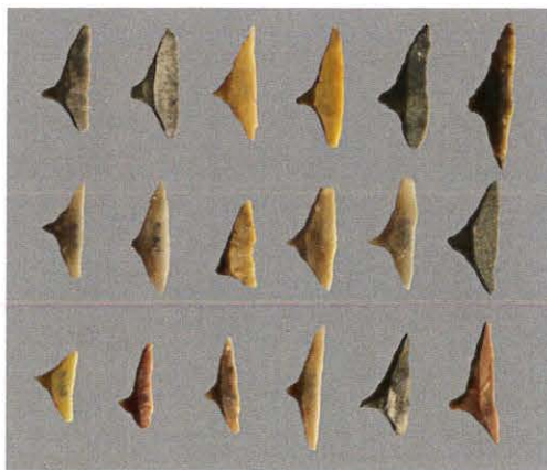
Figura 2. Geométricos recuperados en Cueva de la Cocina (intervenciones Luís Pericot).