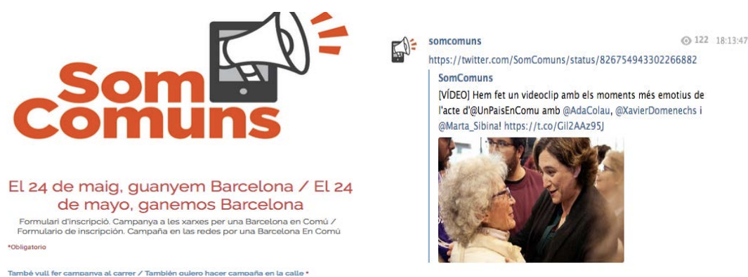
Imágenes 1 y 2. Cómo participar en Som Communs