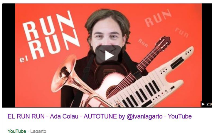
Imagen 5. El Run Run