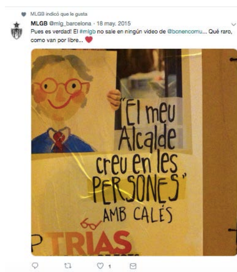
Imagen 9. MLGB : crítica a la oposición

observar uno de sus lemas de campaña ‘El meu alcalde creu en les persones’ 2 . Los activistas gráficos reformulan el mensaje construyendo la frase ‘El meu alcalde creu en les persones amb calés’ 3 y lo publicaron en sus redes sociales.