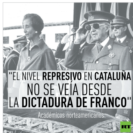
Figura 1. https://www.facebook.com/ActualidadRT/photos/a.10150446154883273/10156211289553273/?type=3&theater

Dado que la variable mide el nivel de proximidad del post con la perspectiva independentista, cuando aparecen varios indicadores en la misma dirección, se clasifica en el nivel más próximo a cada extremo. Con indicadores a favor y en contra, se clasifica en el nivel medio, correspondiente a una cobertura equidistante. En el caso de que una publicación tenga un enlace y la información de éste entre en contradicción con el titular del post, tendrá preferencia el titular que aparece en la página de Facebook.