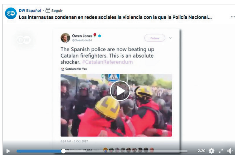
Figura 2. https://www.facebook.com/dw.espanol/videos/1726093210758094

Asimismo, en una crónica sobre las imágenes en redes sociales de la jornada del referéndum (figura 2), DW (02/10/2017) reproduce un vídeo compartido en Twitter por el político inglés, Owen Jones, donde fuerzas antidisturbios se enfrentan a un grupo de bomberos catalanes, supuestamente durante la jornada del referéndum del 1 de octubre de 2017. Esas imágenes son en realidad de unas protestas de 2013.