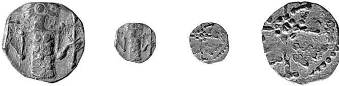
Figure 1 - Sceat de Torrecampo (Cordoue, Espagne) (agrandissement x 2).

Cette note rend compte de la découverte fortuite dans les environs de la ville de Torrecampo (province de Cordoue, Andalousie, Espagne) d'une exceptionnelle sceat d'imitation mérovingienne émise à Marseille (figure 1). La pièce nous a récemment été présentée par un collectionneur ; elle a été trouvée il y a plusieurs décennies et n'avait pas été correctement identifiée jusqu'à présent 1 .