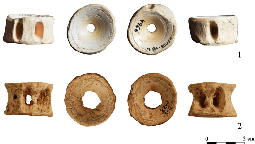
FIGURA 5. 1. Vértebra de La Moleta del Remei. 2. Vértebra de El Puig.

(Alcoi) nos permitió documentar y analizar esta vértebra modificada. Está completa (2,5 x 1,7 cm), con una perforación central en el canal medular de forma circular (0,9 cm). Su estado de conservación, en general, es bueno, aunque presenta abrasiones y desgaste, especialmente en uno de los laterales (figura 5: 2). La fisonomía general de la pieza, así como sus dimensiones y el dibujo de los forámenes articulares para la inserción de los cartílagos de los arcos hemal y neural, inducen a pensar que se trata de una vértebra de otro tiburón de grandes dimensiones, en esta ocasión de la familia Carcharhinidae , quizás un tiburón jaquetón ( Carcharhinus falciformes ) o un tiburón trozo ( Carcharhinus plumbeus ).