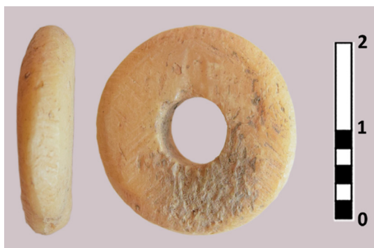
FIGURA 1. Cuenta de hueso del Puig de Sant Andreu. MAC-Ullastret nº inv. 1477.

1995: 240 y 256), La Bastida de les Alcusses (Moixent, València) (Fletcher et al., 1969: 140), Mas Castellar (Pontós, Girona) (Pons, 2002: 408-409), el Puig de Sant Andreu (Ullastret, Girona) (Oliva, 1957: 277-278, fig. 3.2) y en necrópolis como El Cigarralejo (Mula, Murcia) (Cuadrado, 1987) o Coimbra del Barranco Ancho (Jumilla, Murcia) (García Cano et al., 2008) (figura 1).