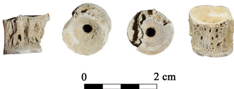
FIGURA 6. Vértebra del Puig de la Misericòrdia.