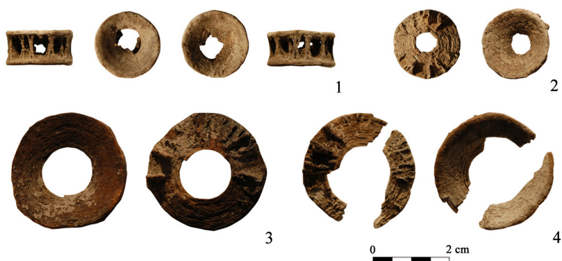
FIGURA 3. Vértebras de la tumba 200 de El Cigarralejo.

fracturadas, se puede deducir que todas pertenecen al mismo espécimen. Por la amplitud de la abertura de estas lamelas y las dimensiones de las vértebras, que son los únicos rasgos diagnósticos en este caso, se trataría de vértebras de un gran tiburón de la familia Lamnidae, posiblemente un marrajo sardinero ( Lamna nasus ) (figura 3). Estas cuatro vértebras perforadas, podrían pertenecer a un collar compuesto, junto a las 35 cuentas discoidales de hueso, y las 7 pequeñas perlas de pasta vítrea recuperadas como parte del ajuar.