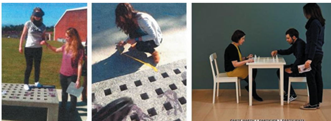
Figura 3. Imágenes izquierda y centro. Itinerarios basados en la obra “Play it by trust” de Yoko Ono..

Se realizaron, asimismo, varias propuestas a partir de la obra de la artista Yoko Ono, cuyas piezas estaban expuestas en el Museo Guggenheim de Bilbao en el momento de la actividad. Una de estas propuestas planteaba un recorrido no habitual de la facultad donde una alumna actuaba de guía y otra con los ojos cerrados hacía uso del espacio confiando en aquello que su compañera le indicaba.