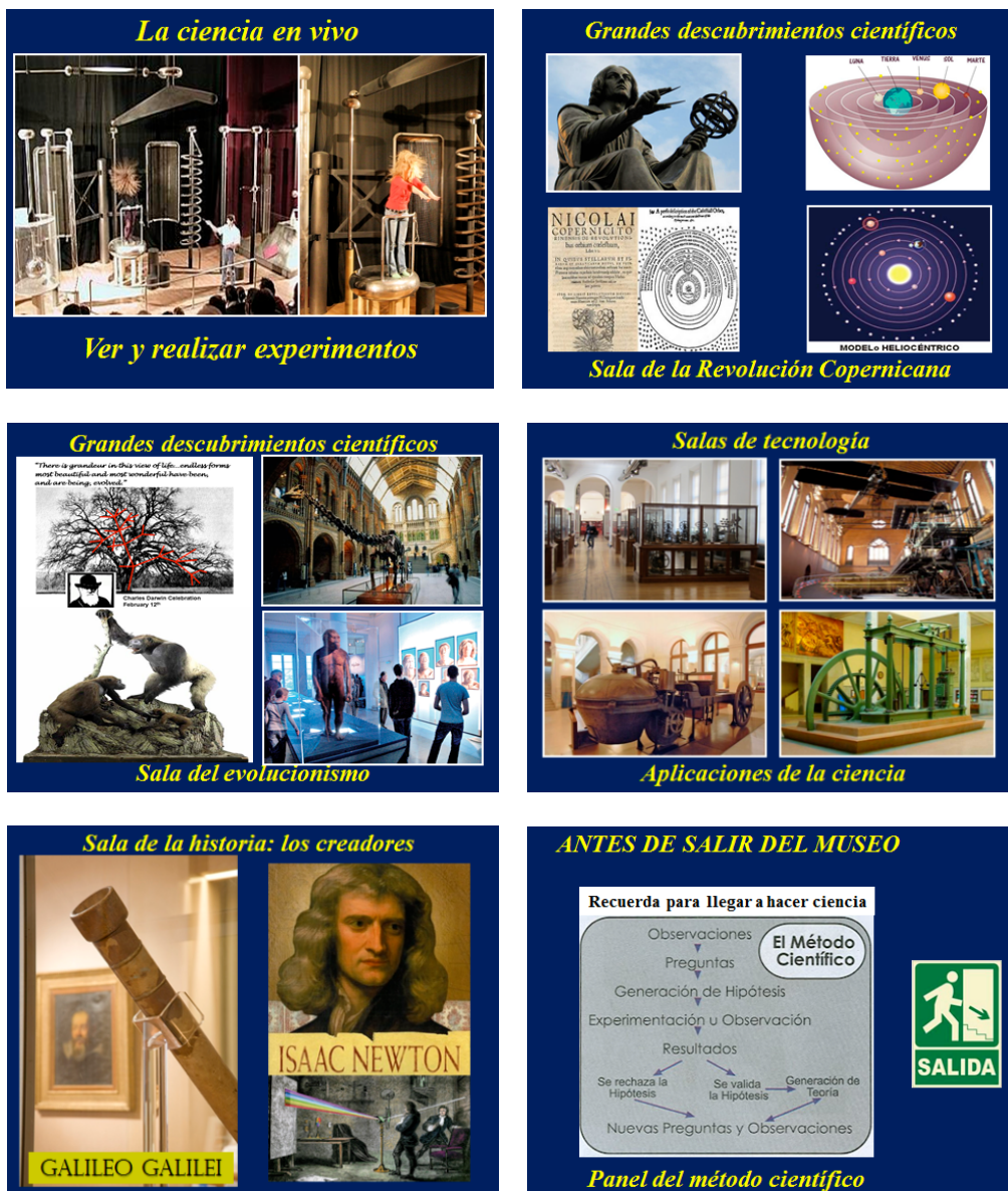
Fig. 2. Selección de las salas de un museo virtual para su análisis individual