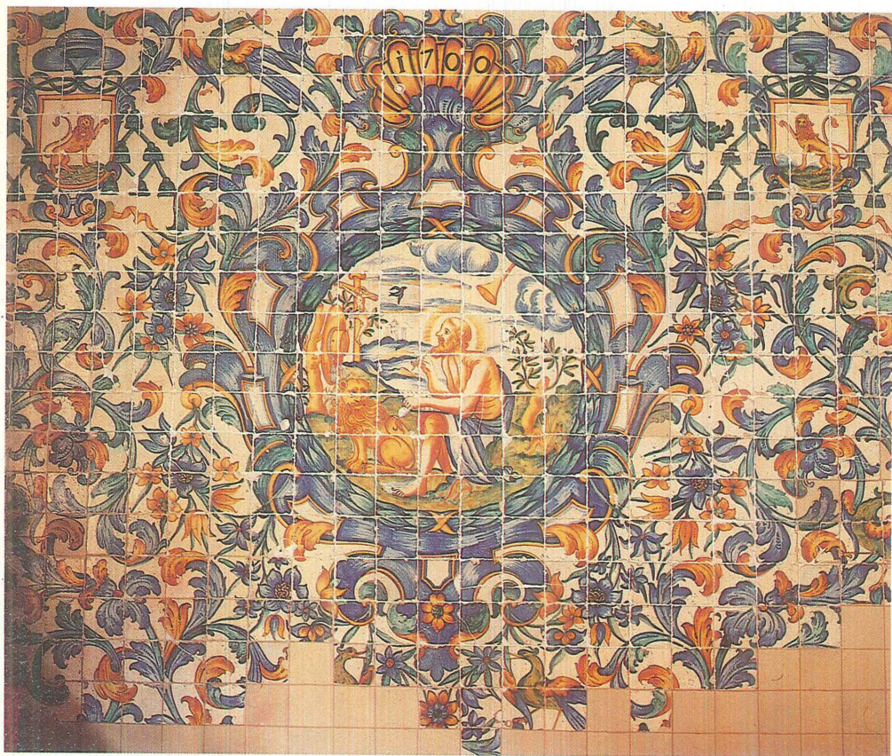
Plafó de ceràmica, de 1700, amb la figura de sant Jeroni al centre, al Col·legi de l'Art Major de la Seda de València.