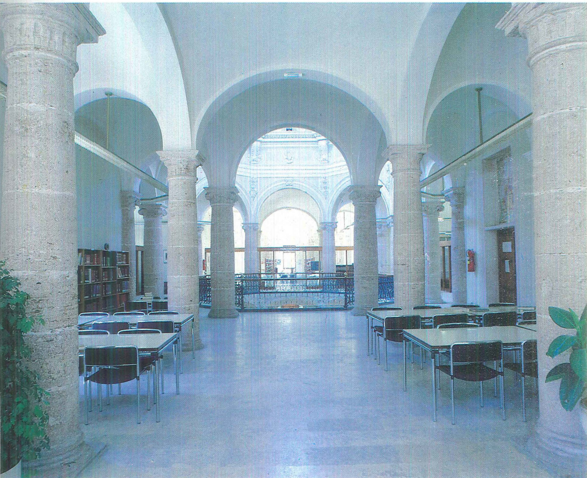
Nau central i creuer de l'antic Hospital de València.