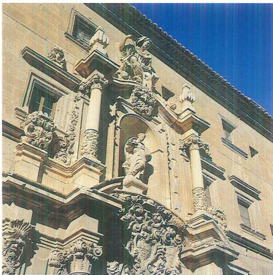
Detall de la porta d'entrada de l'antiga universitat d'Oriola.