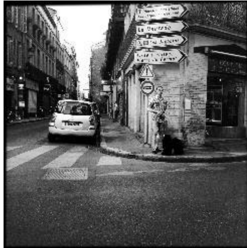
Figura 4. "Comptoir de l'or". Fotografía. Obra de Francesc Vera expuesta en Museari .

El autor nos ofrece una imagen tomada al azar en una ciudad del sur de Francia. Un joven espera y atiende en una verdadera encrucijada de caminos. Las opciones son muchas, pero la verdadera elección supone aceptarse a sí mismo, evitado así el sufrimiento que generan las propias cárceles.