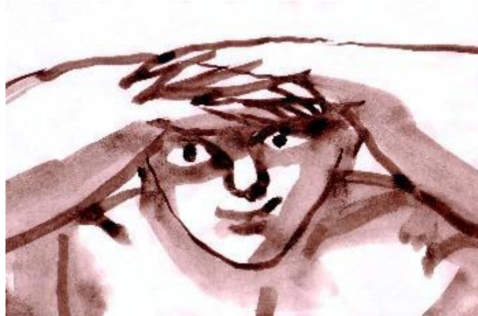
Figura 6. "Observador". Pintura. Obra de José Manuel Guillén expuesta en Museari .

Atento y paciente, un joven mira hacia el futuro. El arte permite una mirada más abierta y significativa de nuestros propios procesos de conocimiento. La curiosidad es un camino lleno de sorpresas. Las prohibiciones forman parte del lenguaje del poder.