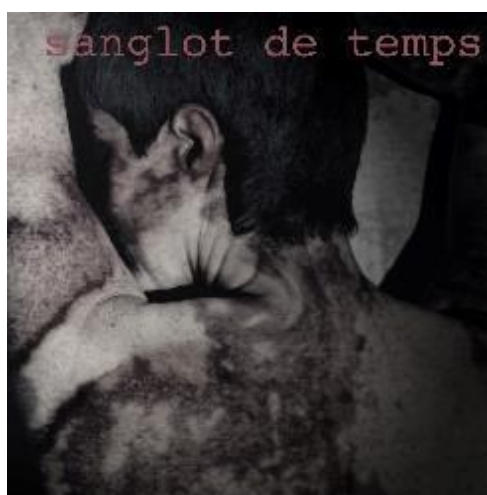
Figura 3. "Sanglot de temps". Fotografía. Obra de Nora Ancarola expuesta en Museari .

El artista chileno evidencia con su imagen el desequilibrio del sistema educativo chileno, la falta de equidad y la problemática constante que genera. También alude a la problemática del bullying, ya que el acoso escolar entre alumnado diverso sigue siendo preocupante.