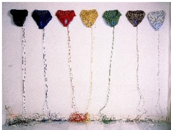
Figura 7. "7 palabras acerca de la sexualidad". Instalación. Obra de Maribel Doménech expuesta en Museari .

Atento y paciente, un joven mira hacia el futuro. El arte permite una mirada más abierta y significativa de nuestros propios procesos de conocimiento. La curiosidad es un camino lleno de sorpresas. Las prohibiciones forman parte del lenguaje del poder.