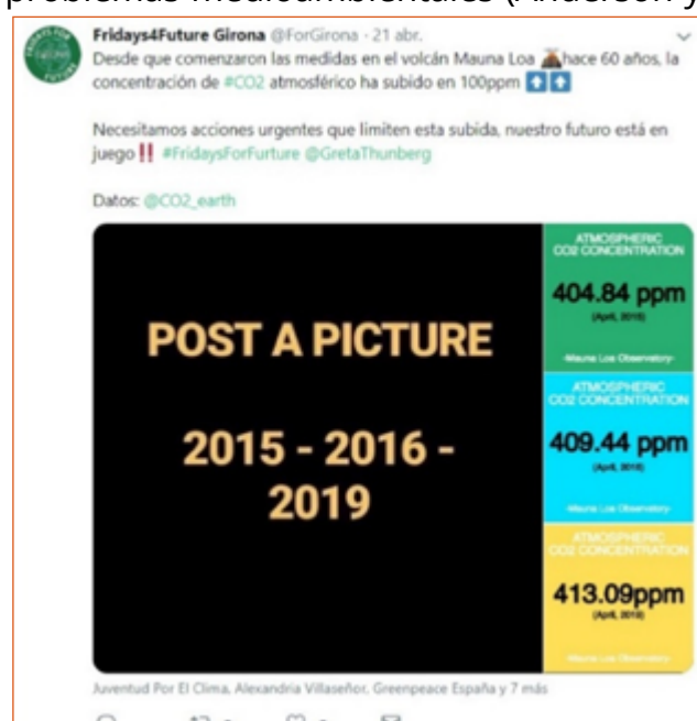
Imagen 4. Tuit de Fridays4Future Girona sobre la concentración de CO2 atmosférico.

Las protestas se concentran ante las sedes de las administraciones públicas de mayor rango en cada ciudad. Desde los inicios con la huelga de Thunberg en Suecia, el