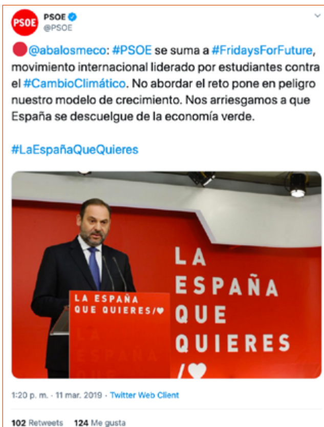
Imagen 8. Tuit del PSOE que apoya a #FridaysForFuture.