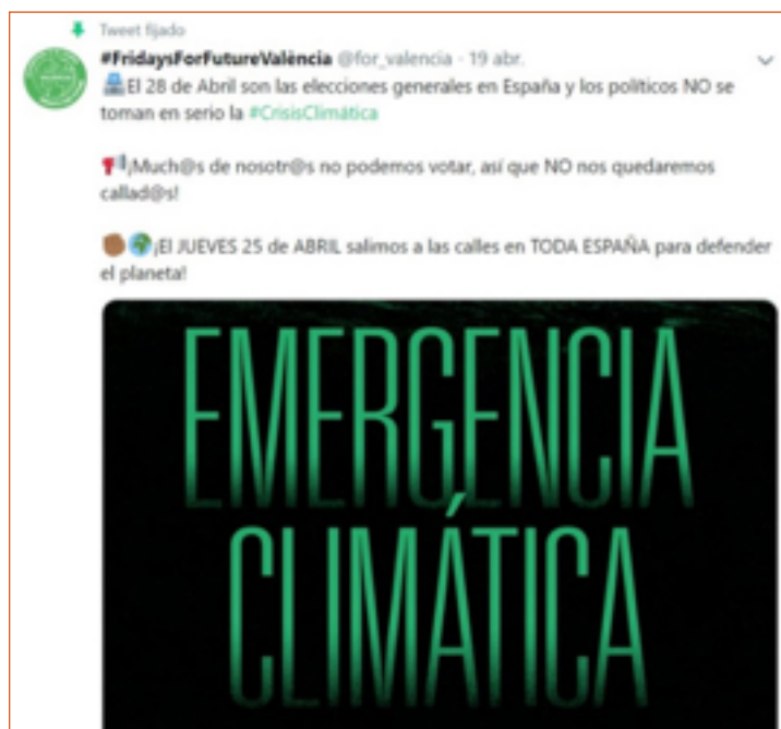
Imagen 11. Tuit de interés discursivo de #FridaysForFutureValència.