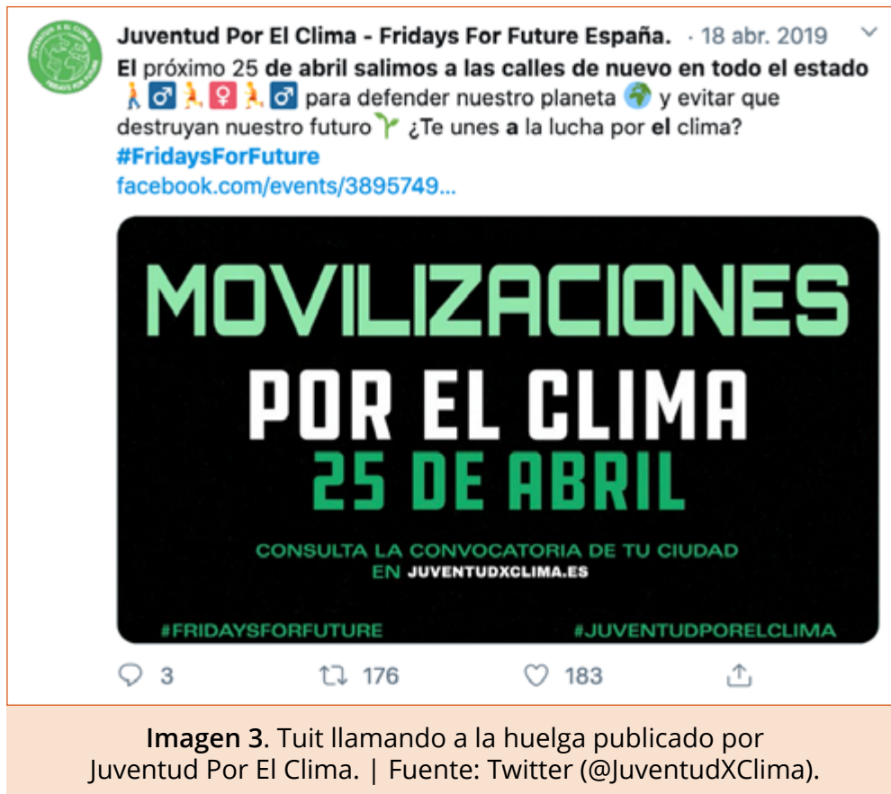
Imagen 3. Tuit llamando a la huelga publicado por Juventud Por El Clima.

mático. El objetivo es que estas estadísticas se viralicen, propiciando la concienciación ciudadana sobre la necesidad de actuar ante el cambio climático. Siguiendo esta línea se efectúa un tuit (ver Imagen 4) de Fridays4Future Girona, que expone cifras acerca del crecimiento sostenido del dióxido de carbono en la atmósfera.