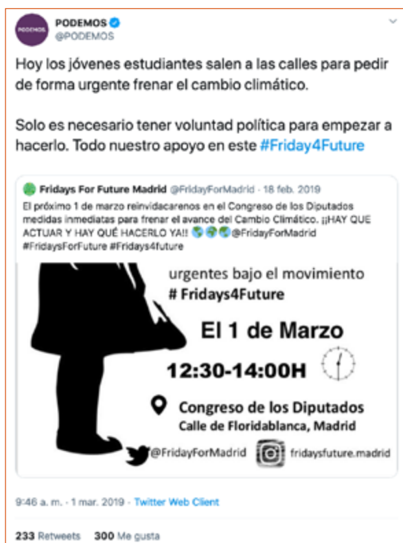
Imagen 6. Retuit con comentario de Podemos apoyando #FridaysForFuture.

Por otro lado, existen partidos políticos en España que han apoyado públicamente el movimiento, como PSOE, Podemos, Izquierda Unida y Equo. De todos ellos, Podemos es el que interactúa más claramente con los contenidos digitales publicados por las cuentas de #FridaysForFuture. Como se observa en la Imagen 6, el perfil nacional de Podemos retuitea con comentarios un mensaje de Fridays For Future Madrid, aportando información propia al contenido que apoyan con su retuit.