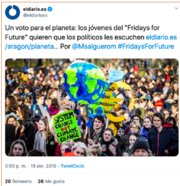
Imagen 7. Tuit de Eldiario.es con información acerca de #FridaysForFuture.

Mientras que el PSOE realiza una especie de declaración institucional en Twitter de apoyo al movimiento (ver Imagen 8), otras formaciones como Izquierda Unida o Equo trascienden del mero apoyo, utilizando el hashtag #FridaysForFuture para difundir contenido de interés relativo a la emergencia climática (Imagen 9).