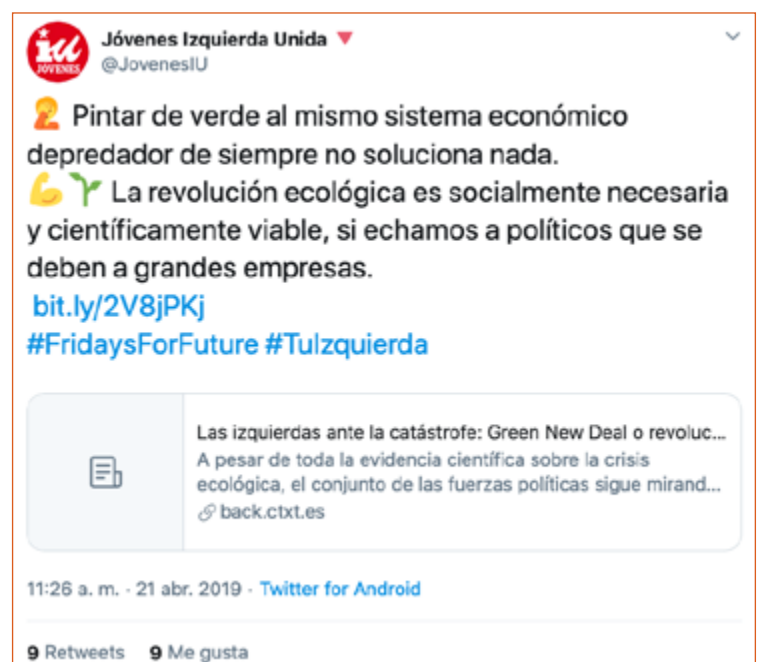
Imagen 9. Tuit de las Juventudes de Izquierda Unida que comparte bajo el hashtag #FridaysForFuture un artículo sobre la revolución ecológica.

1. El primero de ellos (Imagen 10) fue publicado por Juventud por El Clima el 20 de abril de 2019. En este mensaje, que constituye la primera referencia a un contenido televisivo en directo, se expone una pregunta escéptica sobre la falta de referencias al cambio climático en el debate electoral de los candidatos a la presidencia del Gobierno para las elecciones del 28 de abril. Esta cuestión se acompaña de un GIF de una persona también en estado