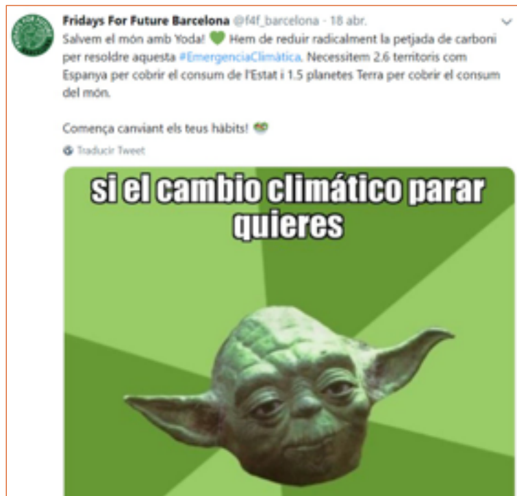
Imagen 12. Tuit de interés discursivo de Fridays For Future Barcelona.

3. El último tuit examinado pertenece a Fridays For Future Barcelona (Imagen 12), el primero del corpus que promueve un cambio de hábitos individuales. La información se distribuye en un párrafo extenso, que aglutina la mayor parte del contenido. Al él se le incorpora una frase final interpelativa y un meme de Yoda -personaje de Star Wars -, otra práctica comunicativa habitual entre la juventud. Los emoticonos en este caso se encuentran menos presentes, pero su dimensión ecologista resulta evidente, al publicar un plato de ensalada y un corazón de color verde.