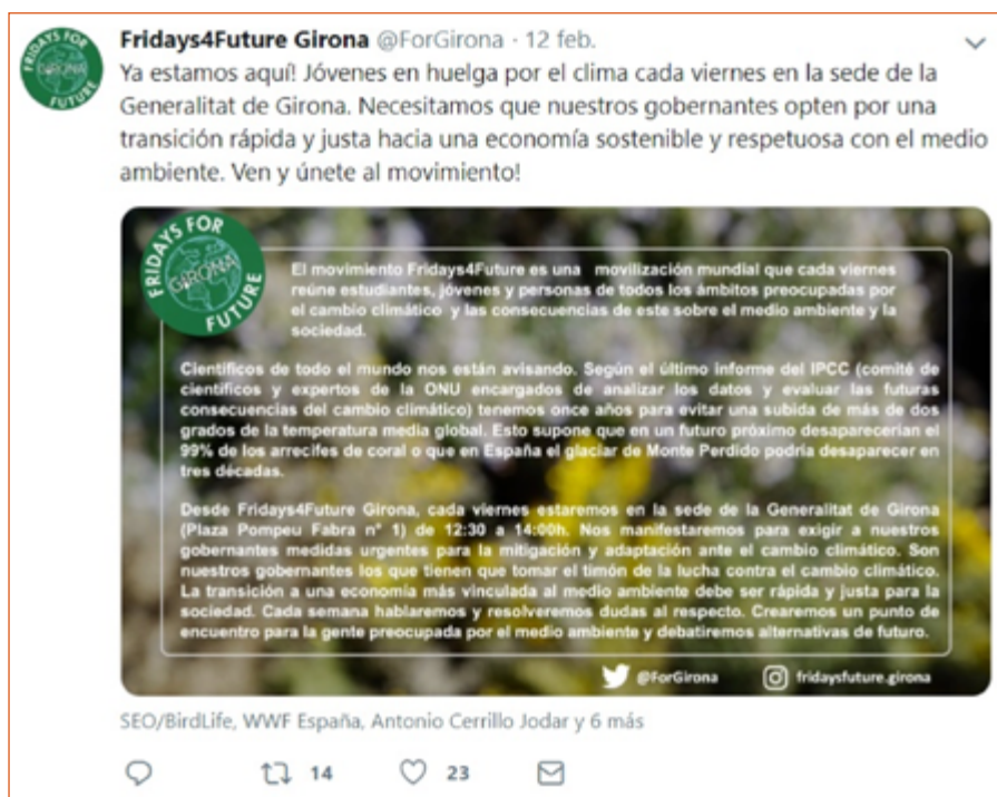
Imagen 2. Primer tuit de #Fridays4Future Girona.

Analizando los mensajes en Twitter lanzados por el movimiento en España, se observa una tendencia a emplear tuits explicativos, que amplían su contenido a través de una imagen dotada de texto (Imagen 2). Esto resultó especialmente notable en el nacimiento del fenómeno en este país, cuando se publicaron estos mensajes como forma de contextualizar las causas y objetivos de la iniciativa. Muchos de estos tuits permanecieron fijados en las cronologías de los perfiles de Twitter pertenecientes al movimiento.