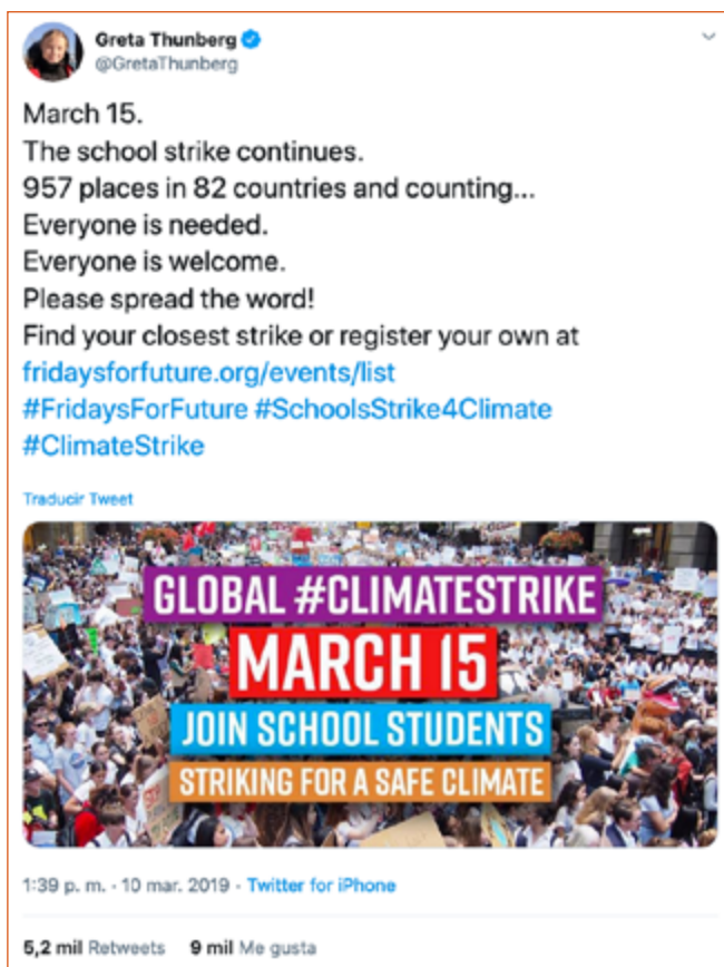
Imagen 5. Tuit de Thunberg con las posibles vías de participación.

En ese primer tuit de Fridays4Future Girona analizado se aprecia una voluntad por comunicar el movimiento a los grupos ecologistas, pero a su vez por llegar a los ámbitos mediático e institucional. También sucede de esta manera en el tuit aludido en la Imagen 3, el primero que llama a la huelga del 25 de abril. En él se etiqueta a la agencia EFE (a través de su delegación para medioambiente EFEVerde), las organizaciones Ecologistas en Acción, Greenpeace España, SEO/BirdLife, Amigos de la Tierra y Extinction Rebellion Spain, así como a Teresa Ribera, Ministra para Transición Ecológica.