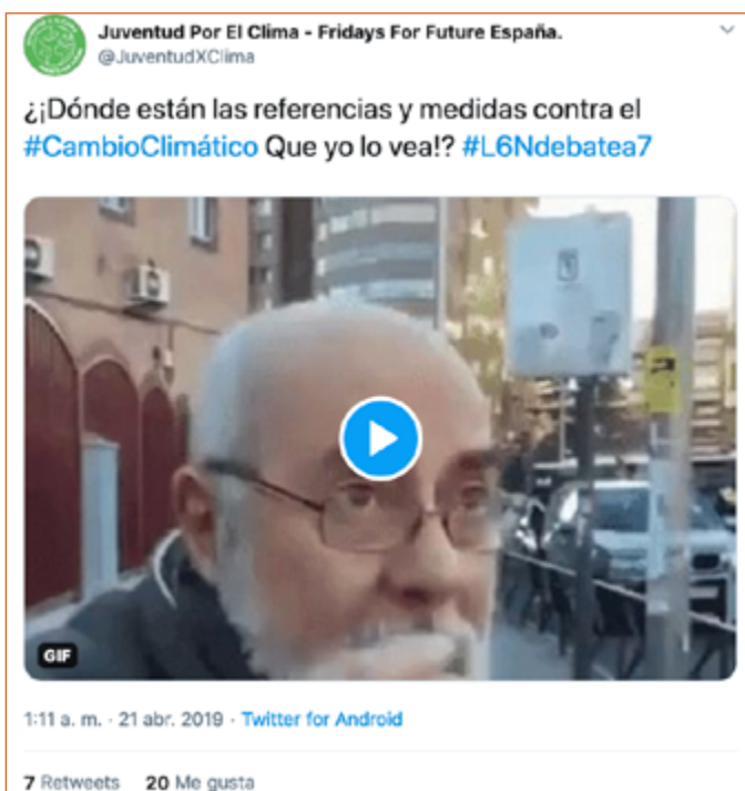
Imagen 10. Tuit de interés discursivo de Juventud Por el Clima.

En cuanto a la estructura, los dos primeros bloques siguen el esquema sujeto, verbo y predicado, paradigmático de las frases enunciativas. El tercero sitúa en primer lugar el complemento circunstancial de tiempo que cita la fecha de la protesta. No obstante, el elemento estructural más significativo es la presencia de un componente causal, a