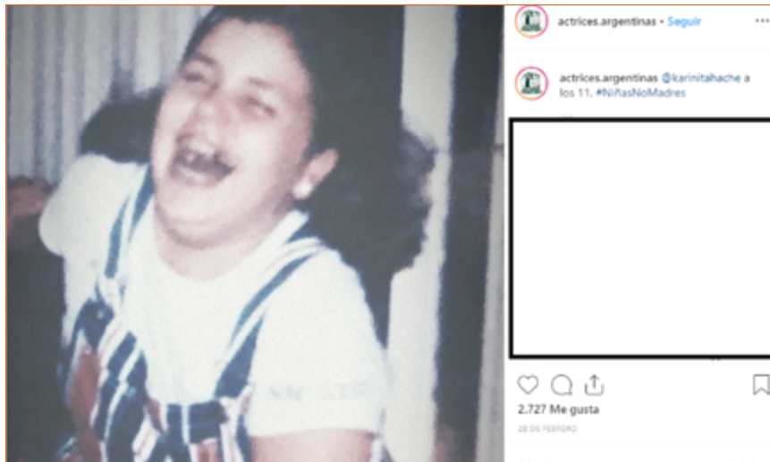
Imagen 3. Ejemplo de posteo con fotografía de baja calidad

y se puede inferir que estos adultos son padres, abuelas y madres de las protagonistas. En todos los casos estos adultos aparecen acompañando, protegiendo en el abrazo esa historia que suele contarse de la infancia, donde los roles de los adultos y de las niñas parecen estar bien delimitados. También se publican imágenes en las que aparece la niña acompañada de otros niños y niñas, y esto ocurre en el 13,50% (n=12) de los casos, transmitiendo una niñez lúdica que se despliega a partir de mostrar a las niñas en situaciones de juego con sus pares, tal como se ve en la Imagen 4, y en las que, a falta de explicación, resulta difícil identificar el tipo de juego del que participan.