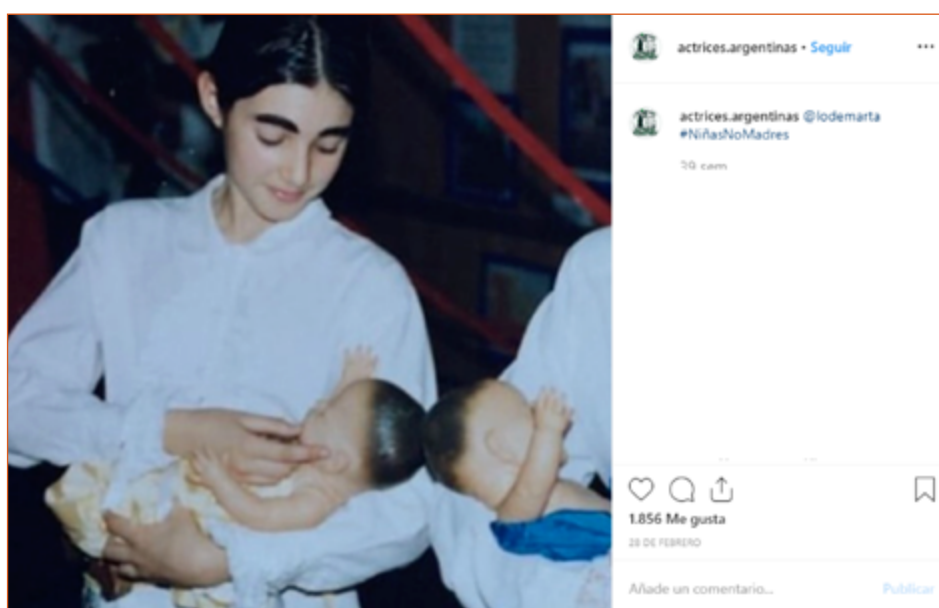
Imagen 8. Esta entrada de @lodemarta la muestra a la actriz de niña jugando a ser mamá, con un muñeco en brazos.

el provocador post de @lodemarta (Imagen 8) donde se muestra a la niña "jugando" a ser madre con un bebote, trazando un límite entre una escena ficcional sobre la maternidad y la realidad de la situación sobre el evento disparador de la campaña.