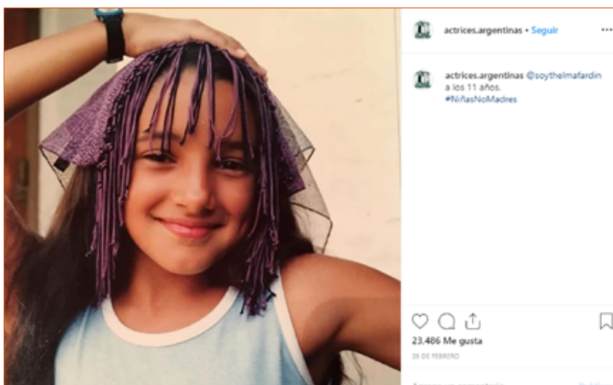
Imagen 5. Ejemplo de fotografía de niña localizada en un espacio que no está definido.

El segundo escenario dominante se configura en un espacio indefinido (32,48%, n=28). Esto es muy interesante, puesto que, en la mayoría de los casos, la ausencia de un ámbito concreto se repone con el primer plano sonriente de la niña que ocupa toda la imagen y que puede verse en la Imagen 5.