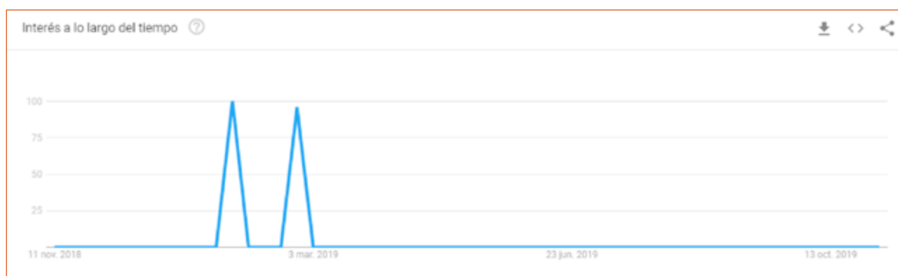
Imagen 10. Interés de los internautas sobre #NiñasNoMadres.

En este sentido, resulta interesante observar en el espacio digital el interés sobre la temática medida por Google Trends : el interés por el #NiñasNoMadres tiene tres picos de interés: del 27 de enero al 2 de febrero de 2019, período que concuerda con otro caso de características similares (Centenera, 2019b). Además, el 1 de febrero, se publica la editorial de La Nación (La Nación, 2019a). El siguiente período de mayor interés coincide con los días de la campaña de @actrices.argentinas. (Imagen 10).