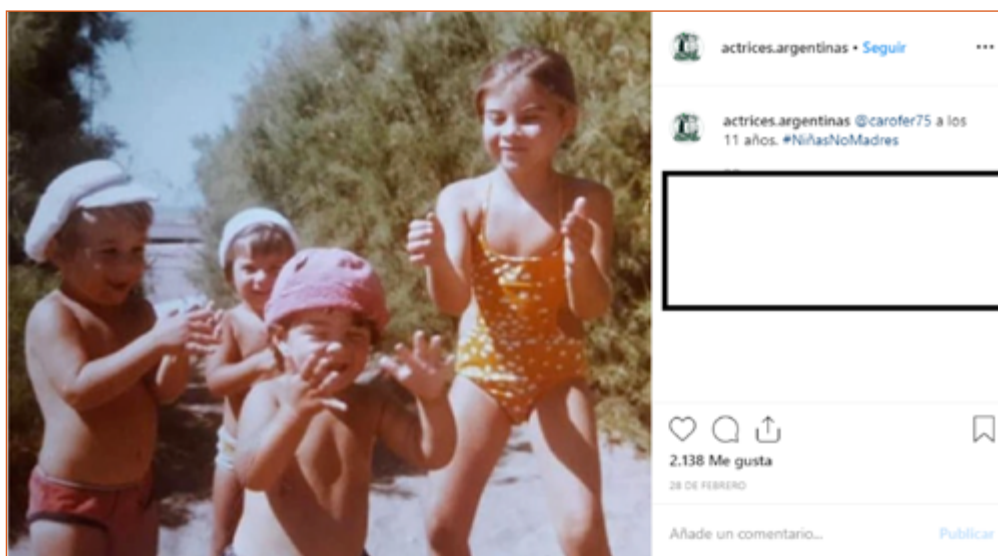
Imagen 4. La imagen reproduce la niña en juego con amigos y amigas.

Al observar los escenarios en los cuales se sitúan las protagonistas, se encuentra que un 32,58% (n=29) de las imágenes fueron tomadas en la casa. En este caso, las niñas interactúan espontáneamente con el lugar habitado, que se enmarca en la disposición de los objetos que circulan en el imaginario como propios del hogar, como el sillón, la silla, la mesa y los platos para comer. De esta forma, la niñez y lo cotidiano se revelan dentro lo esperable y de aquello que la mirada del internauta puede reconocer.