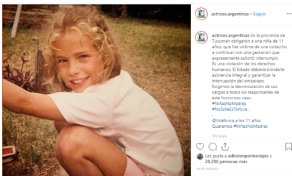
Imagen 2. Posteo que da comienzo a la campaña #Niñasnomadres en la cuenta @actrices.argentinas. 28 de febrero de 2018

colectivo en Instagram, a partir del uso #NiñasNoMadres. Comenzó en la cuenta @actrices.argentinas el 28 de febrero de 2019 con una foto de la actriz Dolores Fonzi de niña, acompañada por un texto (Imagen 2) 2 que sirve de introducción a toda la campaña.