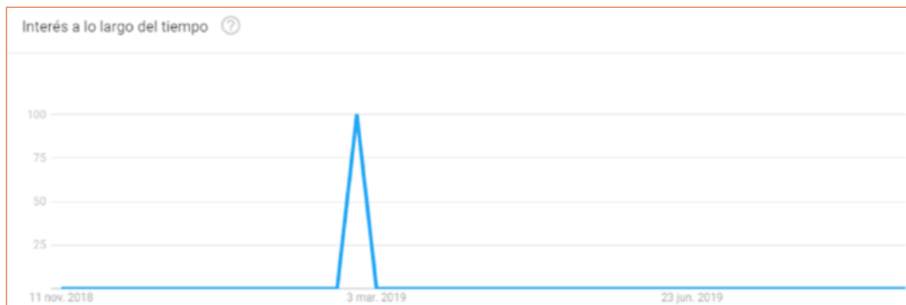
Imagen 11. Interés de los internautas sobre imágenes NiñasNoMadres.

En cambio, si se cambia el criterio de búsqueda y se rastrea el mismo hashtag , pero solo las búsquedas de imagen, todo el interés se concentra en los días de la campaña, esto es 28 de febrero de 2019 y 1 de marzo de 2019 (Imagen 11).