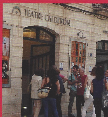
22. La Mostra de Alcoi