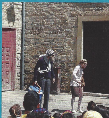
6. Kaldearte de Vitoria