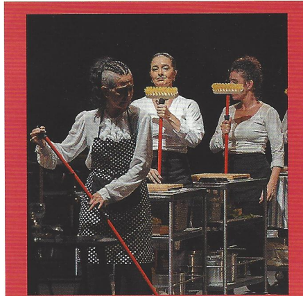
14. Diario de un 'fitero'