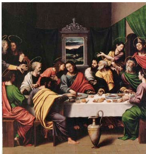
Fig. 8.- Santa Cena. Joan de Joanes 26

El último retablo que adornó la capilla de San Eloy databa de 1751-1753, de estilo neoclásico; estuvo realizado con “mármoles de Génova, piedras negras de Murviedro y jaspes de Náquera”. Sustituyó al desmantelado de Ribalta y conservaba en su centro una hornacina con la primitiva imagen de San Eloy.