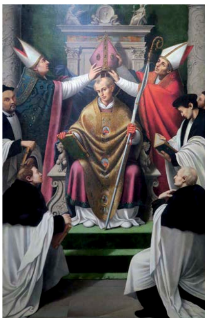
Fig. 5.- Consagración de San Eloy como Obispo de Noyon

Esta obra fue desmontada en el siglo XVIII, procediendo a la venta y dispersión de las pinturas. La investigación del profesor Benito Alonso proporcionó la actual ubicación de siete de ellas 21 . Así, la Santa Cena y el Sueño de la madre de San Eloy en presencia del rey de Francia están conservadas en el Museo de Bellas Artes de Valencia; el Cristo con la cruz a cuestas permanece en el Prado (Madrid); la Consagración de San Eloy como Obispo de Noyon en el Museo de la Universidad de Arizona, en Tucson (Lám V), mientras que en la Iglesia de San Martín de Valencia se conserva la tabla de San Eloy entregando la silla de oro al rey de Francia . La Oración en el Huerto no ha sido localizada y la imagen de San Pedro , que figuraba en la predela, es de propiedad particular (Lám. VI) 22 .