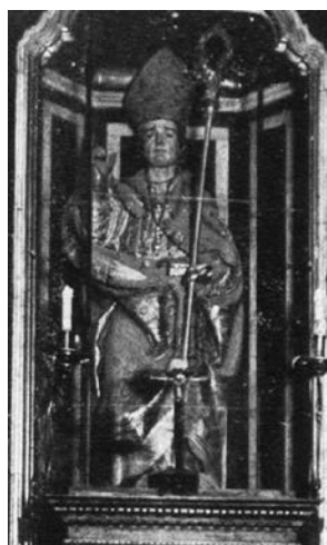
Fig. 2.- Imagen de San Eloy 11

Esta escultura, de bulto redondo, representa al santo con vestiduras de obispo, tocado con mitra, portando en su mano izquierda libro y báculo, mientras que su derecha permanece alzada; la cabeza y las manos mostraban encarnaciones. La obra requirió con el tiempo diversas actuaciones de restauración; así, fue dorada y encarnada por Vicent y Joan Macip en 1534; en 1587, fue mejorada por el platero Aloy Camañes, siendo Francisco Ribalta, a principios del siglo XVII, quien realizó sobre ella algunos trabajos de rehabilitación. La figura se mantuvo en la capilla hasta los inicios de la guerra civil, cuando fue destruida. (Lám. II).