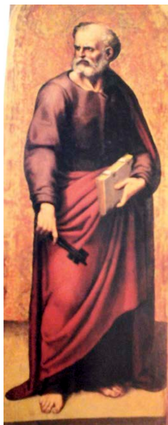
Fig. 6.- San Pedro

En este sentido, José Gómez Frechina sacó a la luz, en 2013, dos tablas anónimas, conservadas en una colección particular valenciana, que identificó como las del retablo perdido de la capilla de plateros en la iglesia de Santa Catalina Mártir de Valencia. Las tablas representan al Arcángel San Gabriel y a la Virgen Anunciada, escenas que estaban incluidas en las polseras superiores del retablo (Lám. VII). El investigador las atribuye a Francisco Ribalta; sin embargo, el hecho de que la corporación platera decidiera no incluirlas en el retablo reconstituido por este artista induce a plantear si se trata de obras del retablo de Joan de Joanes, o bien copias del mismo, realizadas por Ribalta, a pesar de que no se expusieran en el retablo definitivo 23 .