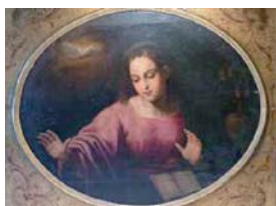
Fig. 7.- Anunciación 25