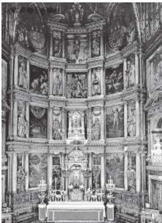
Fig. 4.- Guadalupe. El retablo en la actualidad.