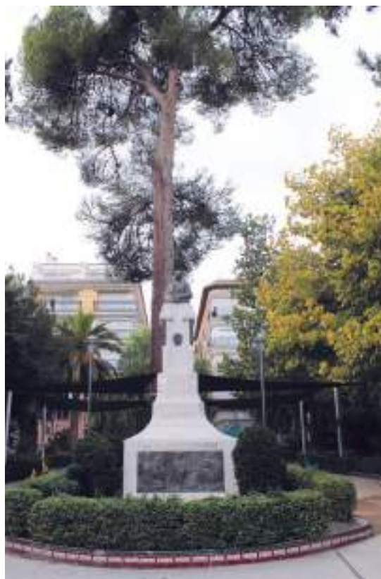
Fig. 9.- PINAZO MARTÍNEZ, Ignacio. Monumento a Roque Martínez Pérez . Bronce y piedra blanca, 1928. Jardín y Plaza del Rey Don Pedro. La obra fue realizada por encargo del letrado José Guardiola Pérez, amigo personal del escultor.

El mobiliario urbano está compuesto de cuatro bancadas de asientos en torno de la rotonda de la fuente, de 213 cm. de longitud cada uno de ellos, revestidos de azulejos cerámicos polícromos, que inscriben en el respaldo y en los laterales del reposabrazos el escudo de la ciudad con la leyenda “Parque de Jumilla”, y en el frontispicio del asiento figuras de animales, realizados