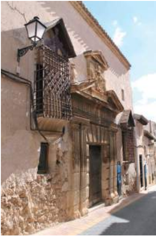
Fig. 2.- Jumilla. Casona solariega de Pérez de los Cobos, luego de los Cutillas y posteriormente de los barones del Solar de Espinosa, con frontón partido y escudo nobiliario sobre la portada vignolesca de fines del siglo XVI y ventanas protegidas por extraordinaria rejería castellana con heráldica. (Foto Javier Delicado, 2015).

El siglo XVII se inicia con la expulsión de los moriscos (1609-1614) y con una serie de epidemias que hacen estragos en la población (particularmente las de 1619 y 1676), mientras que al final de la centuria la villa crece hacia el este lo que trae consigo la creación de la Plaza de Abajo, que obliga a trasladar el mercado a este nuevo ámbito, más capaz, de planta cuadrada, hallándose próximo el hospital de Santo Espíritu en la calle del Convento (que es la que va desde la plaza al convento de las Llagas de San