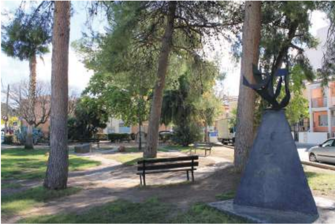
Fig. 20.- Jumilla. Jardín de Manuel Azaña (Plaza de Pablo Picasso) . Sobre un bloque piramidal de hormigón, monumento vanguardista en hierro dedicado al escritor y político republicano. (Foto Javier Delicado, 2015).