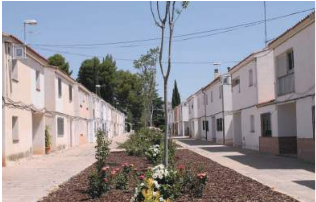
Fig. 22-1 y 22-2.- Jumilla. Jardín Botánico de la Estacada (Pueblo Nuevo en la pedanía del mismo nombre, a 1 Km. al sur de la ciudad, junto a la carretera de Cieza). Zona verde de diseño paisajístico y carácter naturalista, de un poblado agrícola de colonización de viviendas unifamiliares, proyectado por el arquitecto José Luis Fernández del Amo Moreno, que surgió en la década de 1960 promovido por el IRIDA, con lago, puentes y más de un centenar de especies de árboles, arbustos y coníferas sobre praderas de césped y senderos de tierra y piedra caliza. (Fotos Javier Delicado, verano de 2016).