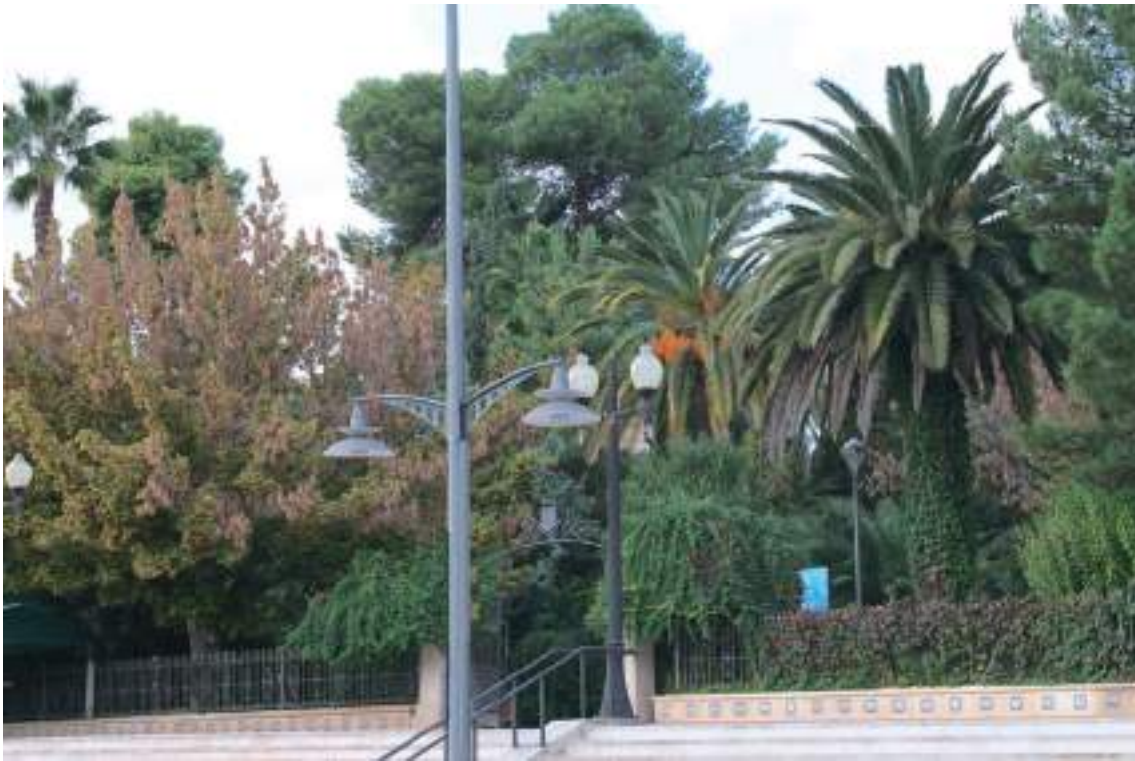
Fig. 24.- Jumilla. Jardín y Plaza del Rey Don Pedro . Vista desde el lado sur con la verja de cerramiento y detalle del zócalo con azulejos cerámicos.