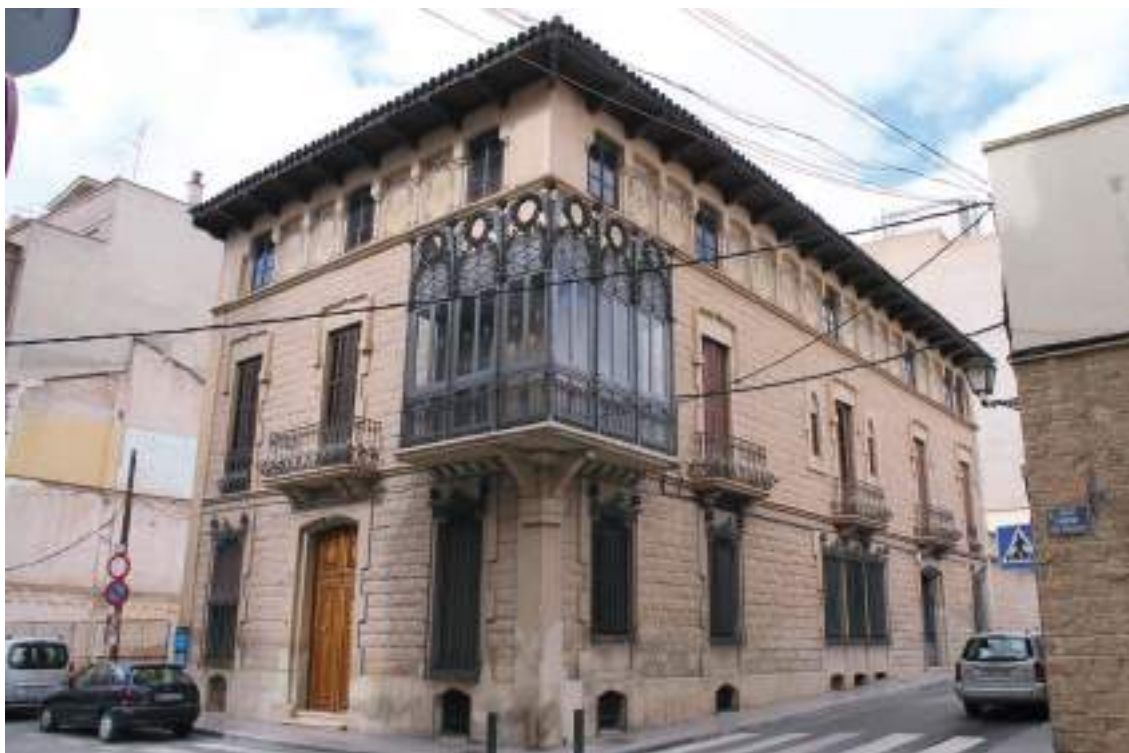
Fig. 4.- Jumilla. Casa de José Mª Guardiola Porras . Edificio de vivienda modernista proyectado por el arquitecto catalán Joan Alsina i Arús en 1910, con cerrajería artesana en huecos y mirador de esquina, de Avelino Sánchez.

de acceso), tratándose de un conjunto de edificaciones residenciales, proyectadas acaso por el maestro de obras Antonio Palencia Muñoz, donde cada uno de los zaguanes da acceso a una sola vivienda con fachada jerarquizada que se diseña de forma unitaria englobando los tres edificios siguiendo un lenguaje ecléctico, con bajo, piso noble y planta alta con balcones, cubrepersianas y rejas trabajadas en hierro fundido. Lo mismo se podría indicar de otros inmuebles situados en esta calle, como el rotulado con el núm. 27, construido entre medianeras.