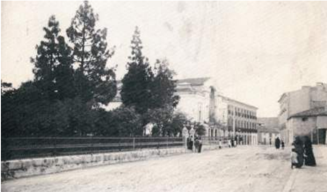
Fig. 5.- Jumilla. Jardín de la Glorieta , proyectado por el arquitecto y urbanista José M a Marín Baldo Caquia durante el último cuarto del siglo XIX, que ocupa el solar del atrio y huerto del extinguido convento franciscano de Las Llagas. (Foto antigua de hacia 1915).