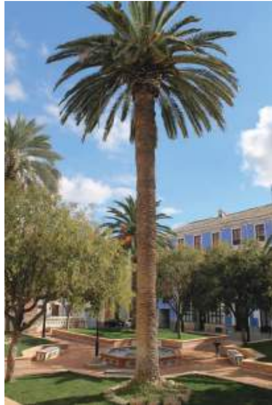
Fig. 16.- Jumilla. Jardín de las Ranas . Vista del conjunto desde el lado norte, remozado en su integridad a finales de 2014, decorado con bancos cerámicos de la manufactura “Artesanía Cerámica Campos, S.L.”, de Camas (Sevilla), actuales.

establecimientos comerciales que ocuparon los edificios del entorno a promedios de la centuria (Círculo Jumillano, Kiosko de Juan Núñez, Tejidos “El Metro”, Sombrerería de J. Conca, Carnicería de Bautista Martínez, Peluquería de Marceliano, Bodegas del barón del Solar, establecimientos bancarios...)51.