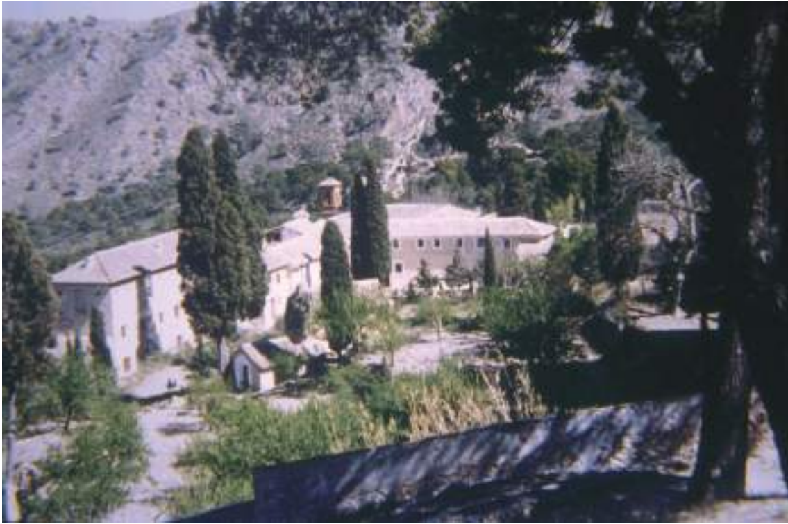
Fig. 23.- Jumilla. Huerto del Convento franciscano de Santa Ana del Monte (Siglos XVI-XVIII), a las faldas del Picacho y a los pies de la Fuente de la Jarra, un pintoresco paisaje entre fuentes y pinares, presidido por pinos centenarios, cipreses de elevada altura, carrascas y madroños..

En este ámbito de retiro espiritual tiene cabida un espléndido huerto, situado en la parte posterior del convento, del maestro de obras Matías López, rodeado de una tapia de obra (de 1607) y organizado con sus correspondientes calles o andadores cuyo empedrado fue colocado en 1750, en el que crecen todo tipo de plantas y arbustos (pinos con más de 600 años, cipreses de gran altura, almendros, carrascas, romeros y madroños), además de ubicarse siete ermitas para retiro de los frailes en días de penitencia cuaresmal, que conservan azulejería valenciana dieciochesca. Llama la atención en el huerto la zarza que crece sin espinos, plan-