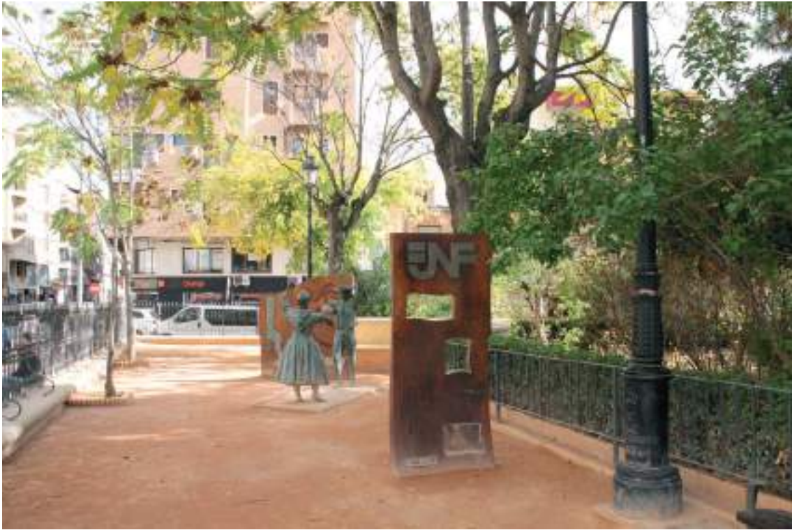
Fig. 7.- Jumilla. Jardín de la Glorieta. “Monumento al Folklore” (2008), con las figuras de dos danzantes realizadas en bronce, obra del escultor Bartolomé Medina Abellán, delimitadas por dos bloques verticales de acero corten.

convento, que consigue aislarnos del entorno, creando una especie de isla verde en medio de la ciudad, a pesar de la presión de edificaciones en su perímetro en la actualidad.