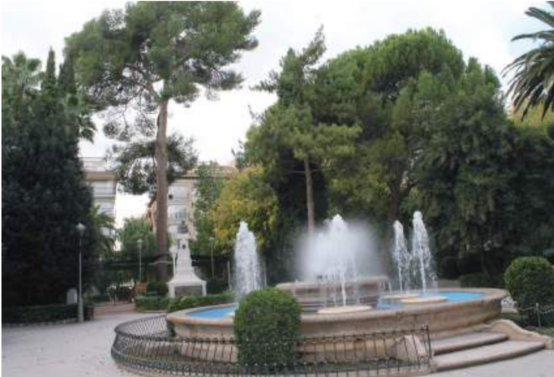
Fig. 10.- Jumilla. Jardín y Plaza del Rey Don Pedro . Fuente monumental con surtidores de agua.