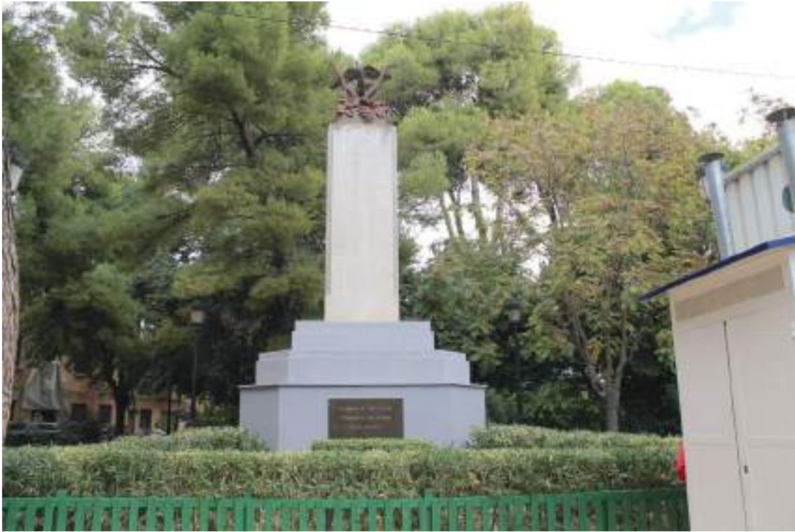
Fig. 17.- Jumilla. Jardín del Rollo (o del Caracol) . “Monumento a la Paz” (1986), elaborado en fibrocemento por el escultor Mariano Spiteri Sánchez, erigido sobre un alto basamento de piedra.

El Jardín de Acericas fue remodelado a finales del 2014 con un presupuesto de 20.000 €, que ha incluido la renovación de diversos elementos del mobiliario, la reposición de bancos de madera y papeleras, el acondicionamiento de la zona de juegos y la instalación de una nueva iluminación antivandálica.