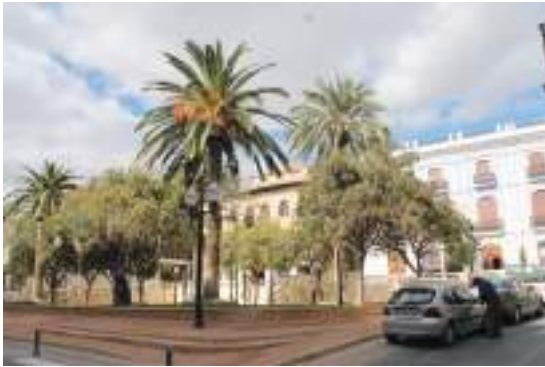
Fig. 15.- Jumilla. Jardín de las Ranas tras su remodelación a fines de 2014, con cipreses, palmeras canarias y aligustres en los parterres, que acoge el “Monumento al Nazareno” (2009), bronce de tamaño del natural del escultor José Antonio Hernández Navarro. (Foto Javier Delicado, 2015).