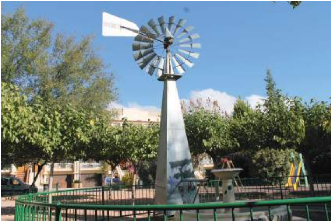
Fig. 19.- Jumilla. Jardín del Molino de Vapor . Fuente central y detalle del artefacto, compuesto de una torreta apiramidada de laminado de zinc de cuatro metros de altura, que remata una veleta de orientación y el rotor multipalas o aerogenerador, ya centenario.

que se organiza con paseos de tierra apisonada, una fuente de pared realizada de ladrillo para beber, farolas de tres brazos y dispone de bancos de madera. Un sencillo murete de piedra acota este ámbito.