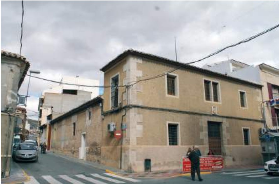
Fig. 3.- Jumilla. El Pósito o antiguo almacén de cereales. (Siglo XVIII, último tercio). Edificio de dos plantas con zócalo y llaves de sillería en la esquina, ha sido consolidado estructuralmente, modificada la cubierta y rehabilitado para museo de una cofradía hace unas décadas.

advertirse las directrices del ingeniero Bartolomé Ribelles (1713-1795), contribuyendo al trazado de calles en retícula.