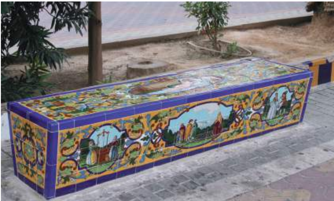
Fig. 13.- Jumilla. Paseo del poeta Lorenzo Guardiola . Banco revestido de azulejos con escenas goyescas de la manufactura "Artesanía Cerámica Campos, S.L.", de Camas (Sevilla), que reemplaza a otro anterior deteriorado.