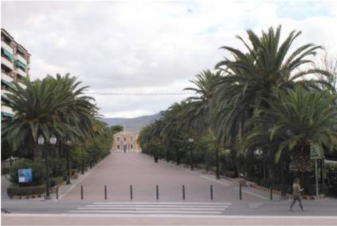
Fig. 12.- Jumilla. Paseo del poeta Lorenzo Guardiola (antiguo Paseo de la Estación). Panorámica de la calzada central y de las alineaciones de arbolado con bancos decorados con azulejos sevillanos. Al fondo el pabellón de la vieja estación de ferrocarriles de la VAY, de dos plantas, diseñado en 1904 por el ingeniero de caminos Baldomero Aracil y Carbonell.