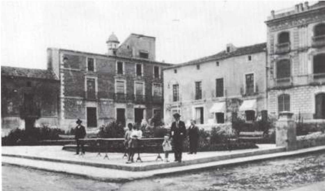
Fig. 14.- Jumilla. Jardín de las Ranas en la Plaza de la Constitución . Plantaciones de los años veinte del siglo pasado. Al fondo Casona solariega de los Molina (s. XVIII), torreada, y a la derecha Casa del barón del Solar (1870), de sesgo cuatrocentista, del arquitecto José Ramón Berenguer. (Foto antigua del año 1932).

de éstas, además de reunir mesones, paradores y hornos de pan cocer, como ya se ha indicado ut supra . Fue convertido en zona verde en 1905 colocando en el centro una fuente, se urbanizó y parceló con algunas plantaciones en 1926 y se realizaron inversiones para su mantenimiento en 1956, coincidiendo con el acto de la Coronación del “Cristo a la columna”, de Francisco Salzillo, al cumplirse el II Centenario de su llegada a Jumilla.