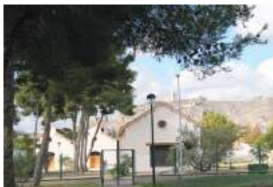
Fig. 21.- Jumilla. Jardín de la Vereda Real , con las naves industriales de El Arsenal, hito de la arqueología industrial local, rehabilitadas para Museo y Centro de Interpretación del Vino. Al fondo, en la lejanía, el castillo sobre el cerro.

una superficie de 19.547 metros cuadrados con lomas verdes, senderos de tierra y de piedra caliza, puentes y un lago con lámina de agua al pie de una cascada rocosa, protagonizando una singular topografía recreada 66 .