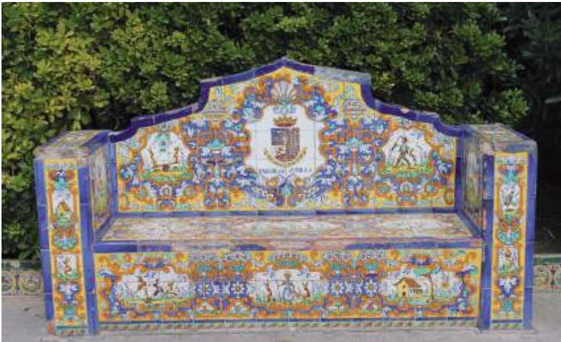
Fig. 11.- Jumilla. Jardín y Plaza del Rey Don Pedro . Banco con respaldo revestido con azulejos cerámicos del alfar trianero “Hijos de Ramos Rejano”, de Sevilla (1940). (Foto Javier Delicado, 2015).