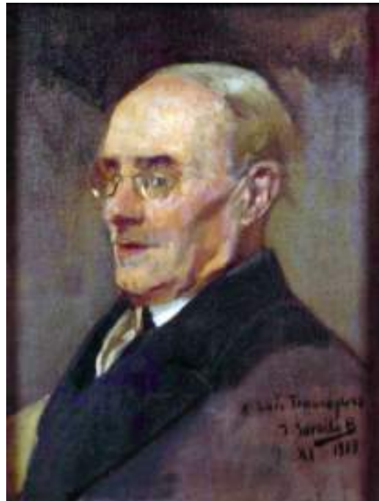
Fig. 3.- Joaquín Sorolla y Bastida. Retrato de Luis Tramoyeres , 1919. Óleo sobre lienzo, 52 x 40 cm. Museo de Bellas Artes San Pío V (Valencia).

La tarea de conservación y difusión de la cultura valenciana a partir de su colaboración con Lo Rat-Penat fue corta, es por ello que para hablar de la misma no podemos referirnos únicamente a la labor que desarrolló en dicha