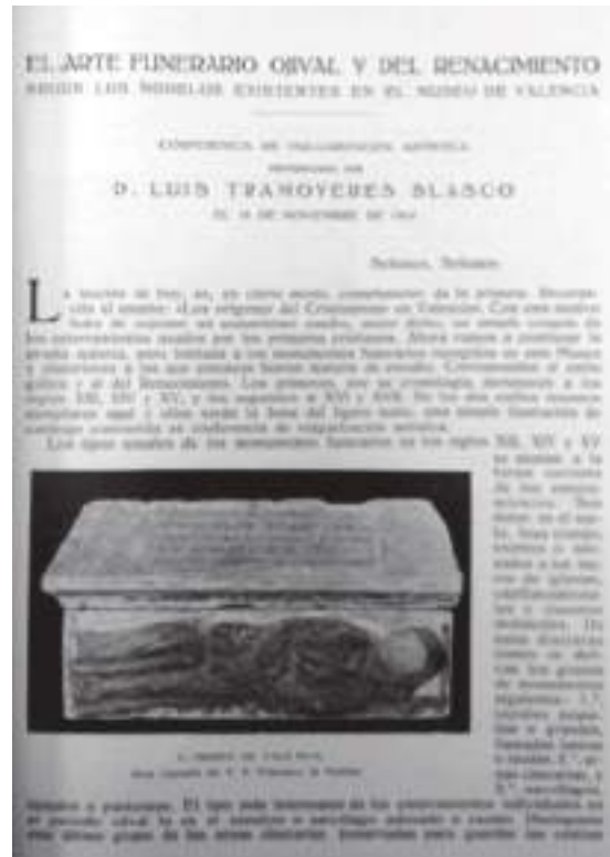
Fig. 2.- Luis Tramoyeres Blasco. “El arte funerario ojival y del renacimiento según los modelos existentes en el Museo de Valencia (conferencia).” Archivo de Arte Valenciano , 1915, vol. 1, nº 1, p. 15. Archivo de la Real Academia de Bellas Artes de San Carlos.

Esta revista cuya apariencia es de verdadero buen gusto, presenta un texto escogido, en donde como no podía menos de ser, campean un gran interés artístico y una