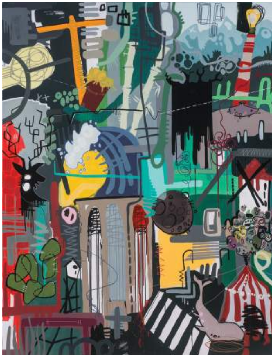
A ningún lugar cualquiera Mixta sobre tela 195 x 150 cm. 2015