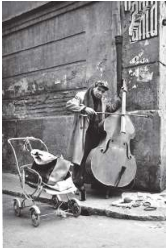
Mudo y jaula (Rastro de Valencia) 1968-1970