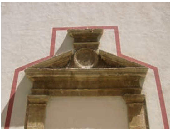
Fig. 4.- Detalle de la portada primitiva