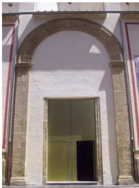
Fig. 5.- Portada del siglo XVIII

paredes colgaban Veinte, y un Lienzos de diferentes Ymagenes, Echuras, y guarniciones , a la vez que nos informa de la presencia de Nueve Confesionarios Cerrados, de Madera de Pino de una misma Echura, Diez, y seis bancos del mismo material , así como de Un Canzel de la mesma Madera en la puerta de la iglesia. Por último, el inventario nos permite datar también la pequeña espadaña existente en la actualidad que debió ser ejecutada al concluir la iglesia y, en todo caso, antes de la expulsión de 1767, haciendo referencia a la Campana principal de la Yglesia del Colegio colocada en su Arco, enzima de la mesma . El recubrimiento original del templo