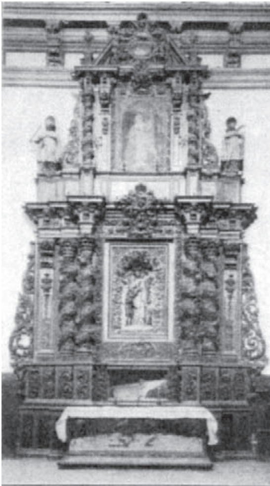
Fig. 6.- Altar de San Francisco de Borja. Tomada de BRAUN, J. S.I., op. cit. , lám. nº 5.

situados junto al paso abierto desde el claustro privado a la huerta.