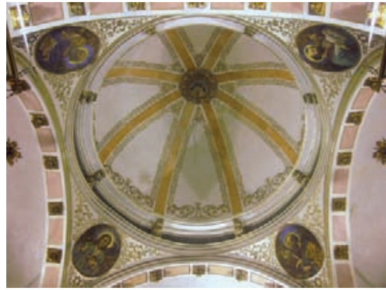
Fig. 2.- Cúpula del crucero

continuación las obras de la nueva iglesia, dirigidas por un desconocido maestro de obras siguiendo una traza procedente de Roma como había sucedido también en la iglesia de la casa profesa de Valencia 6 .