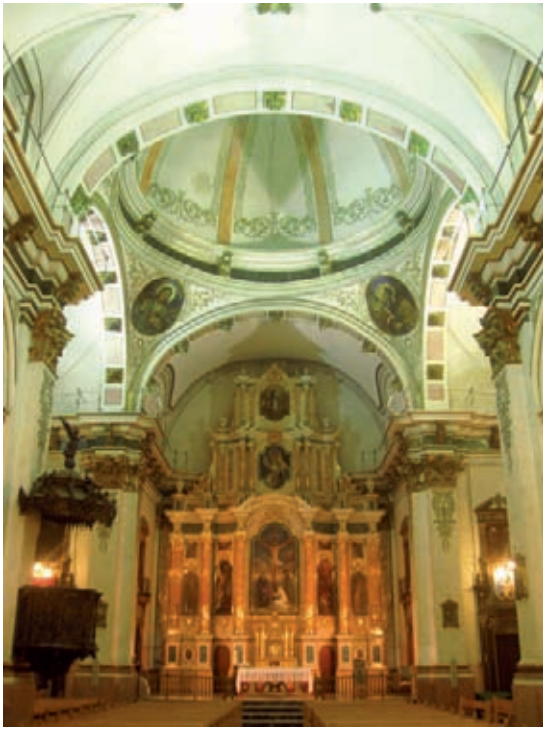
Fig. 1.- Cabecera y altar mayor.