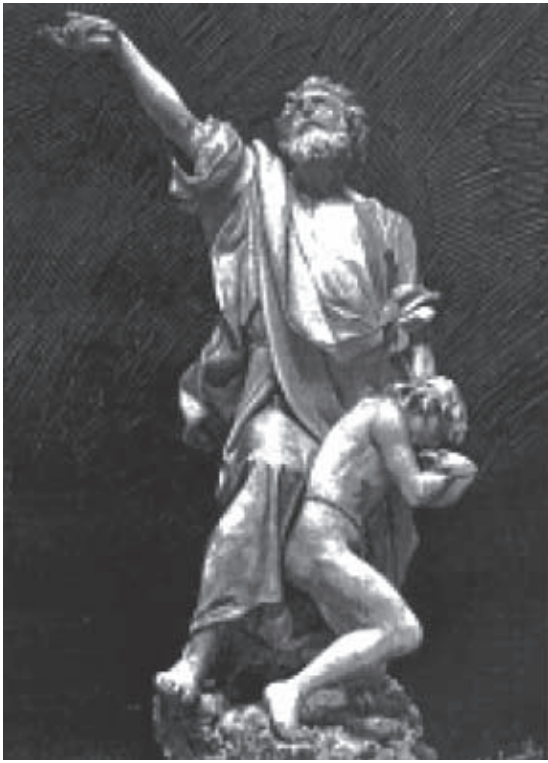
Fig. 1.- ALSINA, A.: Sacrificio de Isaac , 1887

conjunto contrastado por la figura joven, tierna y obediente de Isaac, y la robusta y enérgica del anciano Abraham, que pleno de fe y con tristeza y gran dolor se dispone a descargar el golpe mortal sobre su único hijo. El niño arrodillado junto a los pies de su padre, y tomando con ambas manos la de este, para besarle cariñoso, dobla resignada la cerviz, para recibir el golpe mortal. El anciano padre alza sus ojos al cielo y blandiendo con la mano derecha el cuchillo de su martirio. Si la composición es buena, la