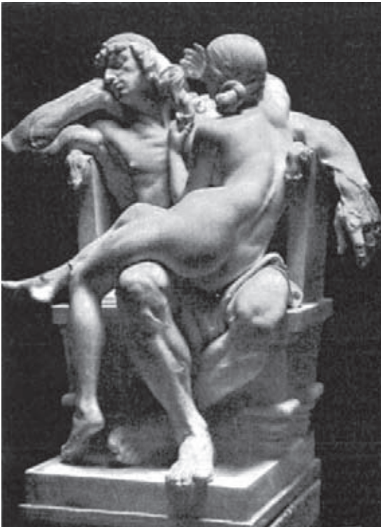
Fig. 6.- ALSINA, A.: Astucia y Fuerza , Medalla de Oro en la Exposición Internacional de París de 1900.