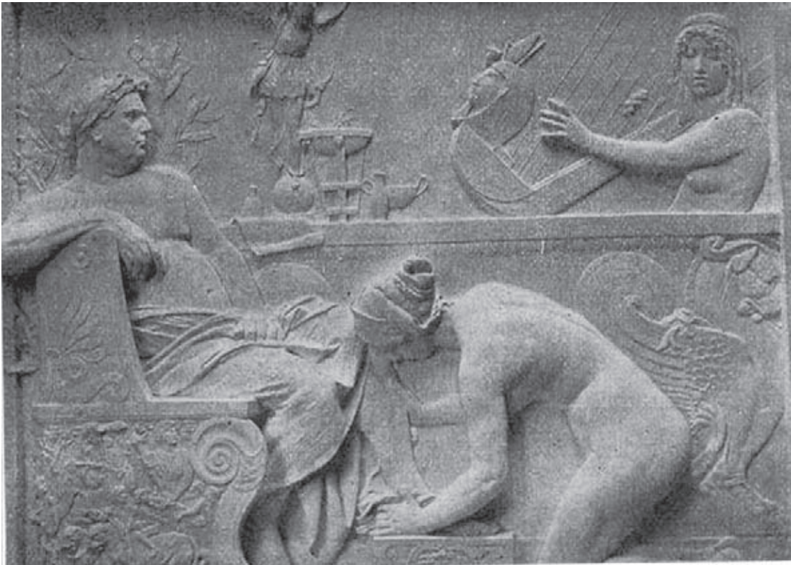
Fig. 5.- ALSINA, A.: Imperio Romano , bajo relieve en yeso, 1898.