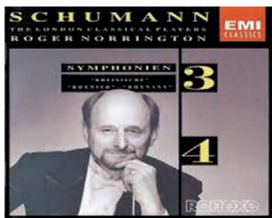
Fig. 2.- Edición de EMI de la Tercera Sinfonía de R. Schumann

Tal vez el aspecto poético de la obra de Schumann, muy especialmente en la Tercera Sinfonía a la que hemos aludido, se encuentre en la vertiente romántica que tan bien lo define. Un romanticismo, muchas veces exasperado, que inunda no sólo su ser, enfermizo y frágil, sino también su inteligencia desbocada. Una poeticidad vinculada, generalmente, con su frecuente incursión en el mundo de la poesía, y que se enhebra con frecuencia en el ámbito poético 10 .