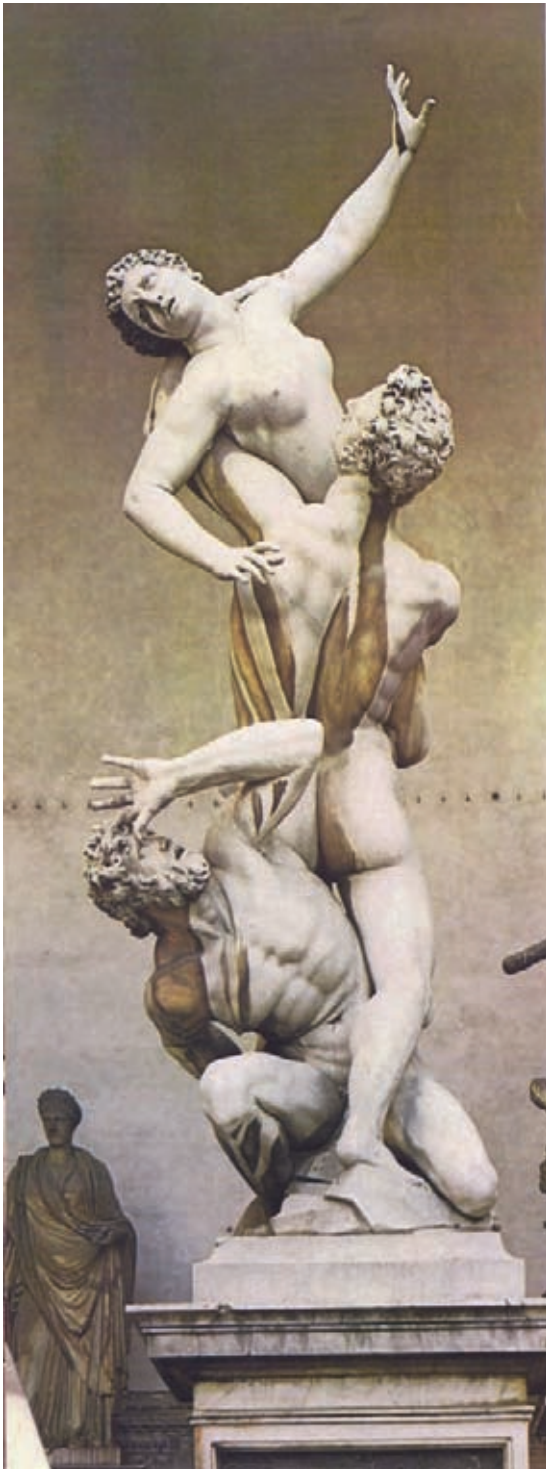
Fig. 4.- Giambologna. Ratto de la Sabina . Loggia dei Lanzi, Florencia.