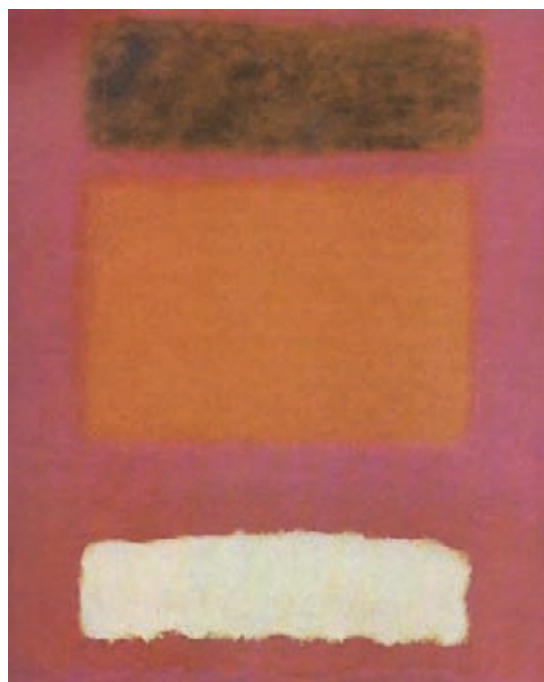
Fig. 3.- Mark Rothko. Rojo, blanco y marrón , 1977