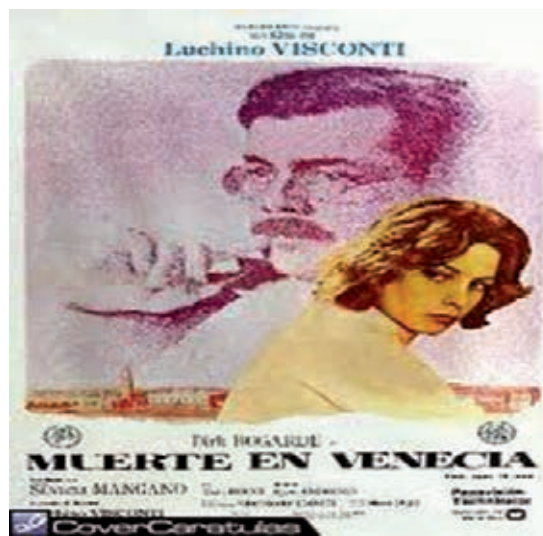
Fig. 1.- Muerte en Venecia. Luchino Visconti, 1971.

de mirarse los personajes a través del objetivo de la cámara, y la naturaleza de su devolución a través de la pantalla hacia los receptores, repercute de forma directa en la poeticidad del encuentro 6 . Tal vez lo bello sea la consideración primera de lo poético. Alcanzar un alto grado de consideración en el uso terminológico.