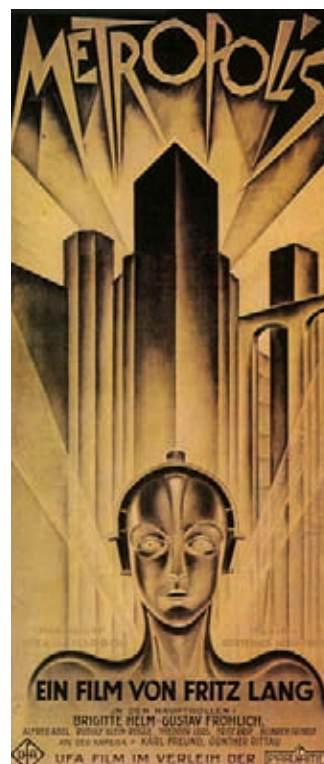
Figura 1. Cartel de la película Metrópolis , dirigida por Fritz Lang en 1927. Diseño del ilustrador alemán Heinz Schulz-Neudamm.

Las convenciones académicas tradicionales de la educación artística han fundamentado su acción en un modelo que redundaba en las denominadas «bellas artes». Desde hace tiempo este modelo ya no es exclusivo, de modo que