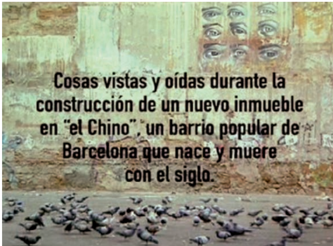
Figura 8. Frase con la que se inicia la película documental En construcción .

El inicio del film es un fondo negro en el que van apareciendo con letras blancas los nombres de las entidades que han colaborado en la producción. Tras esta concesión lógica vemos un montaje documental con imágenes en blanco y negro en el cual se repasa, en pocos minutos, todo un siglo de tradición: el ambiente del Raval barcelonés en los inicios del siglo XX; la zona de prostitución en imágenes de los años 1950 y 1960, y un recorrido de un cámara persiguiendo a un marine norteamericano que deambula zigzagueando por la zona final de las Ramblas y finalmente desaparece en una calle del Raval. Esta deliciosa introducción da paso a una imagen fija de una pared (todo el film es una sucesión de planos fijos de gran empaque visual) sobre la cual aparecerá el título de la película, el nombre del director, y posteriormente un texto introductorio, tal y como lo vemos en la figura 8 .