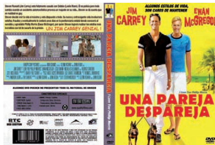
Figura 6. Carátula de la edición mejicana del film en DVD.