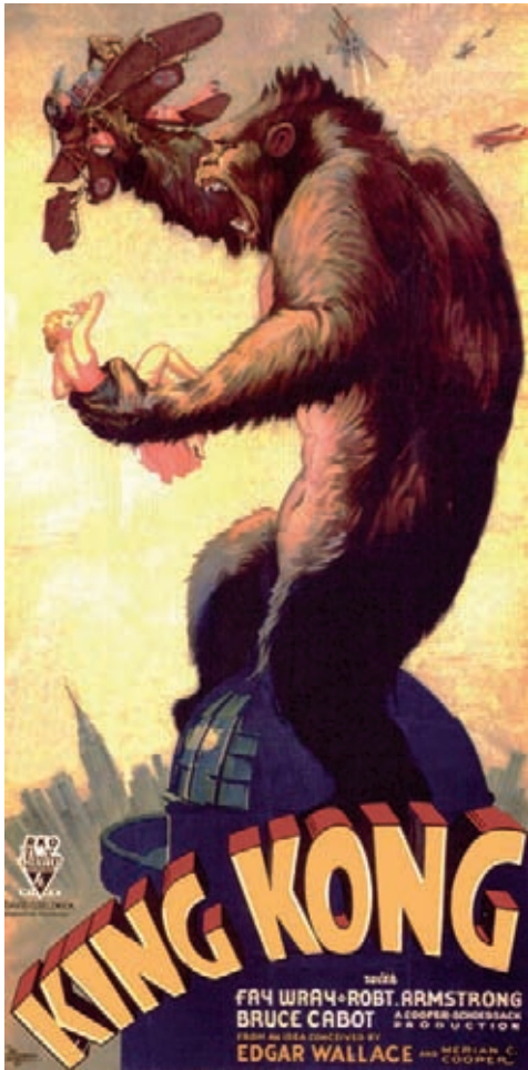
Figura 2. Cartel diseñado por S. Barret McCormick y Bob Sisk para el film de Merian C. Cooper y Ernest B. Shoedsack del año 1933.

los artefactos visuales como pueden ser la fotografía, el cine, el vídeo, la televisión o los videojuegos han empezado a introducirse en las experiencias educativas, lo cual es una muestra palpable de lo que debería ser un nuevo concepto de la educación artística. Aun así, una manifestación de primer orden como el cine no encuentra el territorio adecuado para afianzar un modelo en el cual pudiesen converger todas las dinámicas emergentes.