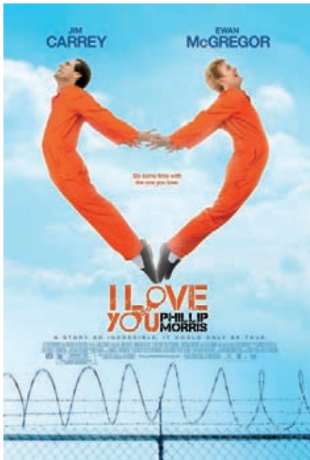
Figura 3. Cartel e imagen que actualmente se difunde de la película I Love You Phillip Morris .