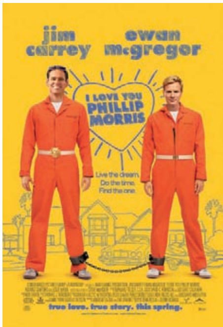
Figura 4. Cartel de la película que responde a los cánones estéticos iniciales marcados por los creativos gráficos.

internacional y también tuvo una razonable aceptación por parte de la crítica. Lo que nos llama la atención es la disparidad de factores visuales que la ha acompañado en su periplo por los diversos países en los que se ha difundido, así como los constantes cambios de imagen, incluso en su trayectoria anglosajona.