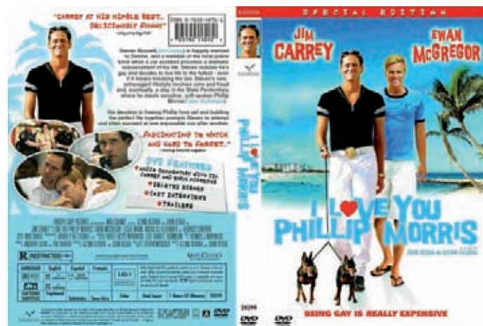
Figura 5. Carátula de la edición especial del film en DVD.

Nos llama la atención que las letras originales del título, que acompañaron a la promoción de la película, supuestamente diseñadas por Richie Adams y producidas por Scott Poché, en realidad desaparecen cuando vemos la carátula de la edición en DVD. Suponemos que a lo largo del recorrido comercial de la película hubo cambios de estrategia comunicativa, y es por ello que en la portada de la carátula ya vemos ubicada adecuadamente una nueva tipografía explícita, con la cual se han escrito tanto los nombres de los actores principales como el título del film. Es el mismo fondo que aparece como escenario digital en los extras del DVD, que contiene las entrevistas a los directores y los actores. Así pues, los grafismos originales han sido desplazados por un modelo tipográfico más legible aunque menos original que el oriundo.