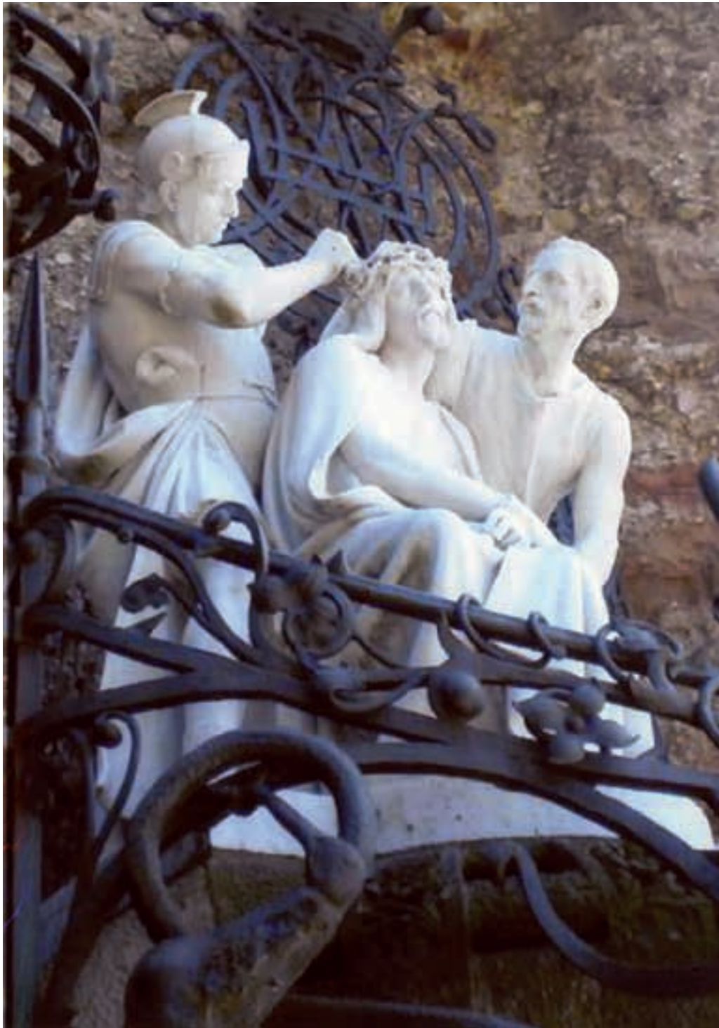
Fig. 4.- NOGUÉS GARCÍA, Anselmo: Grupo de la Coronación de Espinas, Tercer misterio de Dolor , conjunto general, Monasterio-Abadía de Montserrat, Barcelona