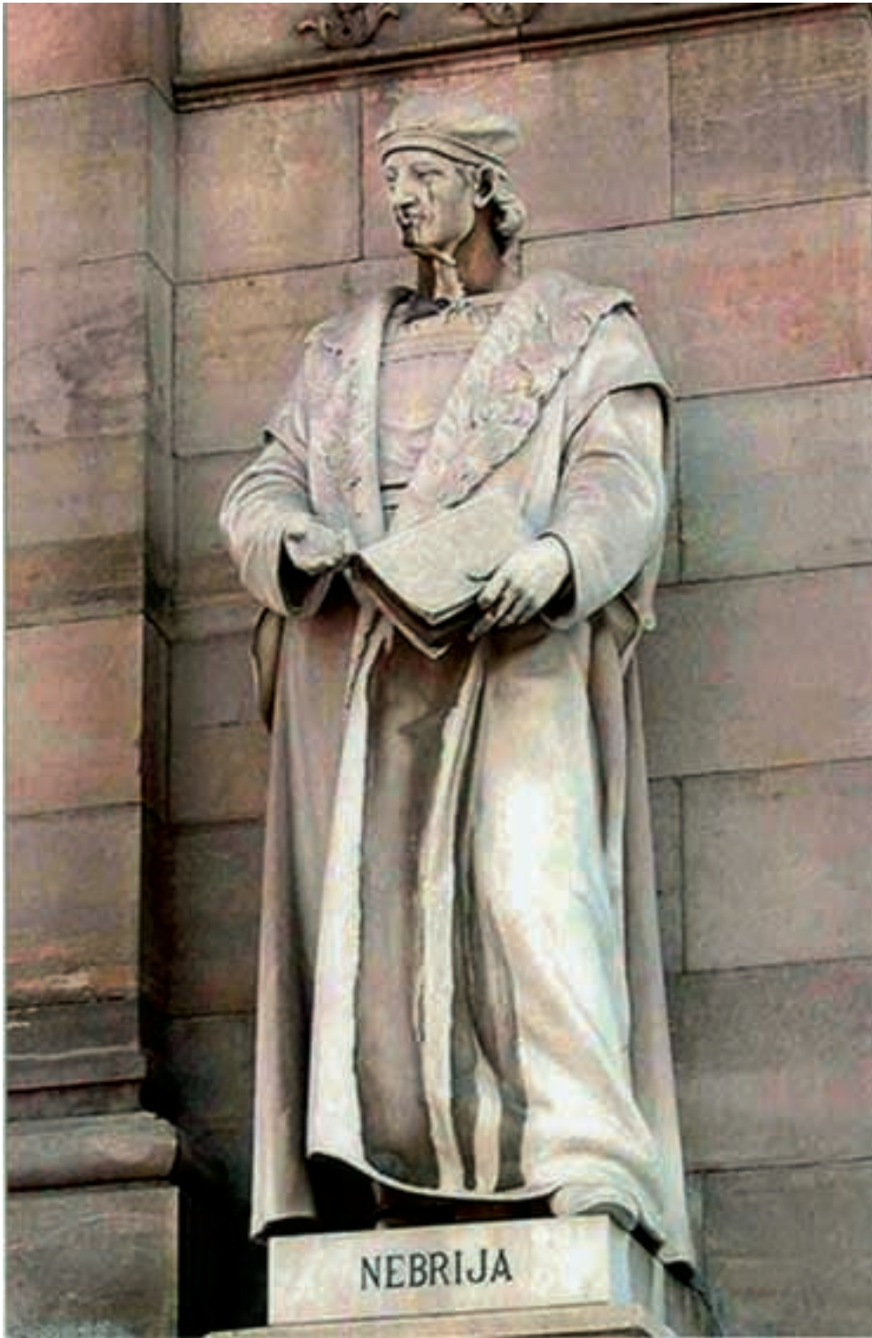
Fig. 1.- NOGUÉS GARCÍA, Anselmo: Estatua del gramático Antonio de Nebrija conjunto general, pórtico de la fachada principal de la Biblioteca Nacional de Madrid.