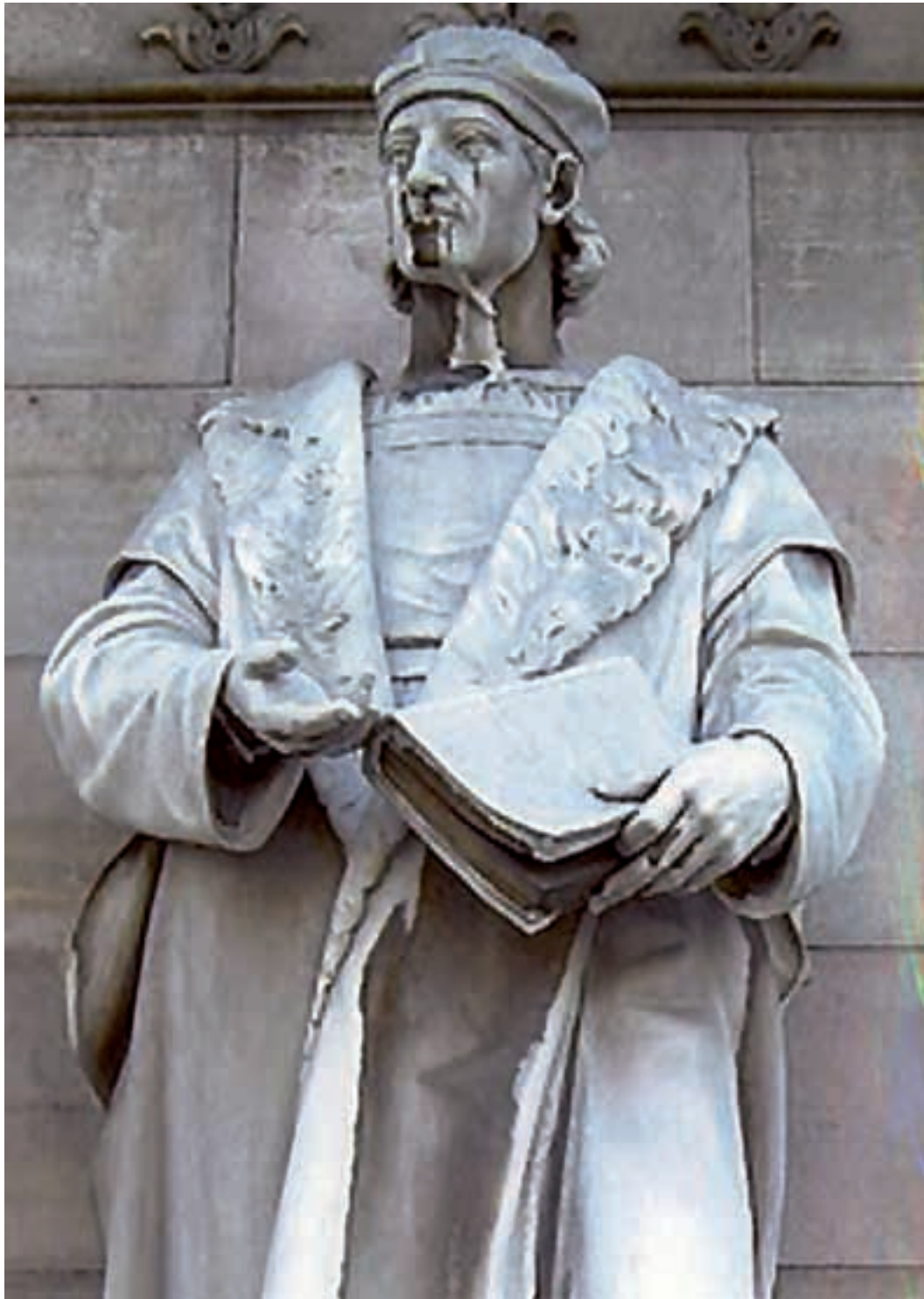
Fig. 2.- NOGUÉS GARCÍA, Anselmo: Nebrija . (Detalle). Pórtico de la fachada principal de la Biblioteca Nacional de Madrid.