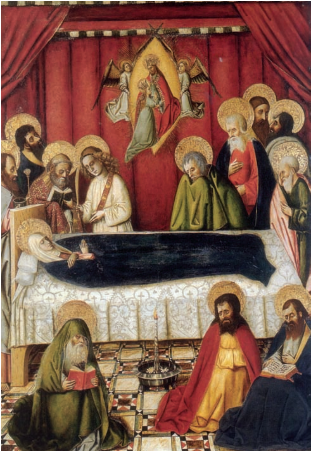
Fig. 4 Joan Reixach, Tránsito de la Virgen. Posible tabla de un retablo dedicado a los Siete Gozos de la Virgen. Col. particular