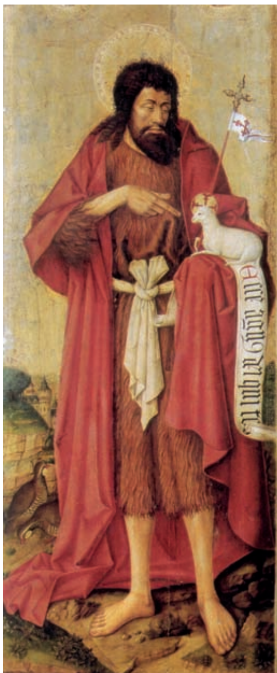
Fig.2 Joan Reixach, San Juan Bautista, retablo de Vall de Crist, Museo catedralicio de Segorbe

Reixach con el tema de San Juan Bautista y la misma descripción realizada por el cronista Sala podría servir para la gran tabla de San Juan Bautista que flanqueaba la tabla central del retablo de Vall de Crist, hoy en el Museo Catedralicio de Segorbe (Fig.2).