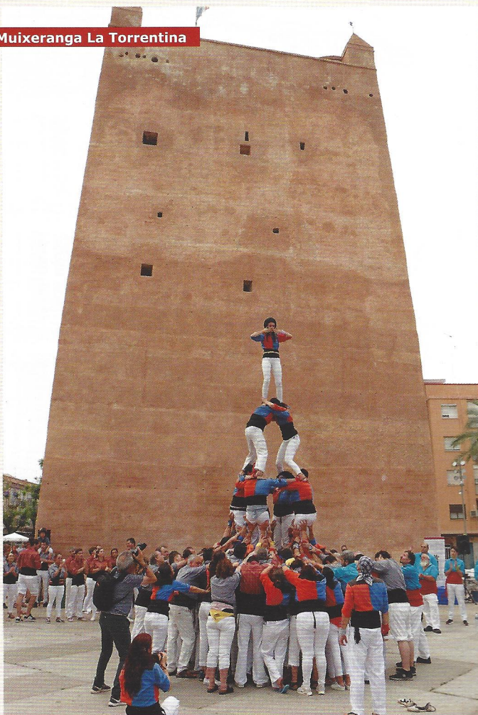
Jove Muixeranga de València