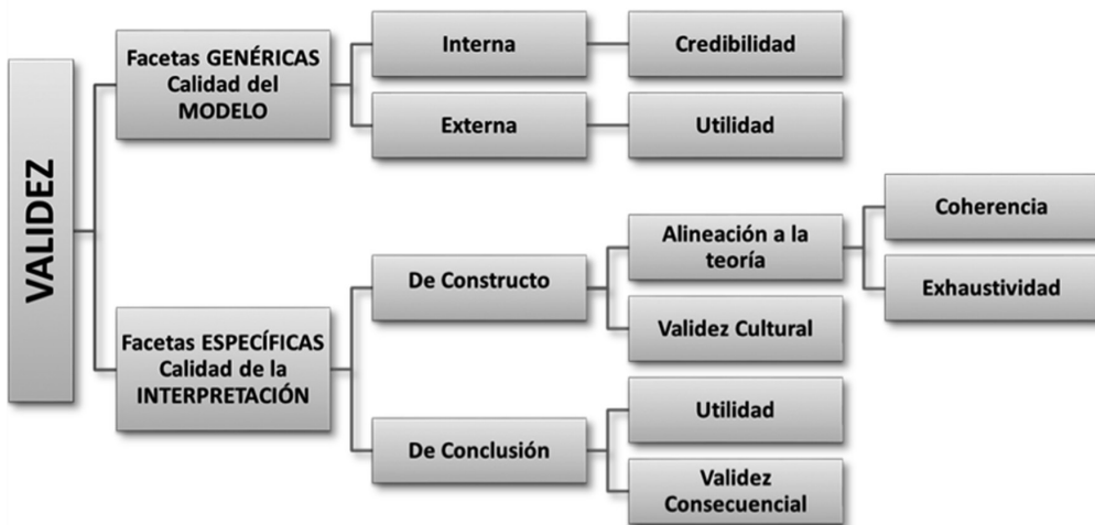
GRÁFICO 1. Clasificación de las facetas del concepto de validez en la evaluación.

Utilizamos el término facetas en relación con las diferentes acepciones y/o enfoques que pueden identificarse en el concepto de validez y las llamamos metodológicas porque se derivan de los componentes metodológicos clásicos de calidad de la investigación y la medición educativas. Entre ellas, se pueden diferenciar los tópicos (Rutman, 1984) que provienen de la investigación (facetas genéricas) y los que tienen su origen en la medición (facetas específicas) —ver Gráfico 1—.