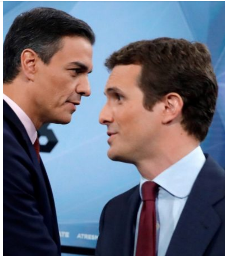
Pedro Sánchez i Pablo Casado es creuen durant el debat del 23 d'abril.