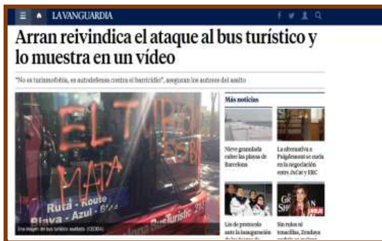
Figura 1. La Vanguardia (edición digital) (30-07-2017) ii

Al mismo tiempo, hubo dos acontecimientos noticiosos que se solaparon con las noticias sobre el turismo y, que tendrían un efecto en su noticiabilidad. El 17 de agosto de 2017 se produjo un atentado terrorista en Barcelona que se hizo con la práctica totalidad de las portadas. A diferencia del ataque al bus turístico, este fue protagonizado por terroristas islámicos y hubo víctimas. Por último, durante estas fechas el procés independentista catalán también restaría protagonismo a las noticias sobre el turismo.