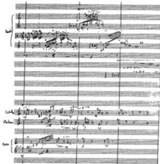
Figure 1. Extrait du manuscrit de Tristan Murail relatif à Désintégrations 85

époque celle qu'appellent les progrès, les audaces et les victoires modernes ? » 83 . Poétisée par certains (Dufourt, Levinas, Tessier) et cautionnée technoscientifiquement par d'autres (Grisey et Murail, les deux véritables spectraux de l'équipe de L'Itinéraire), cette disposition de type additif, typique des pratiques de la fin des années 1980 et du début des années 1990, avait alors pour but d'organiser et d'apprêter le matériau timbrique en tant que « porteur de forme » 84 et en tant que générateur de sonorités inédites.