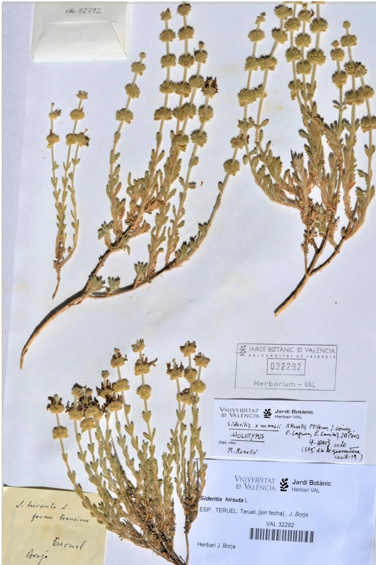
Figura 1. Holotipo de Sideritis ×currasii , VAL 32292.