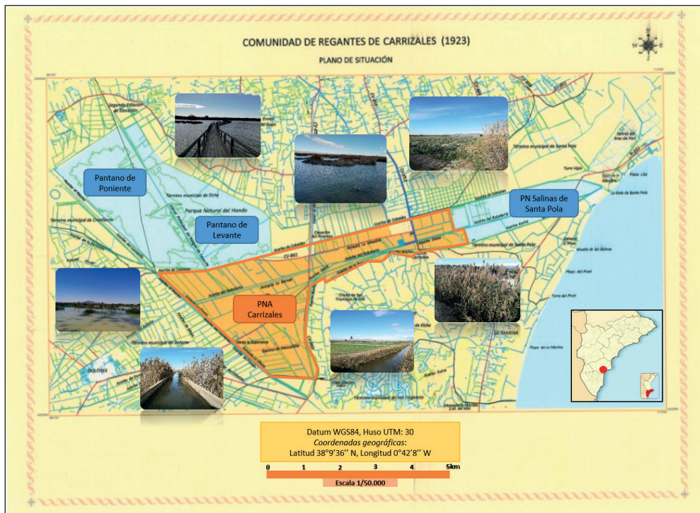
Figura 1. Situación y ámbito colindante del Parque Natural Agrario Los Carrizales Fuente: Comunidad de Regantes de Carrizales. Adaptado de Segrelles (2013).