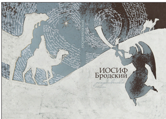
Fig. 1. Guardas para una posible edición rusa de Christmas Verses ilustradas por Sasha Dolzhnitskaya, San Petesburgo.