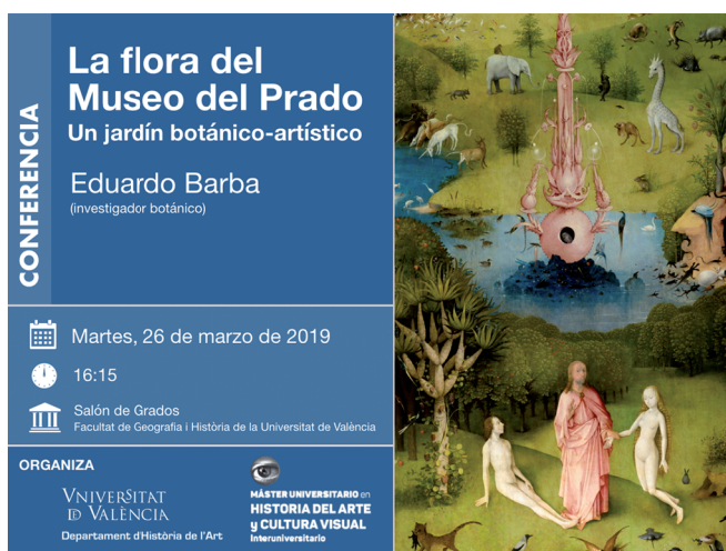
Fig. 9. Cartel de la conferencia de Eduardo Barba sobre “La flora del Museo del Prado”.