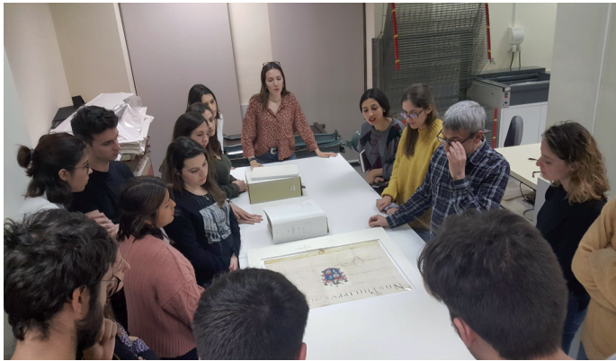
Fig. 5. Taller de fuentes documentales en el Archivo del Reino de Valencia.