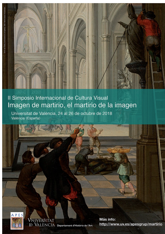
Fig. 14. Cartel del Simposio Internacional Imagen de martirio, el martirio de la imagen .