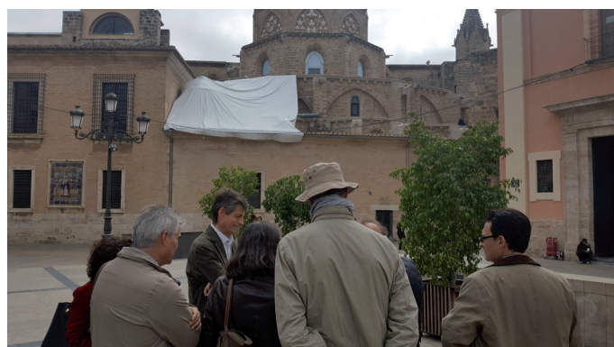
Fig. 7. Visita a la zona afectada de la catedral de Valencia por parte del grupo de especialistas del Departament d'Història de l'Art junto al arquitecto del Cabildo.

cuando se recibe una solicitud formal por parte de algún colectivo, particular y fundamentalmente, de la propia Universitat de València, como órgano consultivo legalmente establecido por la Administración, se activa el trabajo de un grupo de personas especialistas en dicho ámbito. Algo similar ocurre cuando se observan actuaciones que no se consideran acordes con la normativa de protección de bienes, como sucedió en el caso del edificio del antiguo cine Metropol en 2017 y 2018. Desde el Departament d'Història de l'Art de la Universitat de València se realiza un trabajo paralelo no remunerado, con el consenso de sus órganos de gobierno, para emitir dichos informes y remitirlos a las instituciones implicadas. En marzo de 2019, por ejemplo, se recibió desde la Direcció General de Cultura i Patrimoni de la Generalitat Valenciana la solicitud de un dictamen acerca del proyecto de intervención en la fachada de los absidiolos y cubierta de la cúpula del relicario de la catedral de Valencia, declarada Bien de Interés Cultural con la categoría de monumento histórico-artístico desde 1931. El informe detallado fue aprobado por el Consejo departamental y remitido a la Generalitat Valenciana para cumplir su función.