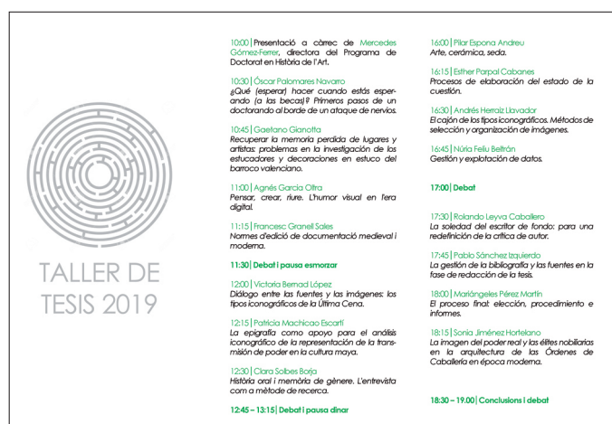
Fig. 11. Programa del IV Taller de tesis: Experiencias para doctorandos/as en Historia del arte .

El Departament d'Història de l'Art participa también en títulos propios de postgrado, dependientes de la Fundación Universidad-Empresa ADEIT. Es el caso de la tercera edición del Diploma de especialización en Fotografía: producción y creación y de la cuarta edición del Máster propio en Fotografía: producción y creación , de 45 y 60 créditos respectivamente, organizados por el Departament d'Història de l'Art y Espai d'Art Fotogràfic,