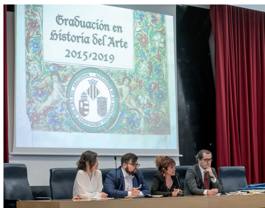
Fig. 22. Momento del acto de graduación en Historia del Arte de la Universitat de València, promoción 2015-2019.

mo, el Departamento contribuye con la entrega de un diploma personal conmemorativo y el padrino y madrinas les imponen una beca azul celeste, como corresponde tradicionalmente a los estudios de la rama de Humanidades.