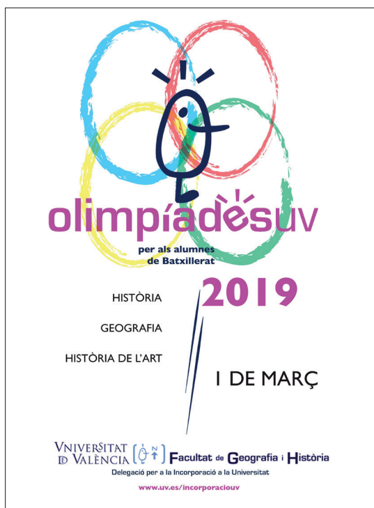
Fig. 1. Cartel de las Olimpiadas de Historia del arte para alumnado de Bachillerato.