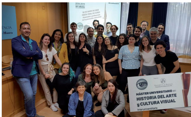
Fig. 10. Foto colectiva en el acto de clausura del Máster en Historia del Arte y Cultura Visual, curso 2018-2019.