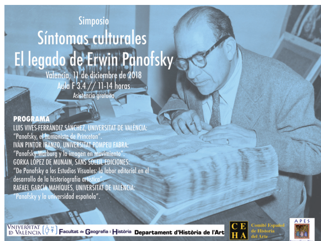
Fig. 15. Cartel del simposio Síntomas culturales. El legado de Erwin Panofsky .