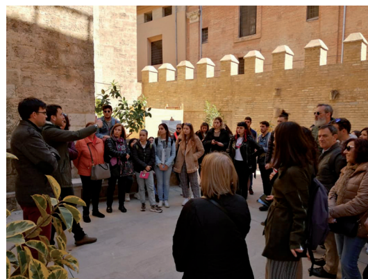
Fig. 2. Visita a San Juan del Hospital, València.

En un título como el de Historia del Arte el acercamiento al objeto artístico no puede ni debe hacerse solamente a través del trabajo en el aula. Es habitual que el profesorado organice salidas de estudiantes de distintas asignaturas a espacios urbanos, monumentos, museos, archivos y otras instituciones de la ciudad de Valencia y de diversas localidades. En 2018-2019 se visitaron, entre otros, el Museo Nacional de Cerámica y Artes Suntuarias "González Martí", el Museo de Bellas Artes de Valencia, el convento de Santo Domingo, el Monasterio de la Trinidad de Valencia, el Real Colegio Seminario del Corpus Christi, el edificio histórico de la Universitat de València, el Monasterio de San Miguel de los Reyes, el templo de San Nicolás, la iglesia de San Juan del Hospital, la Lonja, la catedral o el barrio de la Valencia gótica.