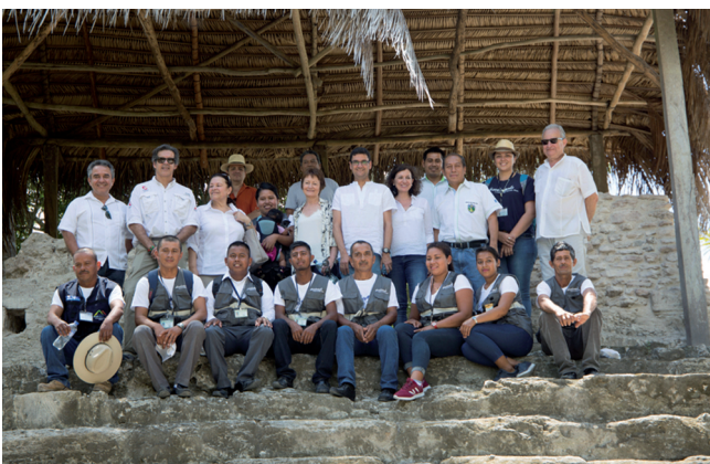
Fig. 21. Foto de grupo, con la presencia de la rectora de la Universitat de València, durante el recorrido por las ruinas arqueológicas en el acto del día 27 de mayo de 2019.