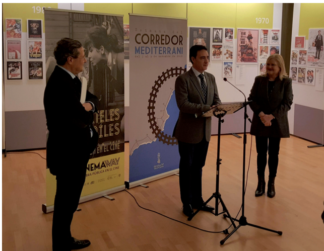
Fig. 19. Presentación de la exposición Carteles y raíles y del proyecto Cinemaway en el Ateneo Mercantil de Valencia que dio origen a múltiples actividades.