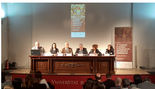
Fig. 17. Acto de inauguración del congreso ESRARC 2019 en La Nau.

partió la conferencia “Nuevas aportaciones del estudio de las pinturas románicas y el artesanado mudéjar de La Sala Capitular del Real Monasterio de Santa María de Sijena”, celebrada en el salón de actos de San Juan del Hospital.