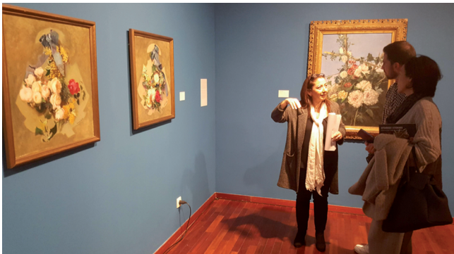
Fig. 13. Exposición Efímeras y eternas. Pintura de flores en Valencia (1870-1930) en la Casa-Museo Benlliure de Valencia.