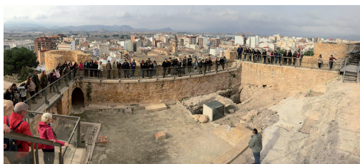
Fig. 4. Visita al castillo de Villena.