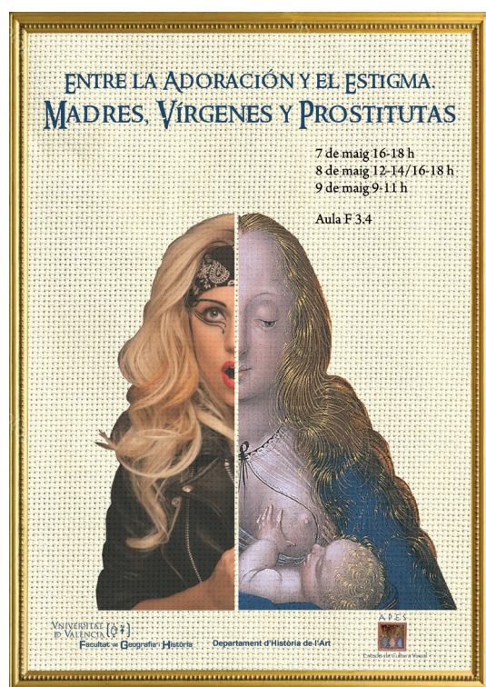
Fig. 3. Cartel del seminario Entre la adoración y el estigma .

Además, es habitual que en el desarrollo de las asignaturas se cuente con la participación de conferenciantes , especialistas en algún tema del con-