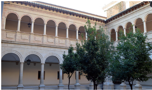
Fig. 3. Alcañiz, Teruel. Iglesia del Carmen. Claustro, actual Palacio de Justicia.