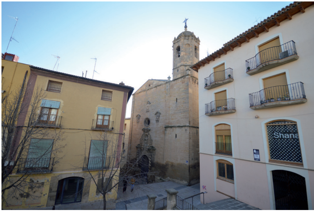
Fig. 2. Alcañiz, Teruel. Iglesia del Carmen. Exterior.