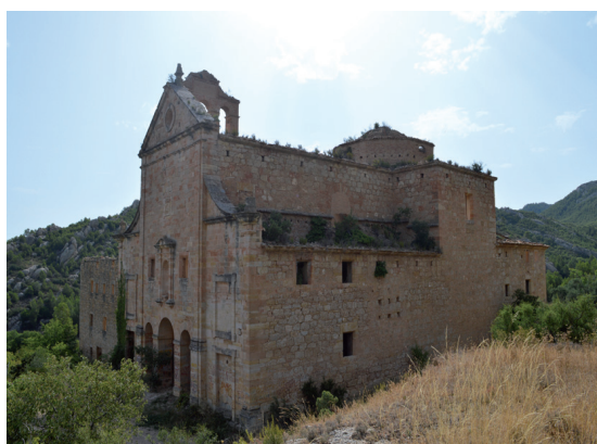
Fig. 7. Calanda, Teruel. Convento del Desierto. Exterior.