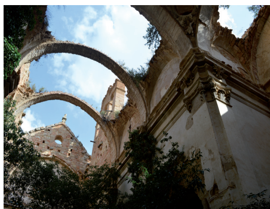
Fig. 8. Calanda, Teruel. Convento del Desierto. Interior.

ción de la nueva iglesia parroquial de la Esperanza de Calanda el 30 de marzo de 1642. 89