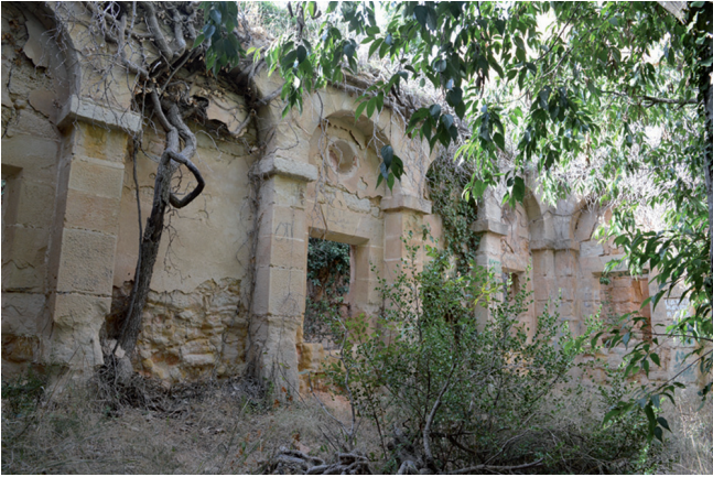
Fig. 9. Calanda, Teruel. Convento del Desierto. Claustro.

la obra del convento en 1697. Este religioso se encargó de los diseños del antiguo convento del Desierto de las Palmas en Benicasim; 99 posteriormente se trasladó al convento de Tarazona, desde donde realizó un informe sobre la torre de la actual catedral de Tudela y probablemente las trazas para la capilla de Santa Ana de ese mismo templo en 1713. 100 Poco tiempo después, se encargó –junto al hermano Juan de la Virgen– de realizar los diseños de la iglesia de Valentuñana entre 1715 y 1717; 101 retornó a Calanda para visurar el campanario de la iglesia parroquial junto a Miguel de Aguas y Silvestre Escatron –probablemente Silvestre Colás 102 – en 1721, 103 en las mismas fechas en las que se estaba construyendo la iglesia actual; y volvió a tierras navarras en los últimos años de su carrera profesional. 104