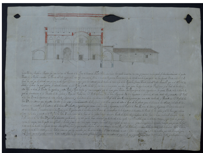
Figs. 5 y 6. Planta del convento del desierto de Calanda y sección de la iglesia. Archivo Municipal de Alcañiz, sección pergaminos.

localidad perteneciente la mitra zaragozana y el ejemplo más cercano al de Alcañiz. 68 En cualquier