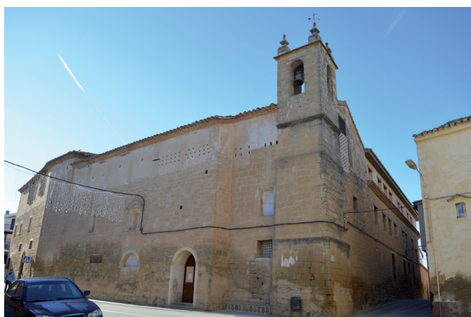
Fig. 1. Valdealgorfa, Teruel. Convento de la Purísima Concepción y San Roque. Exterior.

La llegada de los frailes carmelitas a Alcañiz se produjo en 1602, después de que fray Gaspar Cortés –representante del provincial de los carmelitas fray Francisco Sifre– consiguiera la licencia pertinente por parte de las autoridades eclesiásticas –arzobispado de Zaragoza y cabildo de la colegiata