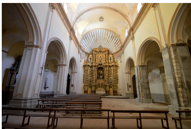
Fig. 4. Alcañiz, Teruel. Iglesia del Carmen. Interior.

Otro de los rasgos característicos del templo alcañizano es la bóveda avenerada que cierra el altar mayor [Fig. 4]. Esta estructura, tal y como han señalado algunos autores, podría ser la traslación en yeso de soluciones tipológicas similares realizadas en piedra durante el Quinientos. 64 En Aragón