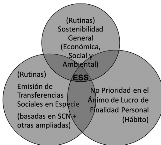
Ilustración 1. Economía Social Sostenible desde el Institucionalismo Económico