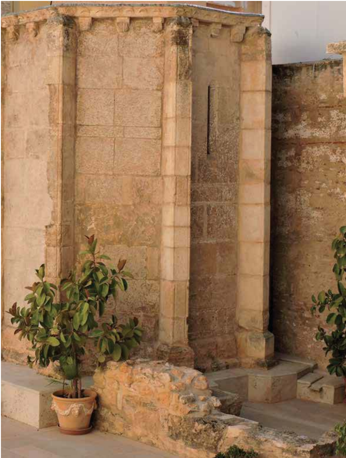
Fig. 5.- Cabecera poligonal de la Capilla de Arnau de Romaní provista de canecillos.