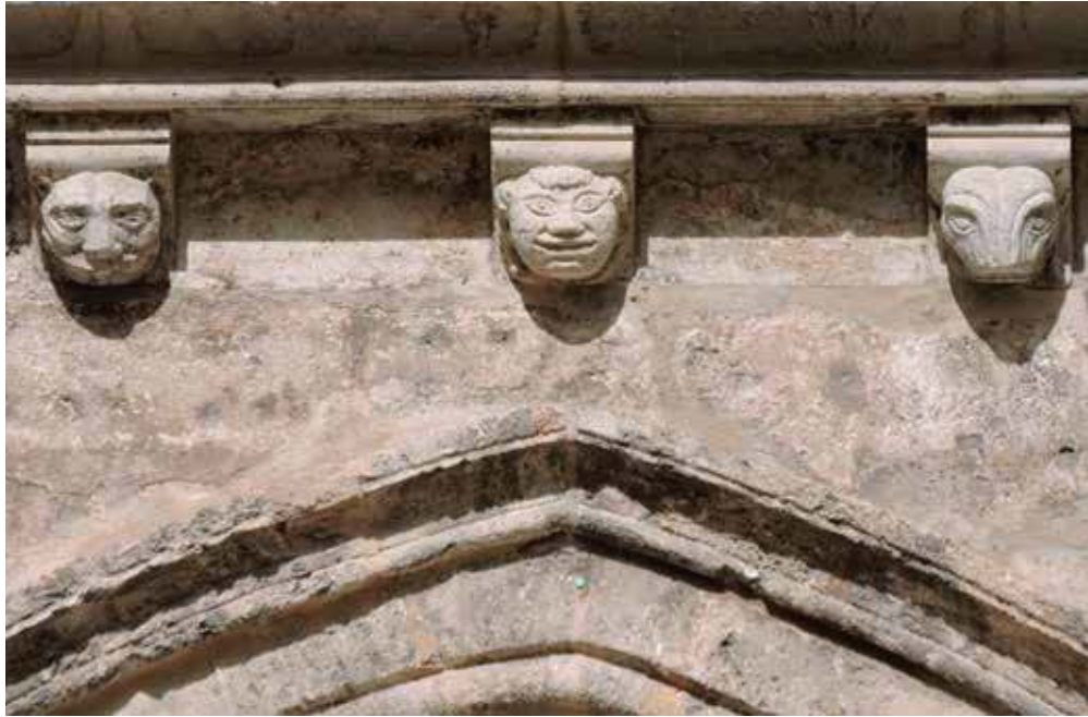
Fig. 8.- Canecillos de la Capilla de Arnau de Romaní.

ra y de rechazo se sitúan justo arriba de los vanos vigilando y protegiendo las zonas más vulnerables del edificio (Fig. 8). Al igual que la boca es un hueco abierto por el que los demonios tienen más fácil entrar y poseer el cuerpo, los vanos son el lugar por el que con más facilidad puede acceder el maligno al recinto sagrado y por ello se deben proteger y vigilar con imágenes permanentes. De este modo, estaríamos delante de un mecanismo de vigilancia y protección que actuaría las veinticuatro horas del día, los siete días de la semana, los trescientos sesentaicinco días del año.