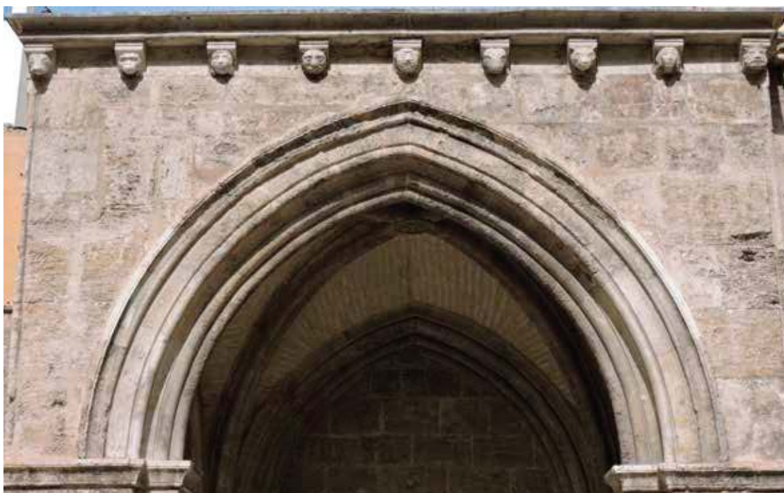
Fig. 3.- Canecillos sobre la puerta de acceso gótica con cabezas antropomórficas y zomórficas de la Capilla de Arnau de Romaní.

Lucas. En el caso del buey encontrarlo en la escena del nacimiento de Jesús. Sin embargo, pese a que son escasos, existen algunos ejemplos en los que las cabezas de buey o toro se representan en canecillos. Así ocurre en la iglesia de San Martín de Tours en Frómista (Palencia) y en la parroquia de Santa María de Tera en Zamora.