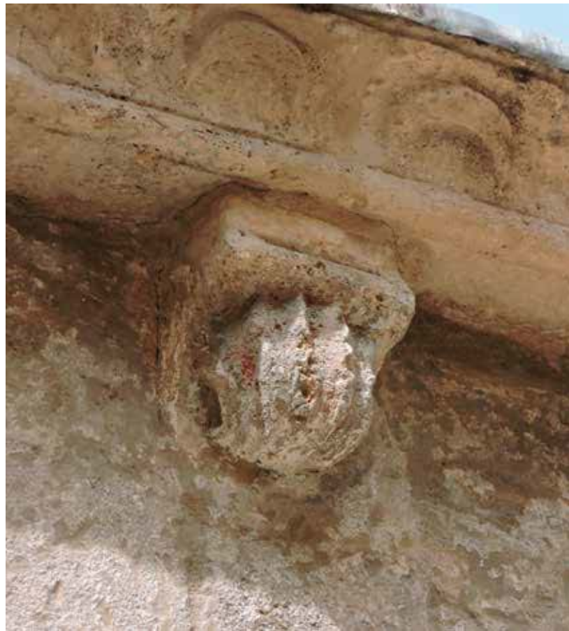
Figs. 6 y 7.- Detalle de los canecillos tallados. El primero irreconocible y el segundo en forma de concha.