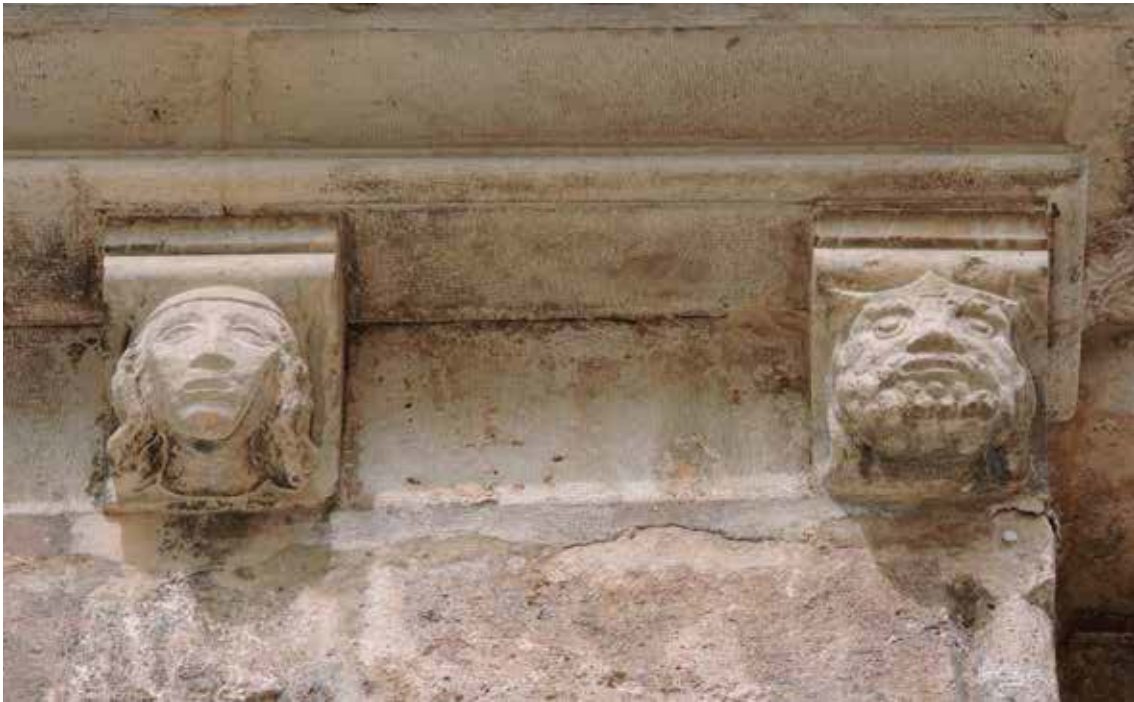
Fig. 4.- Canecillos de una cabeza de mujer y una cabeza de hombre barbado con corona representando acaso a D a Violante de Hungría y al rey Jaume I.

tras se construía la Catedral y la iglesia de la orden 17 . Esto ha provocado que en la actualidad mucha gente la denomine capilla del rey Don Jaime 18 . No es una afirmación descabellada e incluso podría ser así, pero al no haber más evidencias documentales y artísticas, no se puede afirmar al cien por cien. También es posible, aunque no deja de ser una mera hipótesis, que Arnau de Romaní, en honor a su rey y como muestra de admiración y lealtad hacia él, decidiera colocar un retrato del monarca en la capilla.