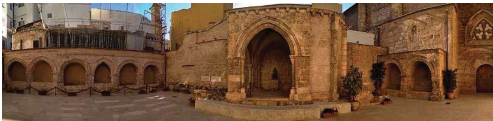
Fig. 2.- Arcosolios y Capilla de Arnau de Romaní en el cementerio de San Juan del Hospital de Valencia.