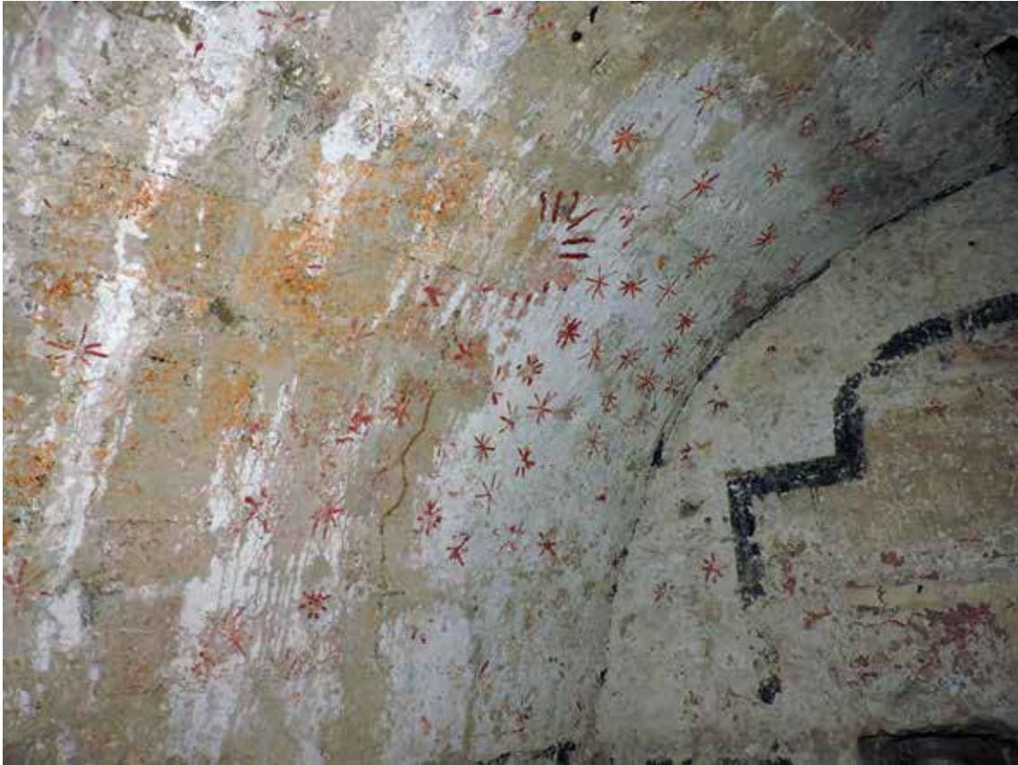
Fig. 7. Vista general del sol y las estrellas de la parte izquierda del intradós de la bóveda de la capilla oculta de la catedral de Valencia.

rendimiento con una demanda muy elevada que se puede establecer entre 1238 y 1317 20 , y en el que probablemente se colmataron los espacios para construir estas arquitecturas funerarias.