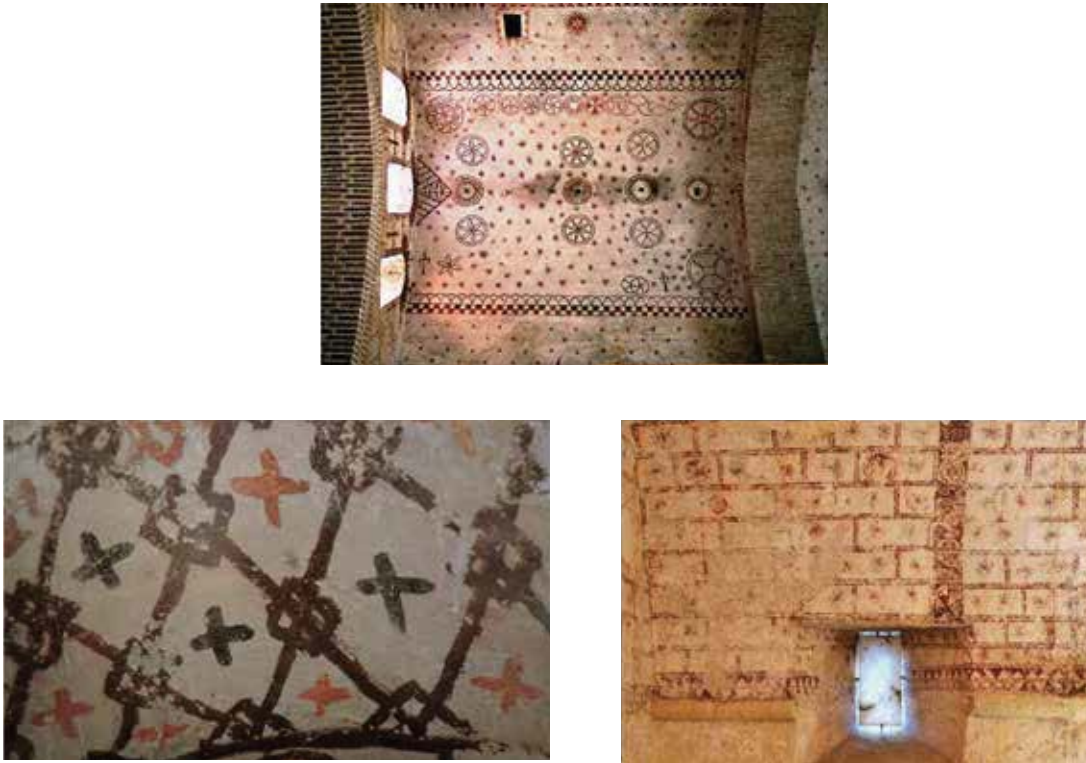
Fig. 6. Arriba: vista general de la bóveda de la Église Saint-Christophe-des-Templiers de Montsaunès .. Bajo izquierda: detalle de la credencia de la Iglesia de Santa María de Palau de Barcelona. – Los templarios guerreros de Dios. Bajo derecha: detalle de uno de los muros de la iglesia de San Vicente de Serrapio..

asemejar el templo terrenal a la Jerusalén celestial, asimilar ese despiece de sillares, de calidad y bien tallados, con la fábrica de la Jerusalén celeste. En la pintura que adorna el muro oeste de la bóveda de la capilla alta de la Église Saint-Theudère de Saint-Chef (Francia) que representa la Jerusalén celestial, podemos ver un perfecto interlineado en los muros que representan a la Jerusalén Del cielo.