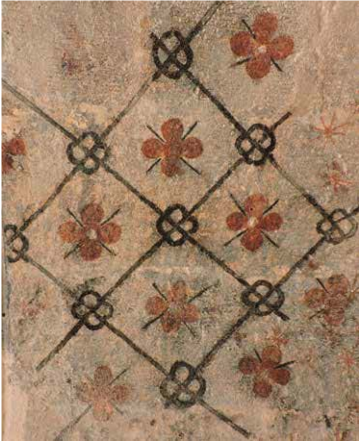
Fig. 4. Fragmento de la trama de rombos floreados conservado en la bóveda del arcosolio 5..