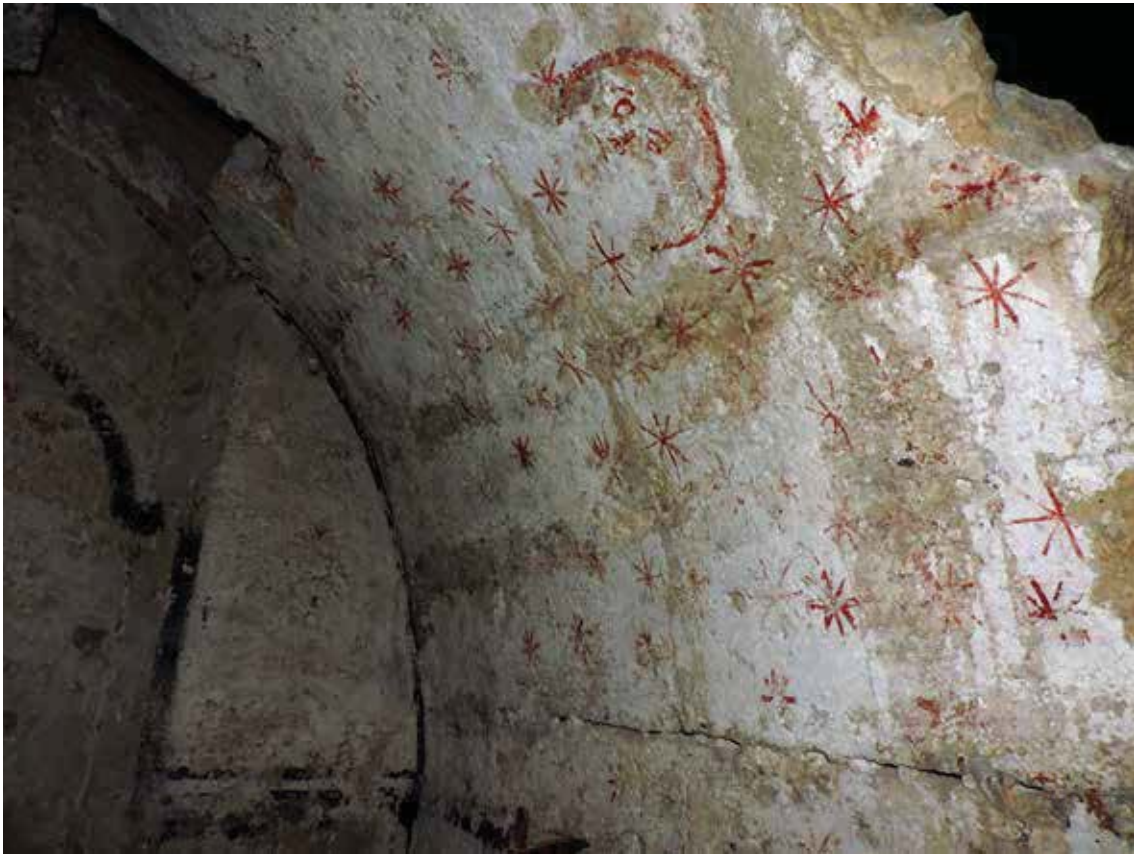
Fig. 8. Vista general de la luna y las estrellas de la parte derecha del intradós de la bóveda de la capilla oculta de la catedral de Valencia.

4 y 5. Creemos que el arcosolio 4 se conservó y no fue destruido por que todavía quedaba memoria sobre el difunto o difuntos que descansaban en él.