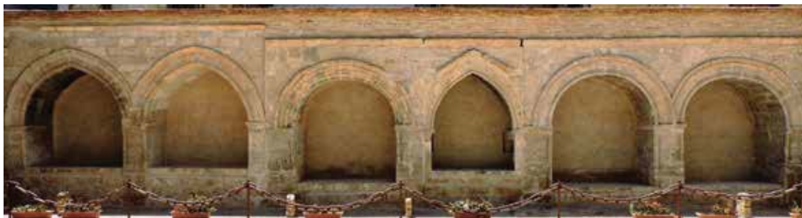
Fig. 2. Vista general de los arcosolios de la panda sur del cementerio tras su restauración. De izquierda a derecha se numeran del 1 al 6.

tener decoración figurada ejecutada tanto en pintura como en escultura. Cuando se trataba de pintura se solía representar el Calvario tal y como ocurre con el arcosolio de la Iglesia de Nuestra Señora del Rivero de San Esteban de Gormaz (Soria) y con el arcosolio del caballero Eiximen de Foces de la Iglesia de San Miguel de Foces (Huesca). Por otro lado, cuando se trataba de relieves escultóricos, se recurría con mayor frecuencia a escenas del enterramiento del personaje acompañado de un gran séquito de plañideras, tal y como aparece en el arcosolio