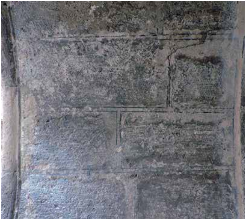
Fig. 5. Detalle de la decoración del despiece de sillares del arcosolio (Fotografía Emilio J. Díaz).