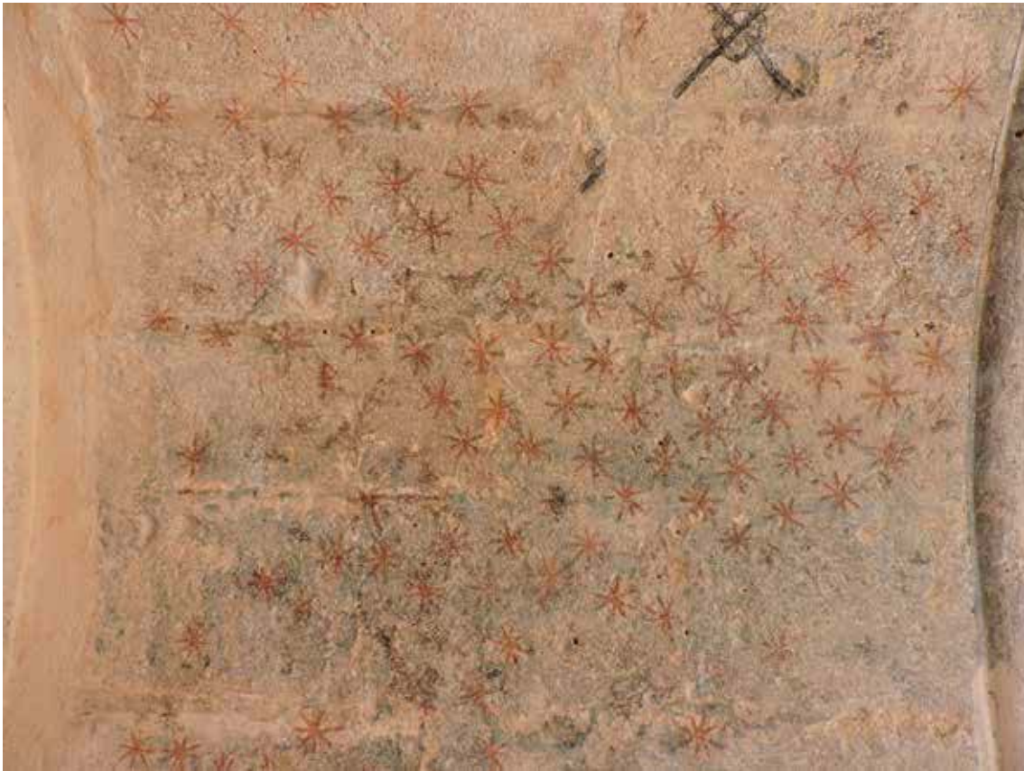
Fig. 3. Fragmento de las estrellas conservadas en la bóveda del arcosolio 4. (Fotografía Emilio J. Díaz).

El color rojo de las estrellas destaca sobre el color gris azulado del fondo. En el Medioevo el color azul era considerado un derivado del negro, pues el concepto del azul como color independiente aún no existía. Por supuesto el color sí que era posible encontrarlo en el entorno natural, pero las sustancias pigmentantes que dieran un azul estable eran muy escasas y costosas. Una de las maneras de obtenerlo era mezclar el color negro carbón y el blanco de carbonato cálcico para obtener un gris azulado que imitara el azul del cielo 13 .