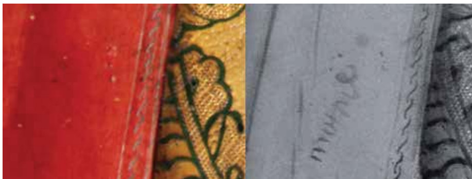
Fig. 8. Maestro de Portillo, Santa Catalina , panel de predela, Iglesia de San Miguel del Pino (Valladolid). A la izquierda detalle del manto con luz visible; a la derecha el mismo detalle con fotografía digital infrarroja que deja ver una palabra, quizá en referencia al pigmento a aplicar en esa zona.