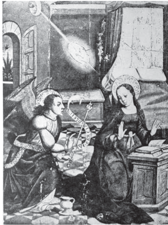
Fig. 4.- Maestro de Calzada, Anunciación , antigua colección parisina de Jean Dutey.

ten ciertas posibilidades –si bien mucho menores en mi opinión– de que sea la contraria la acertada”. 20