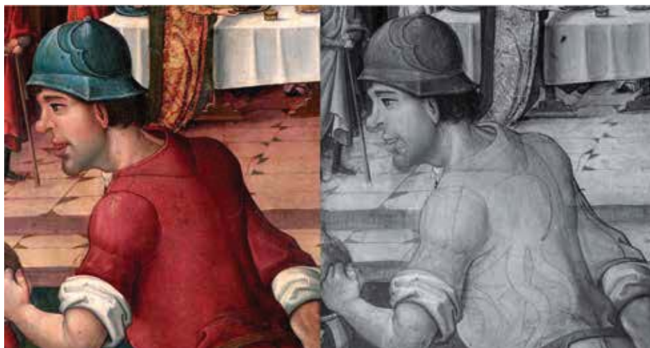
Fig. 7.- Maestro de Portillo, Degollación de San Juan , Iglesia parroquial de San Miguel del Pino (Valladolid). Detalle del sayón. Izquierda detalle con luz visible. Derecha detalle con fotografía digital infrarroja, donde se observa los arrepentimientos en el perfil del rostro (boca, nariz) y en la tipología de su indumentaria. La imagen completa del sayón presenta también cambios en la posición de las piernas, brazo izquierdo y la espada.