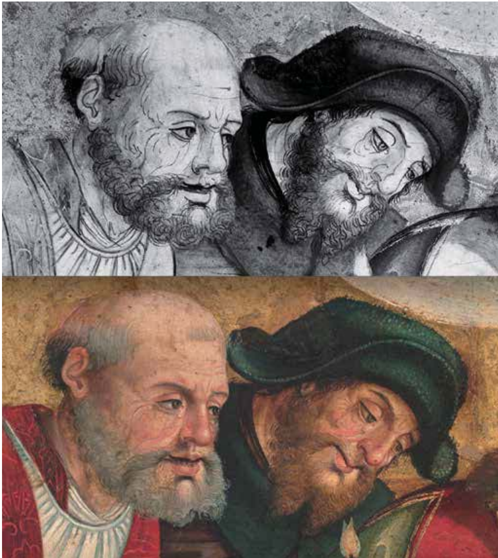
Fig. 13.- Maestro de Calzada, La Dormición de la Virgen , colección particular. Arriba: fotografía digital infrarroja de dos apóstoles; abajo mismo detalle con luz visible.

maestro trabaja las líneas generales con una pluma, dejando finísimos trazos que sirven para orientarle en cualquier aspecto del modelado volumétrico, desde detalles anatómicos como arrugas y marcas de expresión en las facciones de los personajes, hasta indicaciones sobre pliegues y drapeados.