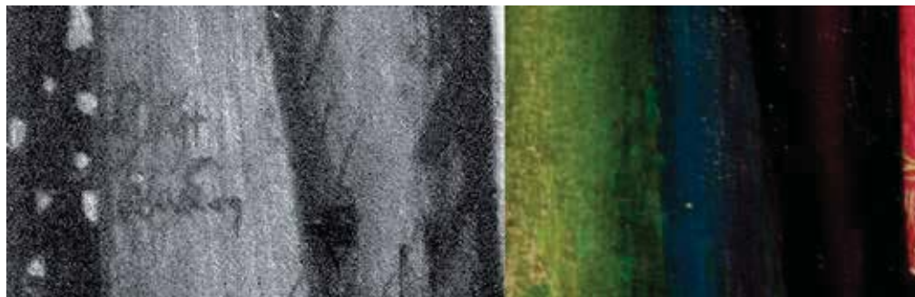
Fig. 11.- Robert Campin (atribuido). Detalle de la túnica de Santa Bárbara . En la fotografía digital infrarroja se observa la anotación del pigmento a utilizar, el azul, escrito en neerlandés.