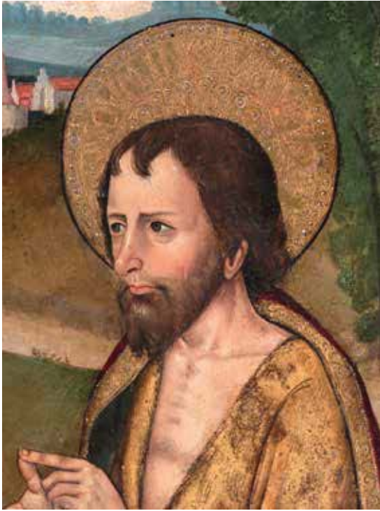
Fig. 2. Maestro de Portillo, Predicación de San Juan Bautista , detalle del torso de San Juan, en cuyo nimbo se localiza una inscripción, Iglesia de San Miguel del Pino (Valladolid).

Por todo lo expuesto sobre la identificación del Maestro de Portillo, creemos que debemos seguir manteniendo el apelativo de laboratorio en su día creado por Diego Angulo.