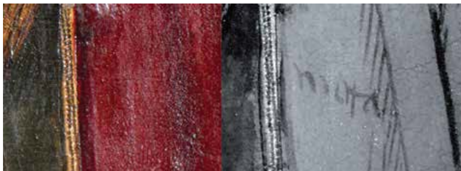
Fig. 9.- Maestro de Portillo, Predicación de San Juan Bautista , Iglesia de San Miguel del Pino (Valladolid). A la izquierda detalle del manto con luz visible; a la derecha el mismo detalle con fotografía digital infrarroja que deja ver una palabra, quizá en referencia al pigmento a aplicar en esa zona. (Fotografía: CAEM, Universitat de Lleida, Isidro Puig).