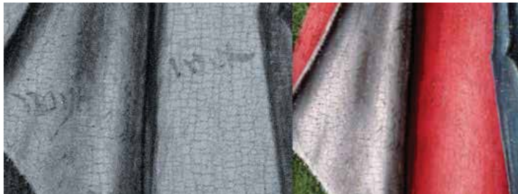
Fig. 12.- Robert Campin (atribuido). Detalle del manto de Santa Catalina . En la fotografía digital infrarroja se observa la anotación del color a utilizar, el blanco, escrito en neerlandés.