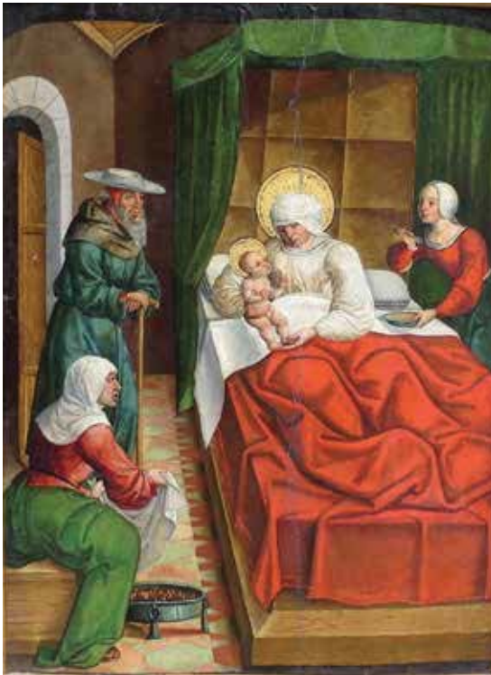
Fig. 3.- Maestro de Calzada, Nacimiento de la Virgen , 65 x 48 cm, colección particular.