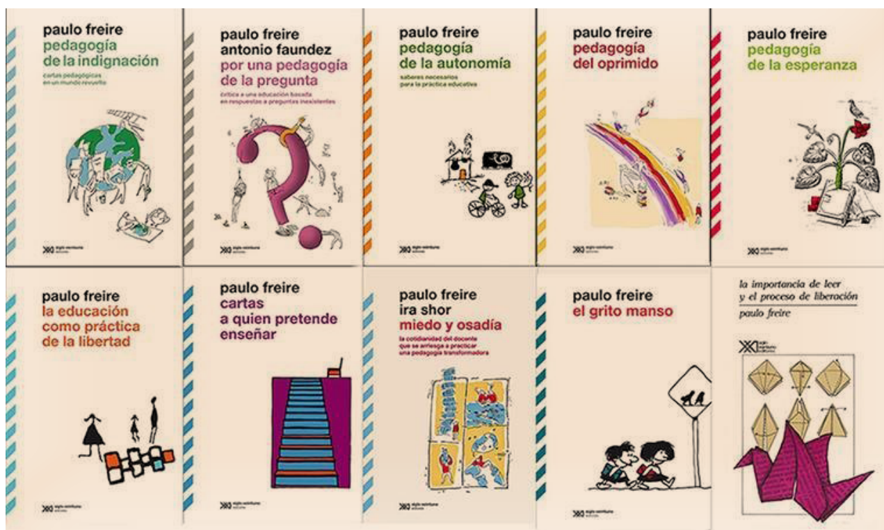
Fig. 2. Selección de diez libros de Paulo Freire

Allí participó con el gobierno en varios programas educativos para personas adultas y escribió su determinante libro Pedagogía del oprimido (1968). Fundamentalmente, la pedagogía del oprimido es una pedagogía humanista y liberadora que tendrá, pues, dos momentos distintos e interrelacionados. El primero, en el cual los oprimidos van desvelando el mundo de la opresión y se van comprometiendo, en la praxis, con su transformación, y, el segundo, en que, una vez transformada la realidad opresora, esta pedagogía deja de ser del oprimido y pasa a ser la pedagogía de los sujetos en proceso de permanente liberación. Freire escribió este libro conociendo muy bien desde niño la realidad del nordeste brasileño, en el que en un pasado muy cercano a él se había vivido en esclavitud y en su presente las clases rurales vivían en relaciones laborales de opresión, marginadas del proceso social, político y económico y sin participación alguna en las decisiones importantes para el país. Es por ello que en aquel entonces Freire impulsa a sus coetáneos a romper su pasividad y silencio, a reconocer la fuerza de su unidad transformadora y a que adquieran la capacidad crítica para relacionarse con la sociedad y que se liberen de sus ataduras, única posibilidad de cambio de la sociedad.