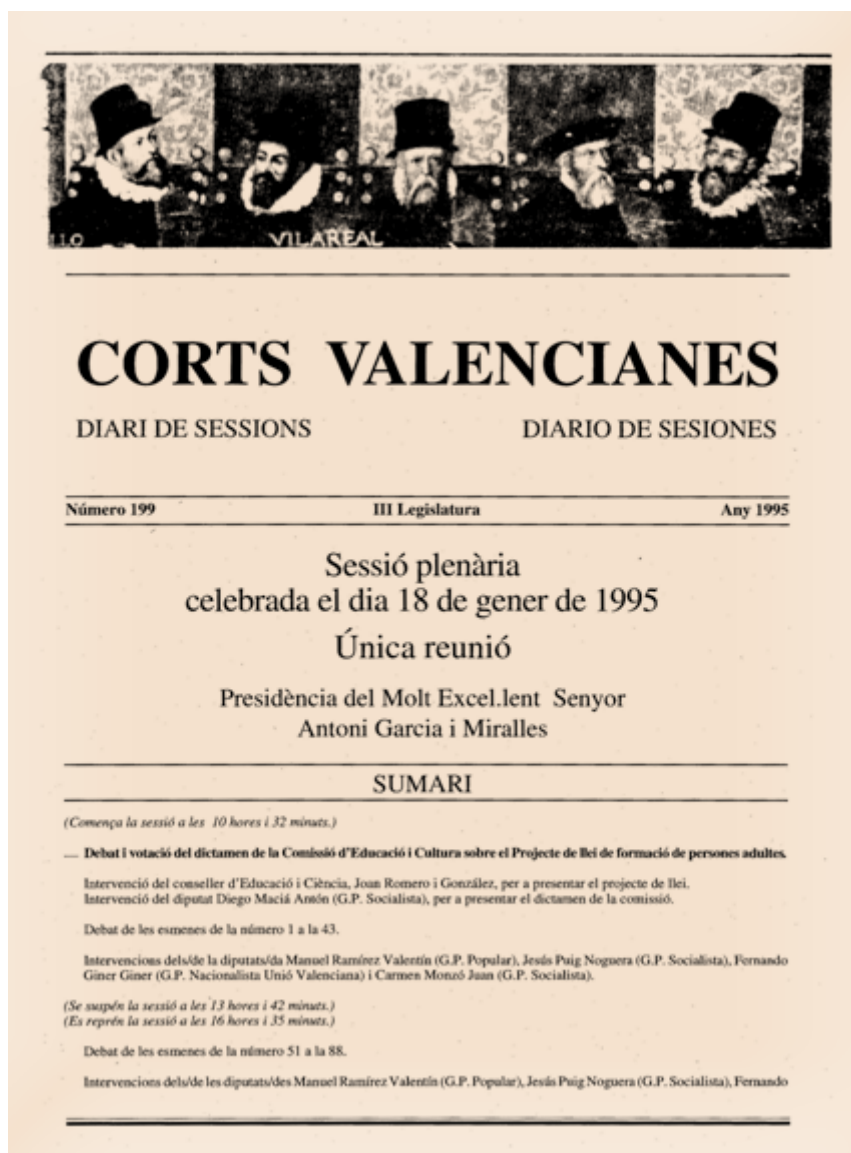
Fig. 3. Portada del Diari de Sessions de les Corts Valencianes de 18 gener de 1995.

intervención el esfuerzo realizado, agradecía su aportación a multitud de entidades y personas, singularmente al propio conseller, y manifestaba su esperanza y la de toda la Federación en un rápido y eficaz desarrollo de la Ley valenciana de FPA. Actos similares se celebraron en Valencia, en Castellón, y en otros municipios valencianos (Alboraia, Torrent, La Vall d'Uixó...).