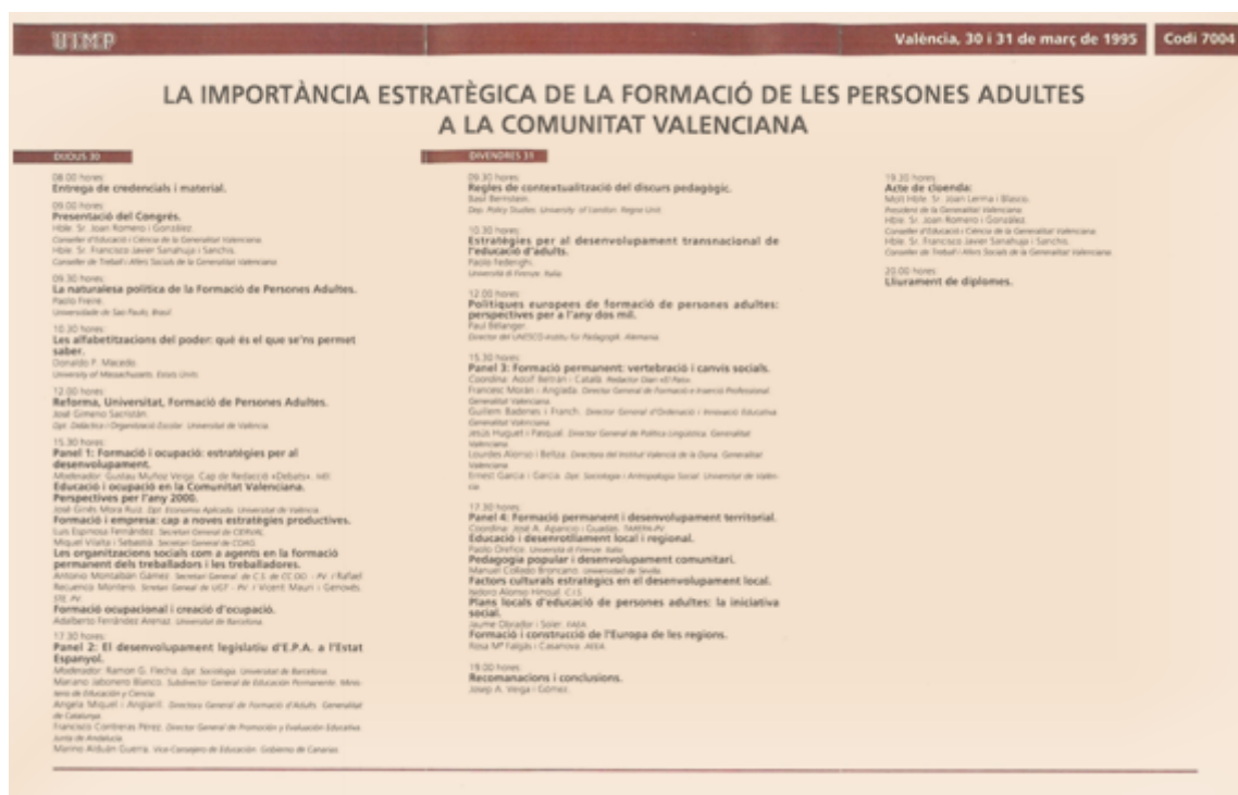
Fig. 2. Programa del Seminario Programa del Seminario La importancia estratégica de la formación de personas adultas en la Comunidad Valenciana. Tríptico.