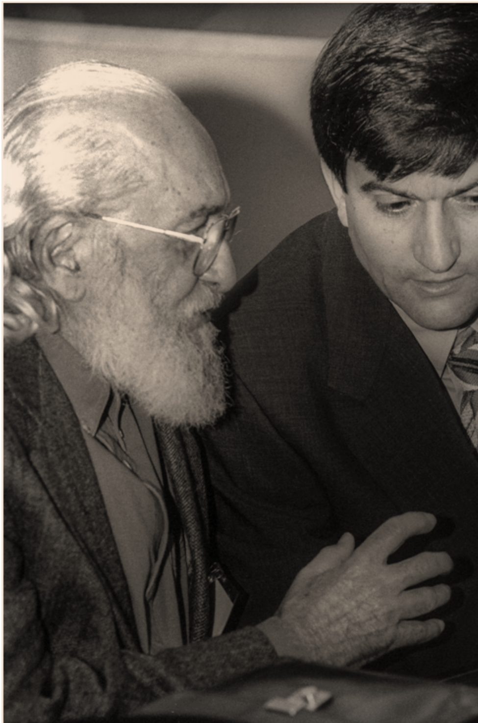
Fig. 6. Intervención de Paulo Freire.

corresponden con la realidad. Estas reflexiones sobre el saber ingenuo cobran si cabe mayor actualidad en tiempos y circunstancias como los que ahora vivimos, cuando se ha oficializado la existencia de realidades paralelas, de interpretaciones erróneas muchas veces intencionadas capaces de influir en la toma de decisiones trascendentales en todos los órdenes de la vida.