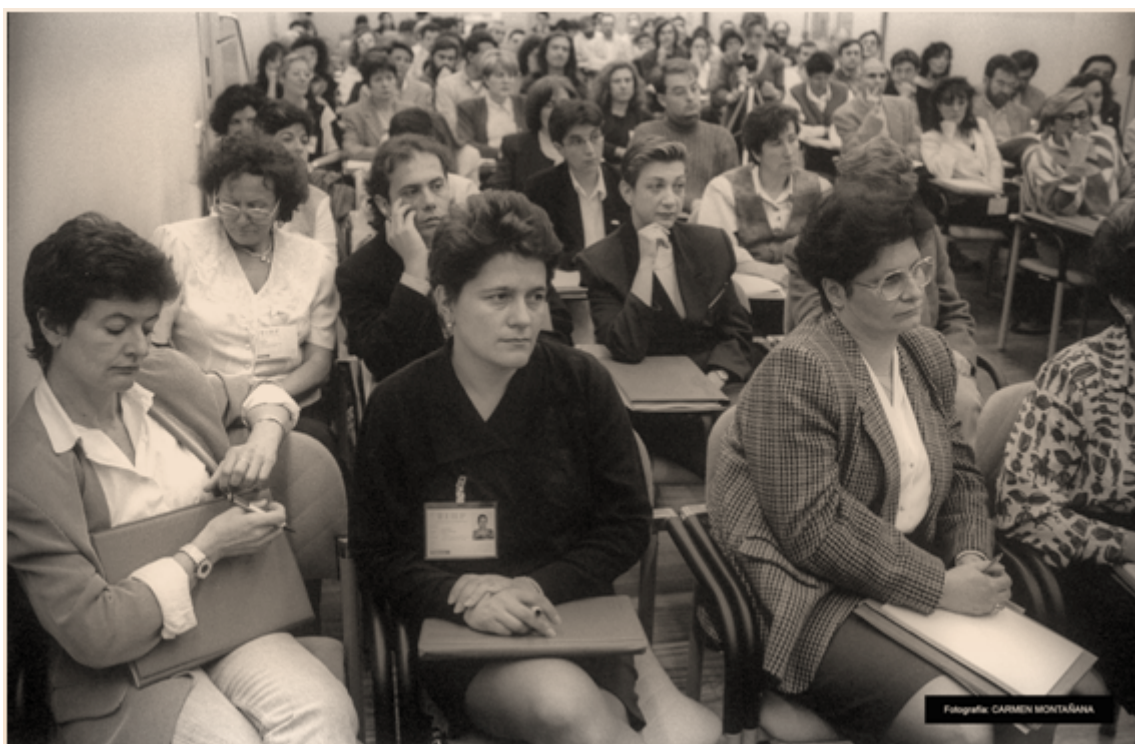
Fig. 5. Público asistente al seminario. Panorámica de la Sala I de la UIMP.

adultas. Se buscaban áreas comunes de intervención en una realidad institucional compacta y compartimentada en la que Educación educaba, Trabajo formaba, Cultura cultivaba y los Servicios sociales atendían, cuando los espacios de intersección entre estas y otras instancias eran totalmente permeables, a los ojos de quienes construíamos el día a día en ellas. Fueron aportaciones destacadas, y su trascendencia habría sido mucho mayor si no se hubiera producido el cerrojo político al desarrollo de la Ley de FPA tras la regresión en la Generalitat en mayo de 1995.