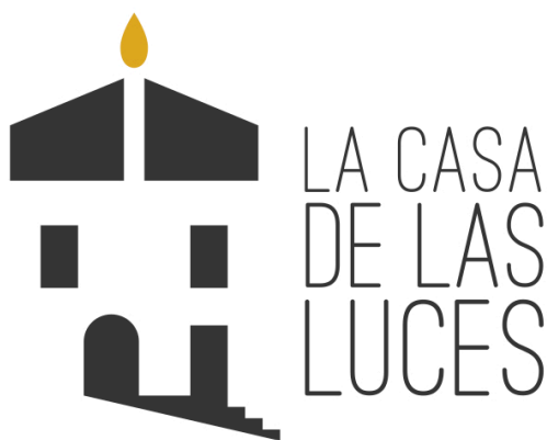
Figura 1. Logotipo de La Casa de las Luces.

La Ilustración es un movimiento intelectual que tuvo lugar en el siglo XVIII, el llamado Siglo de las Luces, y alagó sus ramas hasta principios del XIX. De ahí parte la idea del nombre del centro: La Casa de las Luces . Por un lado, Clemente fue un exponente de estas “luces” que buscaban alumbrar al mundo a través de la razón. Por otro, el edificio fue en origen una cerería, dedicada a la manufactura de las indispensables velas con las que se iluminaba en la época. Además, Titaguas cuenta desde hace unos años con la nueva pero arraigada tradición de La Noche de las Velas, celebración en la que el pueblo queda iluminado por miles de candelas dispuestas en sus calles. Las velas se convierten, pues, en un elemento identificativo del proyecto.