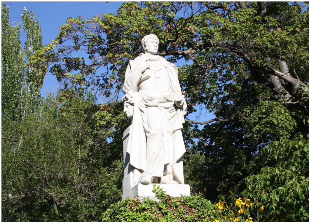
Figura 2. Estatua de Simón de Rojas Clemente en el Real Jardín Botánico de Madrid.

Para que la esencia del proyecto sea comprendida es necesario esbozar unos apuntes sobre la figura protagonista del mismo: Don Simón de Rojas Clemente, un intelectual de primera fila en la época que le tocó vivir. Y, precisamente, el convulso tiempo en que vivió le privó de gozar de una mayor trascendencia histórica. Gran parte de sus investigaciones quedaron inéditas y su trabajo muchas veces destruido.