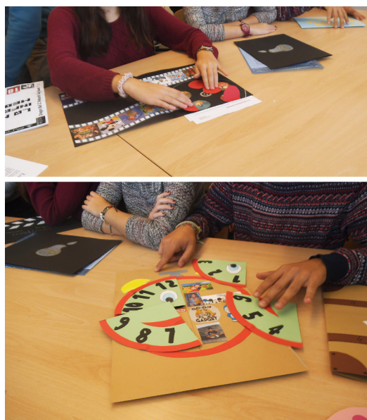
Figura 3. Puesta en común de los trabajos sobre narrativas visuales. Las pestañas permiten visionar distintos niveles de relato.

En la puesta en común de los trabajos también se evidenció que la mayoría veían las mismas series y jugaban a los mismos videojuegos, lo cual topaba con el mito de la diversidad que atraviesa los espacios educativos uniformes. Ahora bien, las cuestiones de género se hicieron fácilmente identificables. En las chicas, la Barbie, el tema de los cuidados en juguetes y videojuegos, y el gusto por utilizar scrapbooking . También la admiración por la maestra y el jugar a serlo. En los chicos, el movimiento, la lucha, el intercambio de tazos y cromos. Pero las cuestiones de género no solamente surgen de manera dualista, tener hermanos y amigos puede ampliar el abanico de gustos de las niñas y viceversa. Respecto a las diferencias étnicas, apenas se hicieron explícitas. En varios casos las madres compraron una muñeca negra, como instrumento contra el racismo, las cuestiones de raza y etnia no se mencionan más allá de las muñecas, juguete muy eficaz según explican las alumnas que la han tenido.