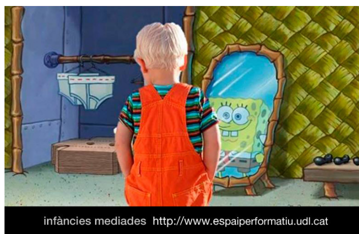
Figura 4. Manipulación de imágenes. Reflejos mediáticos.

Iniciamos esta segunda fase mediante la intervención de imágenes mediáticas de consumo infantil, nos reapropiamos de estas imágenes a fin de crear contradiscursos visuales o contraimágenes, mediante procedimientos de reapropiación y manipulación de imágenes.