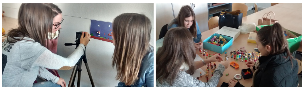
Figura 2. Stop Motion

El proyecto se implementó en dos fases, una primera centrada en las narrativas autobiográficas – visuales y escritas– del alumnado, y en la lectura y debate de textos referidos al tema de estudio (infancias y mediaciones); y la segunda donde se priorizó la creación de imágenes y contra-imágenes visuales, mediante el uso de programas de edición digital, con el fin de potenciar el sentido crítico y de desafiar los imaginarios mediáticos de consumo infantil. En la primera fase, los textos leídos se ponían en común en clase, dando lugar a interesantes debates. Las narraciones visuales se trabajaban básicamente con técnicas de collage, scrapbooking y papiroflexia, a modo de los cuentos tridimensionales, en algunos casos se añadía un tratamiento digital de las imágenes. Las imágenes se realizaron de manera individual, posteriormente se compartían los resultados y se comentaban en gran grupo. Estos trabajos iban acompañados de narraciones autobiográficas escritas. Así mismo se realizaron algunos vídeos de animación con la técnica de Stop Motion. Todo ello se usó posteriormente como material de investigación.