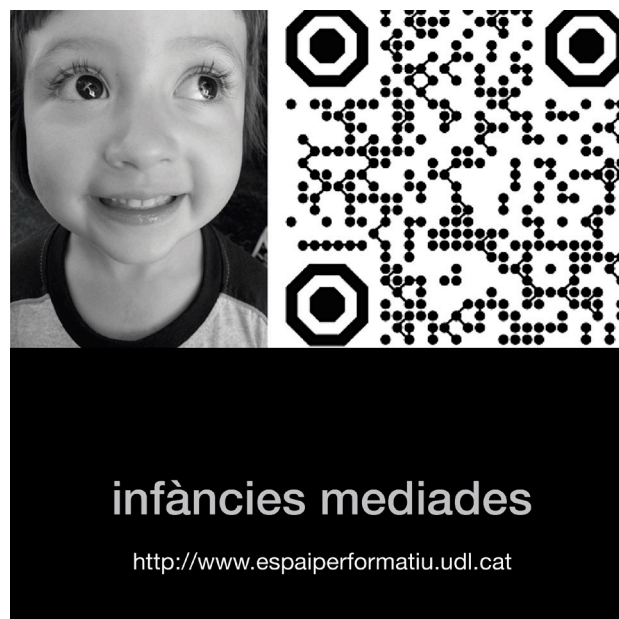
Figura 1. Imagen divulgativa del proyecto

Se implementó el curso 2016-2017, en las asignaturas de Artes Visuales y Sociología de Primaria y Doble Grado de la Facultad de Educación (FEPTS), Universidad de Lleida. Se realizó en 4 asignaturas y en 7 grupos diferentes. Contó con un total de 310 alumnas y alumnos participantes, 5 profesoras/investigadoras y un investigador externo (UNIZAR).