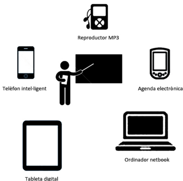
Taula 1. Alguns dels dispositius portables amb major difusió segons Brazuelo i Gallego (2011)