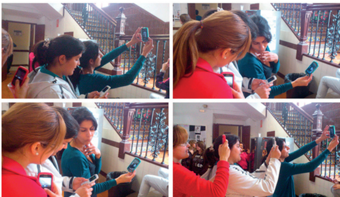
Fig. 1. David Mascarell Palau (2016) Campus d'Ontinyent movilitzados . Serie secuencia organizada con cuatro fotografías digitales del autor (2013).

Con esta intención, se puso en marcha dicha metodología en los dos campus universitarios de la Universitat de València, en la Facultad de Magisterio, donde el autor del presente trabajo imparte docencia. La finalidad fue que los estudiantes experimentaran una acción educativa de reflexión artística mediante las TIC, experiencia que, a su vez, se convertiría en un recurso generalizable a las aulas infantiles, en la futura vida laboral docente.