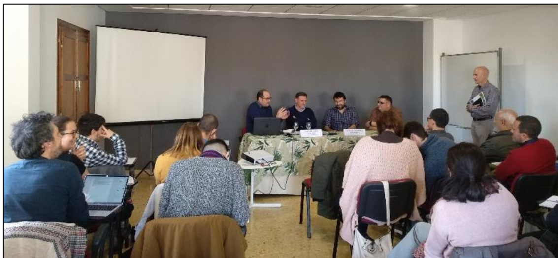
Figura 1. Mesa redonda

Fuente: Xavier Sirera Genís. 29 de noviembre de 2019. Algimia d'Alfara (Valencia)