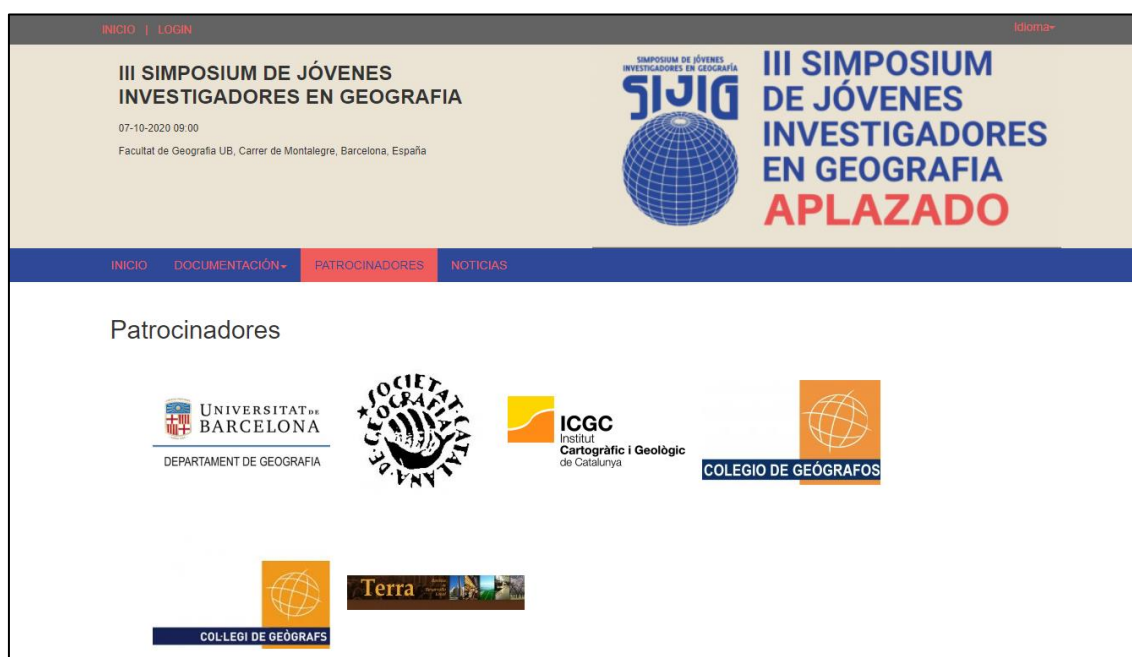
Figura 1. Ejemplo de participación en reuniones científicas