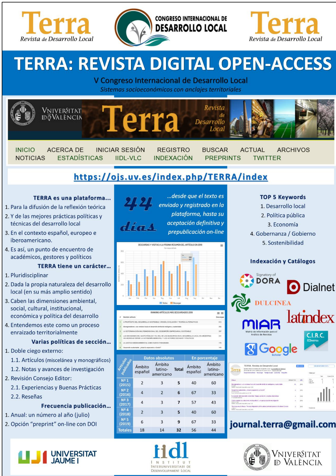
Figura 3. Póster confeccionado para la difusión de TERRA (2019) en el V Congreso Internacional de Desarrollo Local (Cartagena de Indias, Colombia)