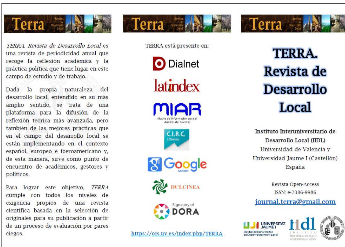
Figura 2. Tríptico confeccionado para la difusión de TERRA durante 2019