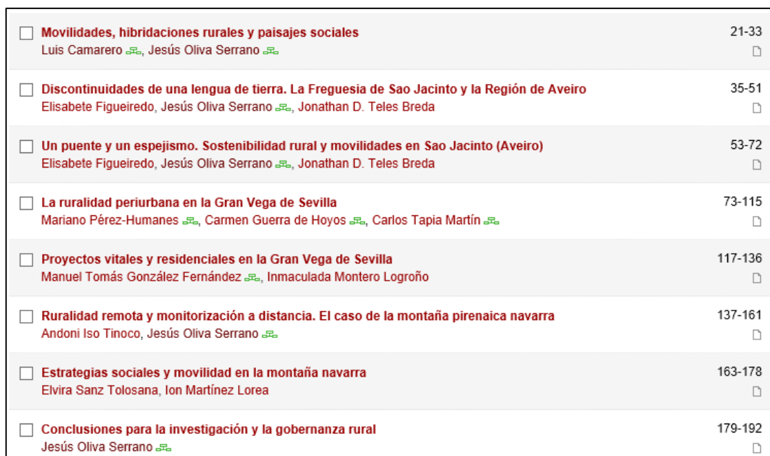
Figura 1. Índice de contenidos