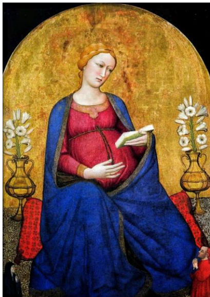
Fig. 4. Madonna del Parto , Antonio Veneziano, segunda mitad del siglo XIV, iglesia de San Lorenzo, Montefiesole, Pontassieve (Florencia).

de la Virgen de la Humildad con la Mujer del Apocalipsis se mantiene, aunque se manifiesta de manera diferente. El sol, semejante a los que se representan en el vientre de la Virgen de la Esperanza, aparece sobre el pecho de María en la primera imagen y a modo de broche, sujetando su manto, 32 en la segunda.