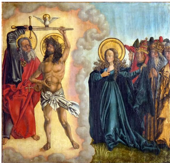
Fig. 19. Scala Salutis , Tríptico de María (detalle), Sebastian Dayg, 1511, Heilsbronn, iglesia de Santa María

mediadores sobre un suelo de hierba florido. Pero, mientras que María se arrodilla directamente en tierra, Cristo lo hace sobre la columna de su flagelación, separándolo ligeramete del espacio natural que recuerda su naturaleza humana. Otras obras, sin embargo, algunas más modernas incluso (Maestro de la santa Parentela, entre 1470 y 1475, Colonia, Wallraf-Richartz-Museum), sitúan a María, y también a Cristo, en una burbuja “celestial” con pavimento de azulejos, separada del ámbito terrestre, ocupado aquí por un grupo de santos con donante. El escalonamiento, y con él la graduación jerárquica entre Cristo y su madre, se manifiesta aquí casi imperceptiblemente con la postración de la Virgen, frente a la postura estante de Cristo. También a finales del siglo XV, en una pintura mural austríaca (Simon von Taisten, 1488, Lienz, Schloß Bruck), María y Cristo se encuentran a la misma altura, si bien ella tiene una presencia mayor por encontrarse de pie y con el manto desplegado para proteger a un nutrido grupo de fieles de las flechas que el Padre dispara desde lo alto. Cristo, por el contrario, se arrodilla sobre su sepulcro, por lo que tiene una menor presencia, pero a la vez ello le permite “aislarse” del suelo sobre el que sitúa el grupo mariano.