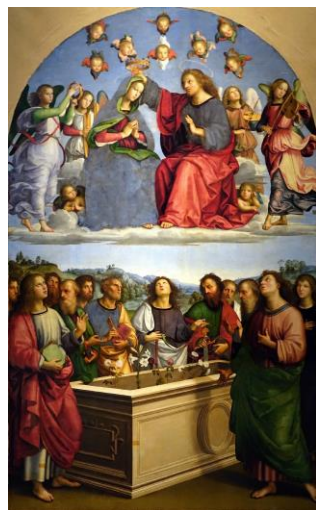
Fig. 16. Madonna della Cintola , Benozzo Gozzoli, 1450, Museos Vaticanos.