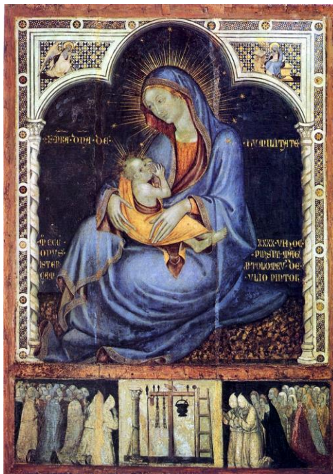
Fig. 2. Virgen de la Humildad , Bartolomeo Perellano o Bartolomeo da Camogli, 1346, Palermo, Galleria Regionale della Sicilia.

RESPEXIT HUMILITATEM ANCILLE SUE ECCE E[NIM] EX HOC B[EA]TA[M] ME, una cita del Magnificat , el himno pronunciado por la Virgen en respuesta a las alabanzas que le dirige su prima Isabel en la Visitación.