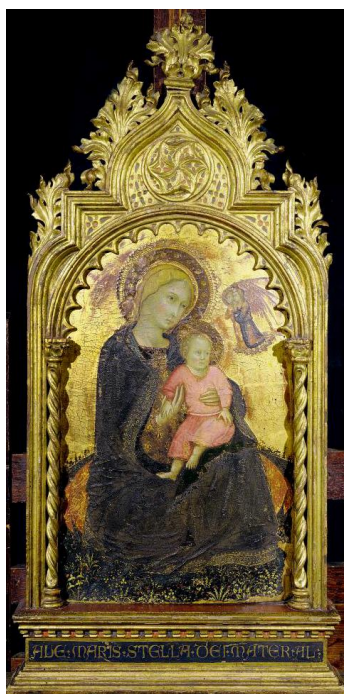
Fig. 7. Virgen de la Humildad , Andrea di Bartolo, fines del siglo XIV o principios del siglo XV, Nueva York, The Frick Collection.

Aunque los términos latinos terra y humus pueden ser considerados equivalentes, hasta el momento solo el primero ha sido mencionado en las fuentes asociadas a María y a la virtud que la llevó a la obediencia. En algunas imágenes, la terra donde se sienta la Virgen puede tratarse del orbe terrestre, como en la Virgen de la Humildad de Caterino Veneziano (fines de la década de 1370, Cleveland Museum of Art [Fig. 3]), donde la superficie se arquea considerablemente. Lo mismo sucede en algunas obras, en las que el suelo curvo está además cubierto con tierra ( humus ), como en la Madona dell'umilità de Giovanni da Bologna (ca. 1370, Accademia de Venecia) o la Virgen de la Humildad de Andrea di Bartolo (fines del siglo XIV o principios del siglo XV, Nueva York, The Frick Collection) [Fig. 7].