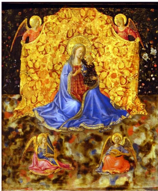
Fig. 9. Virgen con el Niño y ángeles , Benozzo Gozzoli, ca. 1449-1450, Bérghamo, Pinacoteca dell'Accademia Carrara.

proceden de la Corona de Aragón, sobre todo del reino de Valencia. Benozzo Gozzoli, en la Virgen con el Niño y ángeles (ca. 1449-1450, Bérghamo, Pinacoteca dell'Accademia Carrara) [Fig. 9], confía el enaltecimiento de la Virgen a un rico brocado que unos ángeles extienden tras ella. La tela tapa un fondo vegetal repleto de flores, pese a que la Virgen se encuentra aparentemente en un espacio doméstico determinado por un suelo marmóreo.