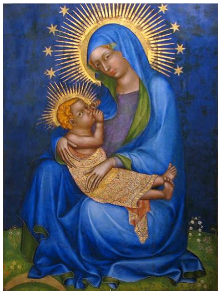
Fig. 5. Virgen de Vyšehrad , ca. 1360, procedente de la iglesia de los Santos Pedro y Pablo de Vyšehrad, Praga, National Gallery.

mariano. 33 Las primeras obras que presentan a María sobre un prado con hierba son relativamente tempranas, como la Virgen de Vyšehrad (ca. 1360, procedente de la iglesia de los Santos Pedro y Pablo de Vyšehrad, Praga, National Gallery) [Fig. 5] o la Madona dell'umiltà de Giovanni da Bologna (ca. 1370, Accademia de Venecia). De fines del siglo XIV, es un altar portátil (Accademia de Venecia) [Fig. 6] donde, a diferencia de los santos de las tablas laterales, María se sienta sobre la hierba, aunque se recorta sobre un fondo dorado. Esta variante, de hecho, se desarrolla en Italia, principalmente al norte, 34 hacia 1380. Pero no será hasta el siglo XV cuando adquiera relevancia. A principios de siglo, pasará a Francia y de ahí a Holanda. 35