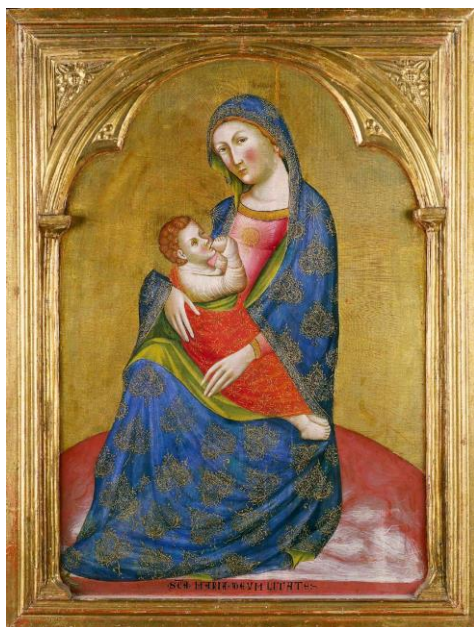
Fig. 3. Virgen de la Humildad , Caterino Veneziano, fines de la década de 1370, Cleveland Museum of Art.

Madre de Dios en tanto que “mediadora y abogada nuestra”, en palabras de san Bernardo, explica el éxito alcanzado por tipos iconográficos marianos como la Virgen de Misericordia, también llamada Mater Omnium , o incluso la Scala Salutis , que mencionaremos más adelante. Pero también la Virgen de la Humildad, debido al potencial que le otorga san Bernardo a esta virtud de María: “Tu integridad excuse en tu presencia la culpa de nuestra corrupción. Y que tu humildad, tan agradable a Dios, obtenga el perdón de nuestra vanidad”. 31 Sin embargo, es posible que, al menos entonces, Virgen de la Humildad no fuera un título asociado al tipo iconográfico, como tampoco lo era el de Mater Omnium , sino solo un epíteto en recuerdo de las cualidades de la Virgen.