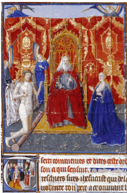
Fig. 18. Très belles heures de Turin , entre 1385 y 1390, París, Museo del Louvre, hoja II, RF 2025.

La representación conjunta de la mediación de Cristo y de María, pues no podríamos hablar de Scala Salutis si no está presente uno de los dos, acabará dando lugar a una intercesión combinada, obviando así el fundamento teológico del tipo: la intercesión escalonada. En estos casos, ambos mediadores se dirigen directamente a Dios, dando lugar a una composición triangular, en la que tanto Cristo como María se encuentran a la misma altura, en la base de una pirámide que tiene en la cumbre al Padre. Esta disposición no solo desvirtúa el tipo, sino que elimina cualquier jerarquía entre María y el Hijo de Dios. A partir del siglo XVI, no obstante, empezamos a encontrar imágenes que devuelven a María al lugar que le corresponde: la tierra, en tanto que su naturaleza es exclusivamente humana, a diferencia de Cristo, que además comparte con el Padre la divina.