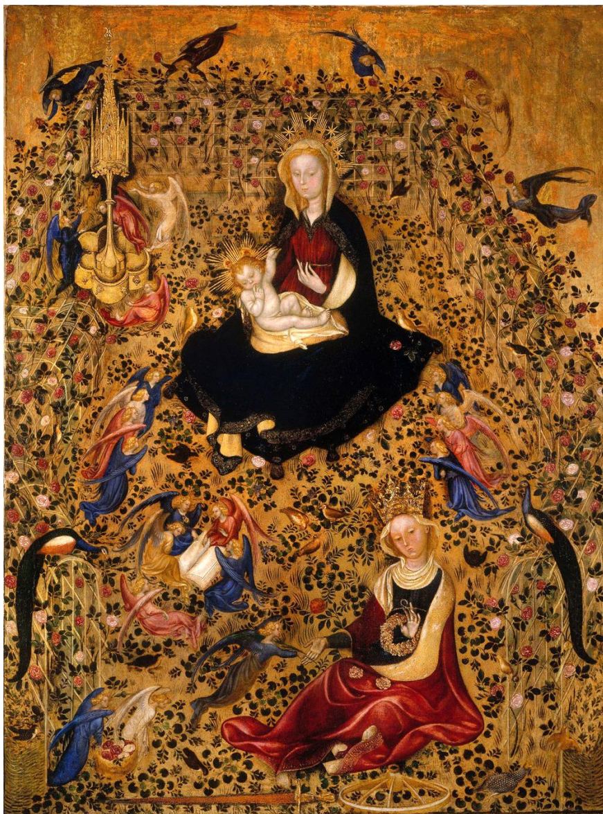
Fig. 11. Virgen del Rosal , Stefano da Verona, ca. 1420-1435, Verona, Museo del Castelvecchio

Más cercana a la Virgen de la Humildad, aunque algo más moderna, es la Virgen de la Rosaleda o del emparrado de rosas de Stefan Lochner (ca. 1440, Colonia, Walraf-Richartz-Museum). Ni siquiera la aparición de Dios Padre enviando el Espíritu Santo difiere de este tipo, pues lo hemos visto en otras imágenes. Sin embargo, la presencia de un rosal y un banco con césped tras la Madre de Dios es suficiente para negar su pertenencia al tipo de la Virgen de la Humildad, pues claramente se sitúa en un espacio ajardinado.