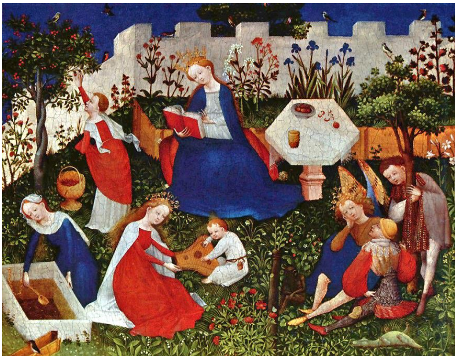
Fig. 10. Jardincillo del Paraíso , Maestro del Jardín del Paraíso, ca. 1410-1420, Frankfurt, Städelsches Kunstinstitut.