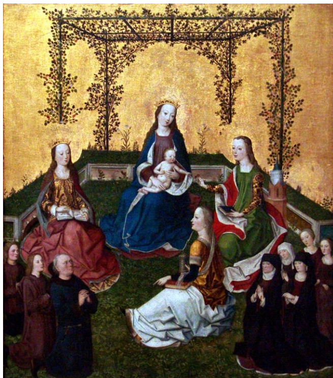
Fig. 12. Virgen de la Rosaleda , Círculo del Maestro de la Vida de María, ca. 1470, Berlín, Gemäldegalerie.

Del mismo modo, en una imagen alemana con idéntico título (Círculo del Maestro de la Vida de María, ca. 1470, Berlín, Gemäldegalerie) [Fig. 12], la Virgen con el Niño, acompañada de tres santos y un nutrido grupo de fieles se encuentran cercados por un banco con hierba y un emparrado con diversidad de flores.