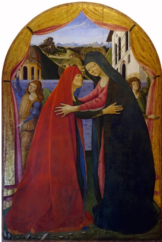
Fig. 20. Visitación de María a Isabel con ángeles , fines del siglo XV, Lucca, Museo Nazionale di Villa Guinigi.

[...] así como la tierra abandonada a su aridez es imposible que germine, pero regada con aguas se hace fértil, así también la virginidad, abandonada a su infecundidad, no concibe si no es fecundada por la gracia divina. Y como no es increíble que una tierra antes árida germine después de regada con la lluvia, tampoco lo es que conciba una virgen fecundándola la gracia del Espíritu Santo 68 .