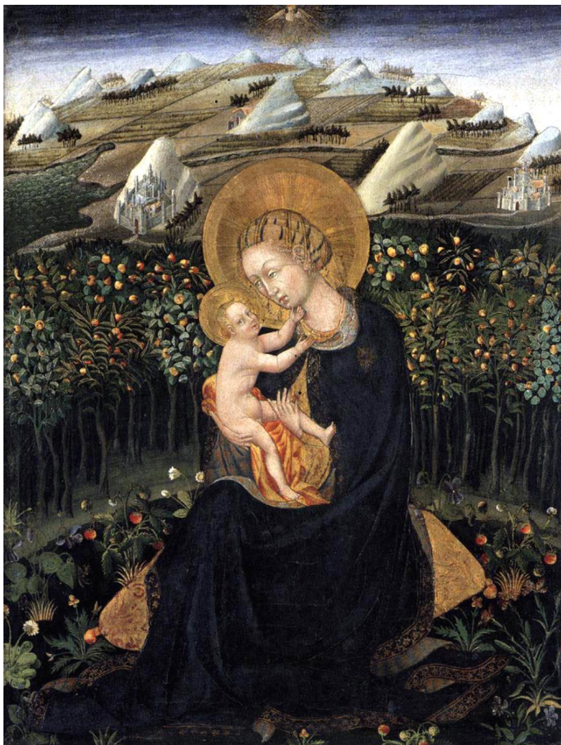
Fig. 13. Virgen de la Humildad , Giovanni di Paolo, ca. 1442, Boston, Museum of Fine Arts.

Un caso especial es la Virgen con santos de Rossello di Jacopo Franchi (primer cuarto del siglo XV, Barcelona, MNAC) [Fig. 14]. No es el único en el que la Virgen de la Humildad no aparece en contacto directo con el suelo y, sin embargo, no podemos sino contemplar su pertenencia a este tipo iconográfico, pues su postura es la misma que las de otras imágenes del mismo: sobre un cojín y con una rodilla por encima de la otra. Bajo María, en el ámbito terrenal, el suelo es herbáceo y hay además un jarrón con azucenas y rosas rojas. La ausencia de un jardín podría verse suplido con estas flores, dispuestas artificialmente y, por tanto, alejadas del estado silvestre del prado. Más allá de esta interpretación, las flores son las mismas que predominan en otras imágenes, que veremos a continuación.