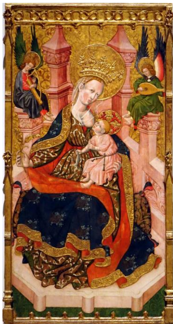
Fig. 8. Virgen de la Humildad , segon Mestre d'Estopanyà, ca. 1450, Barcelona, MNAC.

presente en el pensamiento cristiano. Las imágenes de este tipo no solo representaban la humildad de la Virgen, debido a su posición sedente, sino también su sublimidad, mostrando a María como Reina de los Cielos, con el sol, la luna y la corona de doce estrellas.