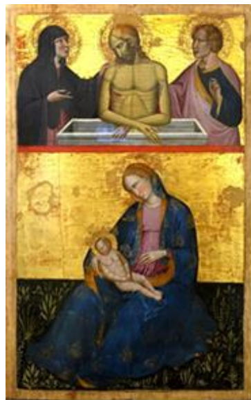
Fig. 6. Altar portátil con Virgen de la Humildad (detalle), fines del siglo XIV, Accademia de Venecia.

Independientemente del posible origen del tipo iconográfico en manuscritos franceses, se ha dicho que la humildad de la Virgen se evidencia en el hecho de estar sentada en el suelo, debido a la conexión etimológica de la palabra humilitas , cuya primera acepción es proximidad al suelo, con el término latino para tierra,