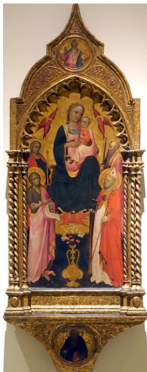
Fig. 14. Virgen con santos , Rossello di Jacopo Franchi, primer cuarto del siglo XV, Barcelona, MNAC.