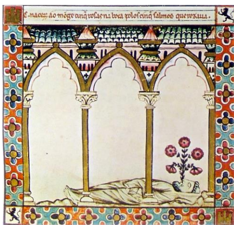
Fig. 15. Cantiga 56, Cantigas de Santa María , Alfonso X, El Escorial, Códice Rico.

Cuando volvió el convento, con rostro sereno habló de la siguiente manera: Jesucristo, su Madre y sus santos están aquí presentes; tienen puestas sus manos bajo mi mentón y ya van a recibir mi alma. Si dentro de un momento no he muerto no me creáis. No hubo terminado de decir estas palabras y al instante expiró, confirmando así con su muerte lo que había dicho. De su cuerpo comenzó a salir un olor tan penetrante que todos los que allí había salieron confortados con su suavidad. 62