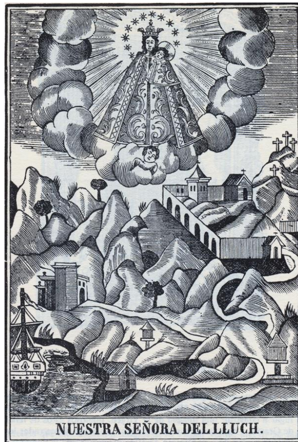
Fig. 11. Anónimo, Virgen del Lluch de Alzira, grabado, s/m, siglo XIX.

XIII, tras la conquista cristiana de los territorios musulmanes que poco después habían de conformar el reino de Valencia, las imágenes marianas habrían actuado como elemento referencial y cohesionador de la nueva sociedad cristiana.