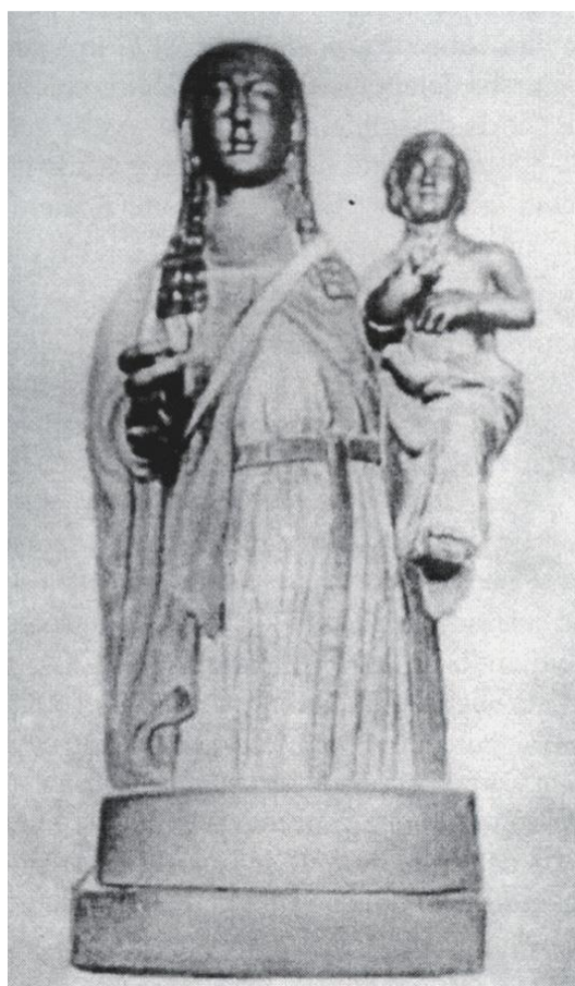
Fig. 7. Anónimo, Virgen de la Salud de Xirivella, terracota, s/m, primer tercio del siglo XV.