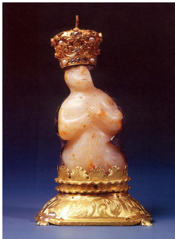
Fig. 1. Anónimo, Virgen del Lledó de Castellón de la Plana, talla en piedra, 7 x 3 x 2,9 cm, IV milenio a.C.- siglo XIV.

valencianos. Esta situación, con ataques de carácter iconoclasta, que afectaban a establecimientos religiosos, imágenes devocionales y objetos litúrgicos, junto a la incapacidad de las autoridades para integrar a la población hispanomusulmana, derivó en el bautismo forzoso de los que, a partir de ese momento, pasaron a llamarse moriscos, 1 y posteriormente en su expulsión de la península ibérica.