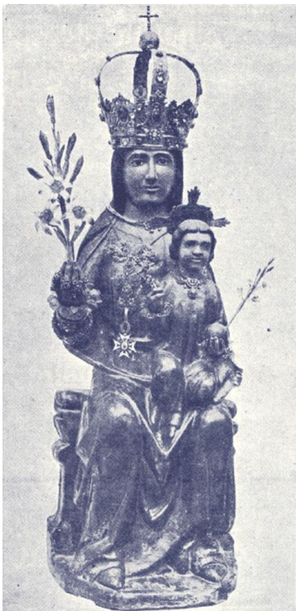
Fig. 14. Anónimo, Virgen de la Salud de Algemés, talla en madera, s/m, siglo XIV.

en un documento del archivo parroquial de 1617 en el que se funda un beneficio con el título de Sagrada Virgen María de la Misericordia en la parroquia del Salvador.