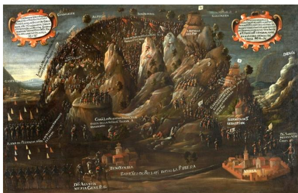
Fig. 3. Jerónimo Espinosa, Sublevación de los moriscos en la Vall de Gallinera , óleo sobre tela, 173 x 109 cm, 1613. Colección Fundación Bancaja, Valencia.

Las noticias, que oy se tienen del origen de esta santa Imagen sólo se fundan en la tradición de que el sitio que oy es comvento era un olibar, y que arando en el un devoto labrador topó con la extremidad de la Reja en una campana, que estava escondida al pie de un olivo, y levantandola halló en su concavidad la Imagen de la Virgen; sacaronla, y la edificaron allí una Iglesia collocando la imagen en el mesmo puesto donde estava el olivo [...]. Dan testimonio las pinturas antiguas, y tambien una señal de golpe que tiene en el rostro la Imagen ocasionado de que la fuerza del arado levantó la campana, y al bolver a caer tocó en el rostro a la Imagen el metal de la campana [...]. Dicesse que estava allí enterrada desde la perdida de España, y q[ue] sucedió el hallazgo antes de los años de 1300 en que tiene de antigüedad desde su restauración cerca de 400 años. 9