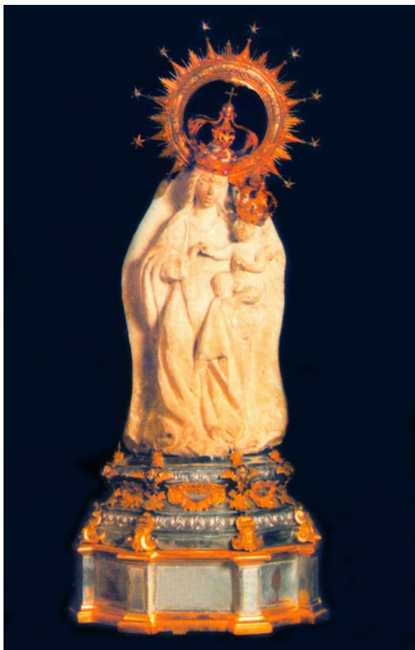
Fig. 9. Anónimo, Virgen de Campanar de Valencia, talla en piedra, 40 x 20,7 cm, segunda mitad del s. XIV.

perdió sus extremidades, pero de haber ocurrido antes de Trento, podría haber sido el motivo de su ocultamiento.