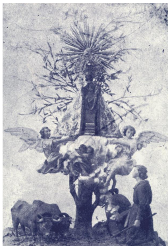
Fig. 2. Anónimo, Virgen del Olivar de Alaquàs, talla en madera, s/m, s/f.

Sí que podría estar relacionado con los reparos conciliares el cambio de relicario al que fue sometida la imagen posteriormente. A mediados del siglo XVII, la Virgen del Lledó, que hasta entonces se había conservado en un ostensorio, ocupó una teca ubicada a la altura del vientre de una imagen escultórica de la Inmaculada, datada en el siglo XVI. Esta nueva imagen-relicario aparece mencionada, ya sin lugar a dudas, en un inventario de los bienes del templo castellanense realizado en 1645: “ Item vna coroneta de or de la figura de nostra Señora que està en lo pit de la figura gran del altar ”. 6 Si la nueva disposición de la Virgen del Lledó, que también dio lugar a una nueva imagen de la misma, fue consecuencia de las directrices contrarreformistas solo podemos suponerlo.