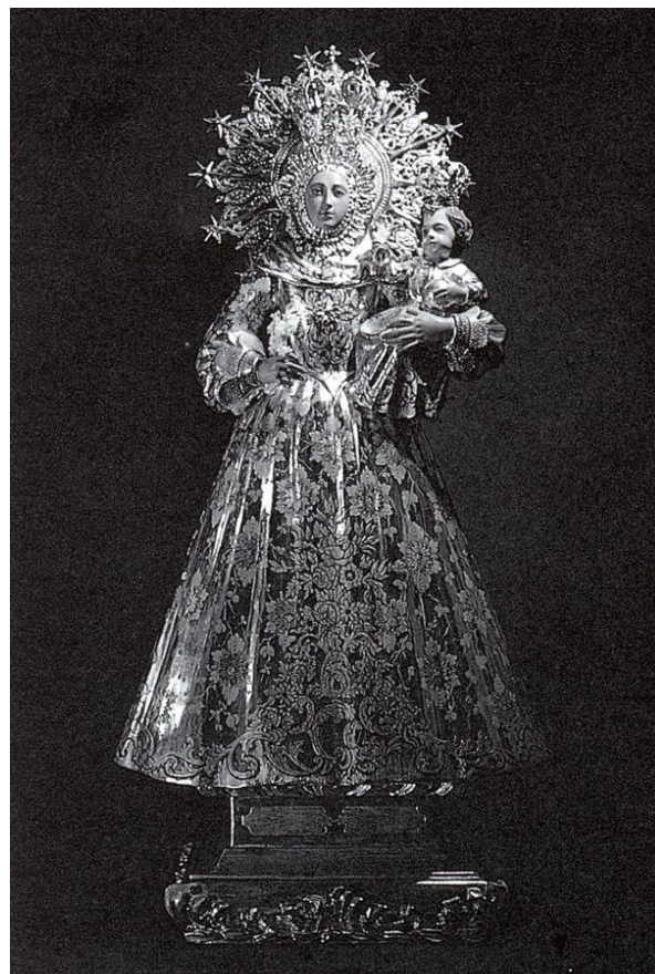
Fig. 13. Anónimo, Virgen de los Afligidos de Alfara d'Algimia, s/t, s/m, primera mitad del siglo XVII.

servían del legendario asociado a las imágenes medievales.