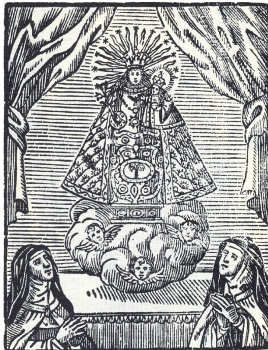
Fig. 6. Anónimo, Virgen de la Paciencia de Orpesa, grabado, s/m, s/f.

consideraba bárbaro el acto iconoclasta en sí mismo, sino las intenciones con las que se llevaba a cabo.