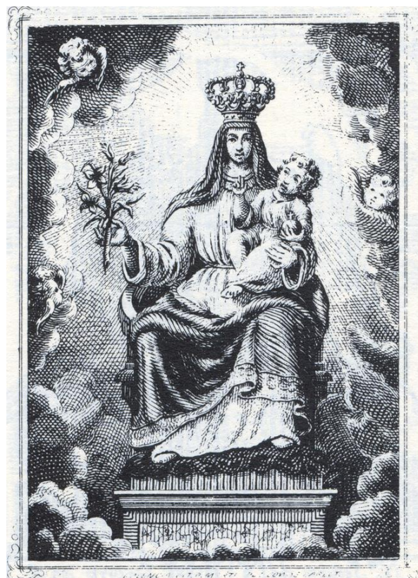
Fig. 4. Anónimo, Virgen de las Injurias de Callosa d'en Sarrià , grabado, s/m, siglo XIX.

Del mismo modo, se revisten de una especial condición sagrada aquellos objetos que habían sido escarnecidos e incluso sustraídos por corsarios sarracenos, o por los moriscos locales a raíz de su levantamiento por el decreto de expulsión de 1609 (Fig. 3), y que habrían sido recuperados gracias a gestas no exentas de ayuda providencial. Seguramente, se tendría muy presente el saqueo de Torreblanca, a fines del siglo XIV, por una flota de piratas berberiscos, que se llevó la custodia con la hostia consagrada 10 – posteriormente recuperada– y más de cien prisioneros.