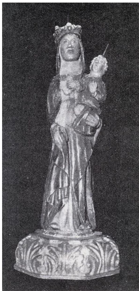
Fig. 10. Anónimo, Virgen de los Ángeles de Sant Mateu, talla en piedra, 58 x 25 cm, siglos XV-XVI.

beate virginis Marie dels Angels ” 21 cinco días más tarde, este hizo inventario de lo que se hallaba en la misma. Por otro lado, Vicente Cerdá, poseedor del ius patronatus de la ermita de San Antonio y del dominio útil de la montaña, había empezado a construir el nuevo santuario dedicado a Nuestra Señora, pero desconfiando de poder llevarlo a término, decidió donarlo todo a la villa en 1585: “ Per quant ell ha fet fer la capella de Nostra Señora en dita Iglesia ahon Nostra Señora es estada tots temps y per ahuy está ”. 22 Probablemente, la expresión tots temps se refiere al tiempo transcurrido desde el supuesto descubrimiento de la imagen.