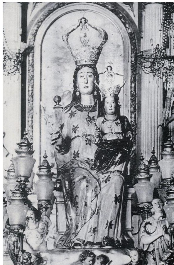
Fig. 15. Anónimo, Virgen de la Misericordia de Borriana, talla en madera, s/m, principio siglo XIV.

ciertas imágenes conservaron el favor del pueblo desde época medieval, aunque algunas vieron modificados sus títulos. En la baja Edad Media aquellos pertenecían principalmente al grupo de advocaciones populares-circunstanciales, referentes a determinados acontecimientos y circunstancias espacio-temporales, que el pueblo ha relacionado de alguna manera con la Virgen o en los que ha encontrado signos de una intervención de María; entre ellos el nombre del pueblo o del lugar en el que ha sido encontrada una imagen, por ejemplo, un árbol como el almez – lledoner en valenciano–, del que deriva la Virgen del Lledó, o el olivo, que dio nombre a la Virgen del Olivar. El segundo grupo de advocaciones son las soteriológicas y responden a los misterios de la vida de María, que están íntimamente relacionados con los de Cristo.