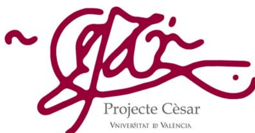
Fig 2. Logo del Projecte Cèsar.

A cambio de la digitalización, Proquest/UMI conservará una copia del documento para su comercialización a través de su base de datos ProQuest Dissertations & Theses A & I, asignando a cada una de las tesis un ISBN. Por otro lado, facilitará otra copia a la Universitat de València que podrá ser distribuida en abierto a través del repositorio institucional.